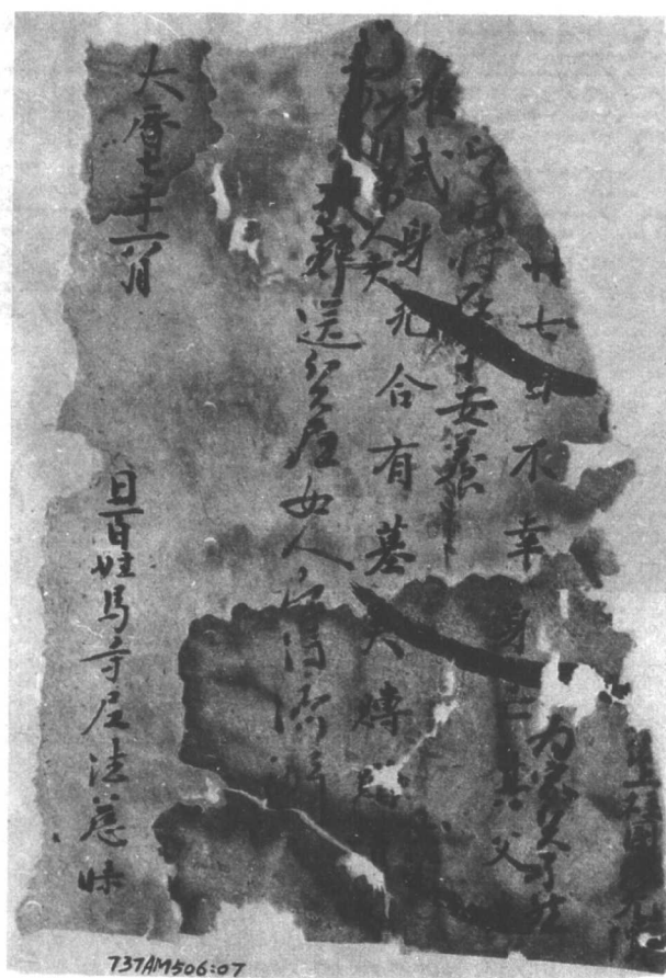
圖三 唐大曆七年(772年)馬寺尼法慈為父 張無價身死請給墓夫贈事牒