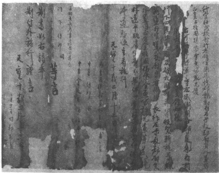
圖一 唐天寶十載(751年)制授張無價游擊將軍官告(一)