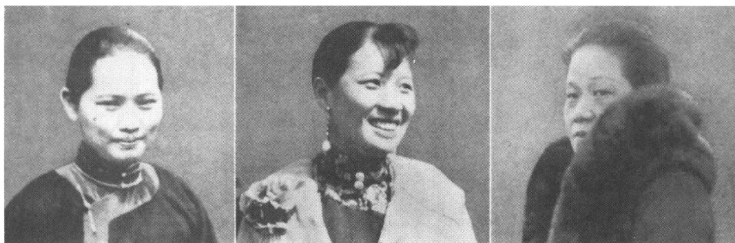
宋家三姐妹：（由左至右）宋庆龄、宋美龄、宋霭龄。