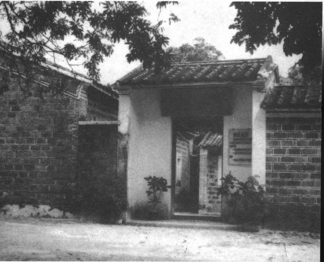
海南島文昌宋氏祖居。