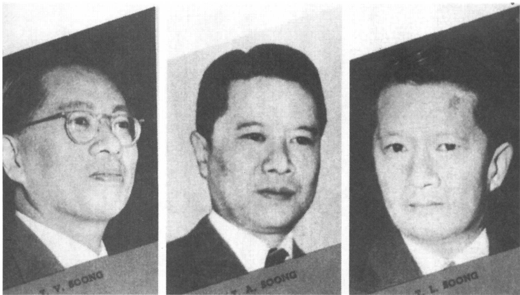
宋家三兄弟：（由左至右）宋子文、宋子安、宋子良。