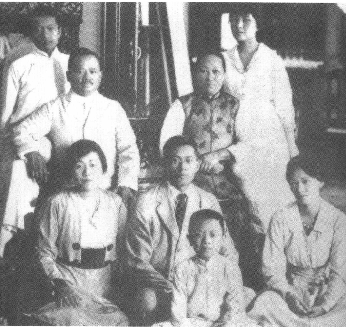
宋查理一家。前排：三子宋子安；二排左起：长女宋霭龄、长子宋子文、次女宋庆龄；后排左起：次子宋子良、父亲宋查理、母亲倪桂珍、三女宋美龄。