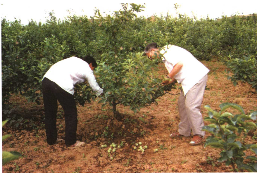
给红富士苹果树疏果