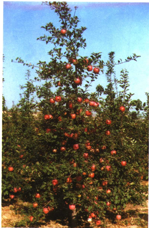
结果的主干形红富士 苹果树（杨良杰摄）