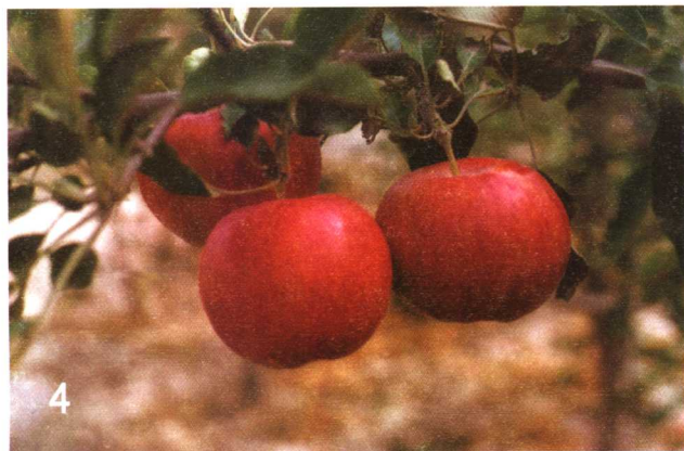
长放枝上的红富士 苹果