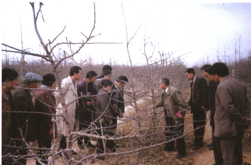
果树专家给果农进行红富士苹果树整形修剪指导