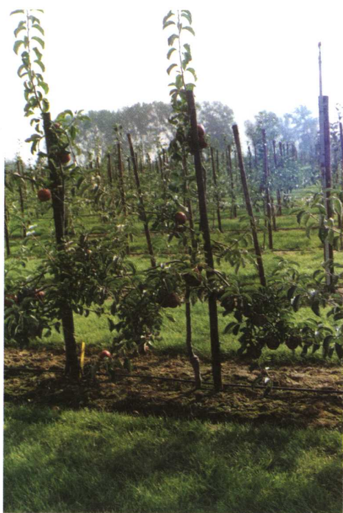
实行生草栽培制的红富士 高密果园