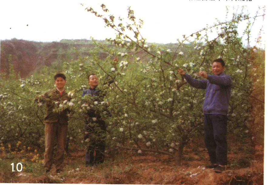
给红富士苹果树疏花