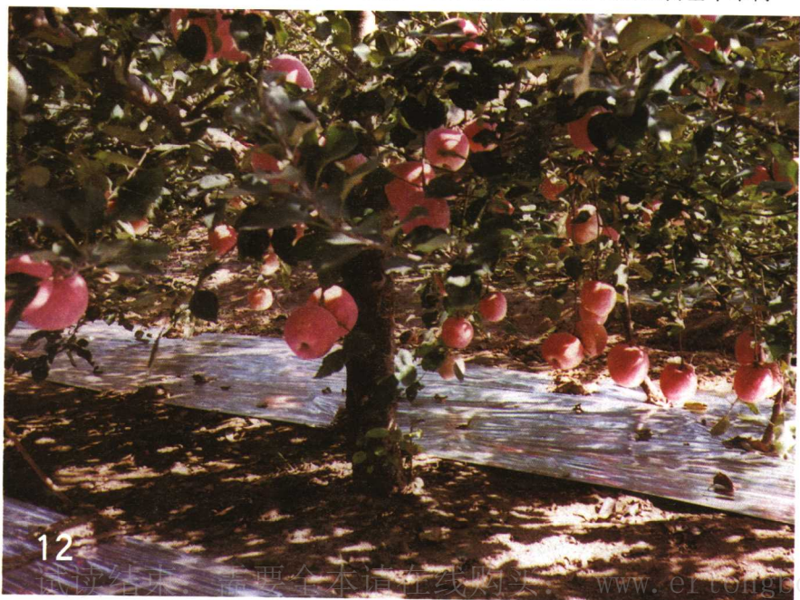
实施套袋+银膜+增红剂1号管理方式的红富士苹果树