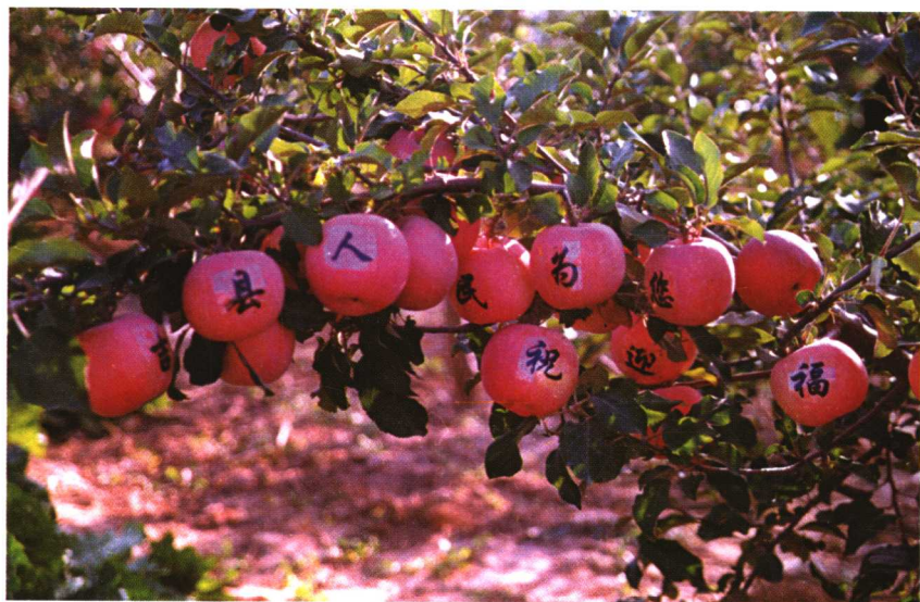
生长在树上的套袋带字红富士苹果