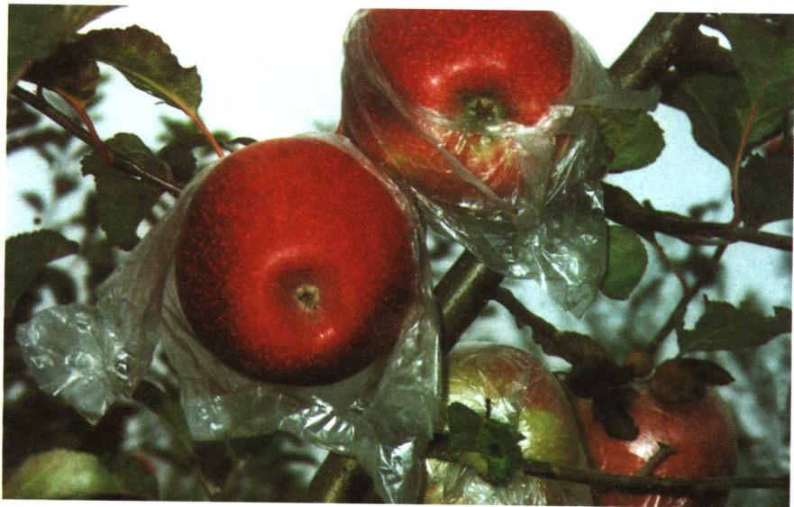
红富士苹果套膜袋后的增色状