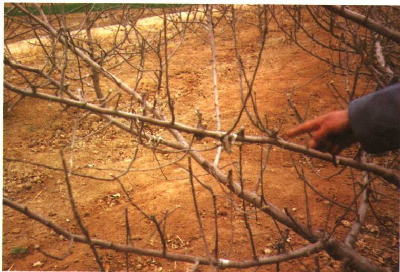
红富士苹果树背上枝扭梢状