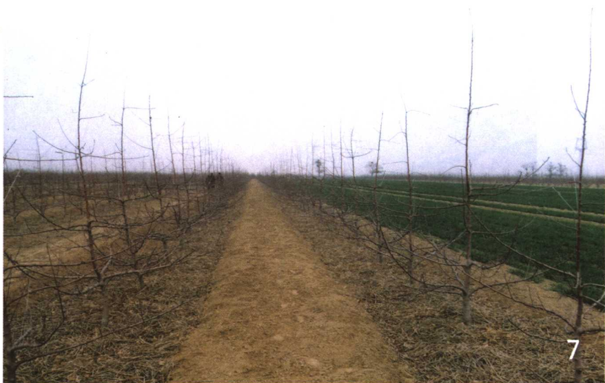
果园内标准细长纺锤形红富士苹果树