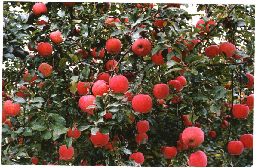
满树红富士苹果密如繁星