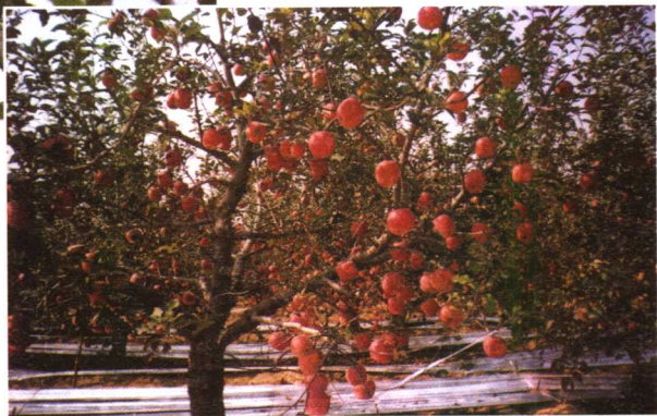
长富2号结果状