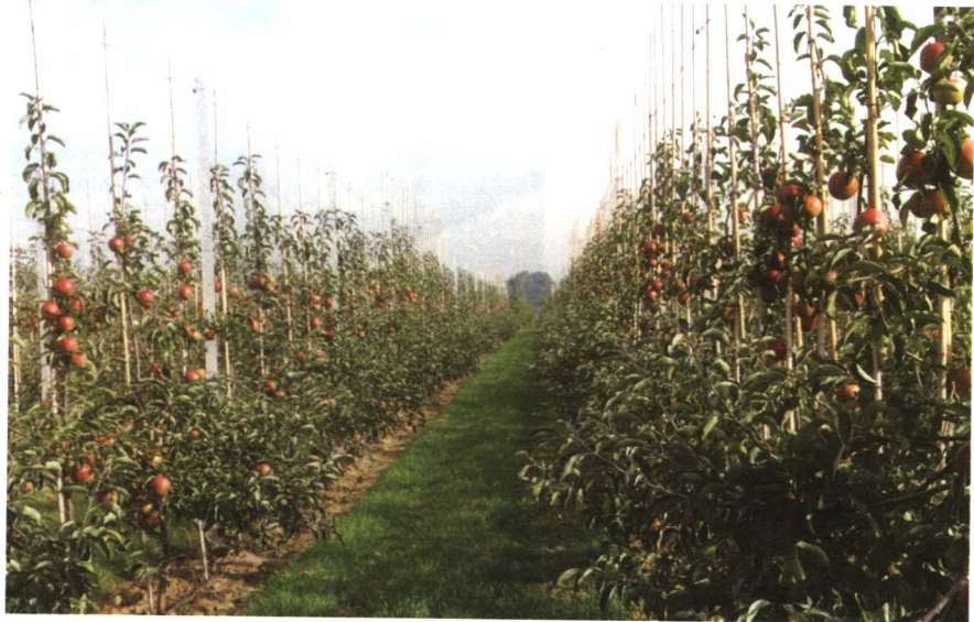
高密园红富士苹果树生长结果状