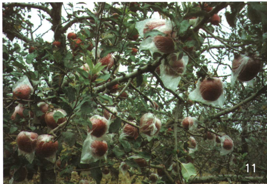
红富士苹果树果实套塑膜袋状