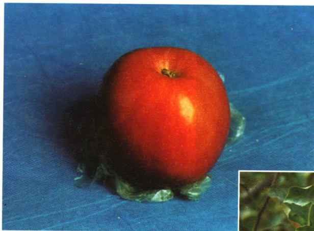
鲜亮的套袋红富士苹果