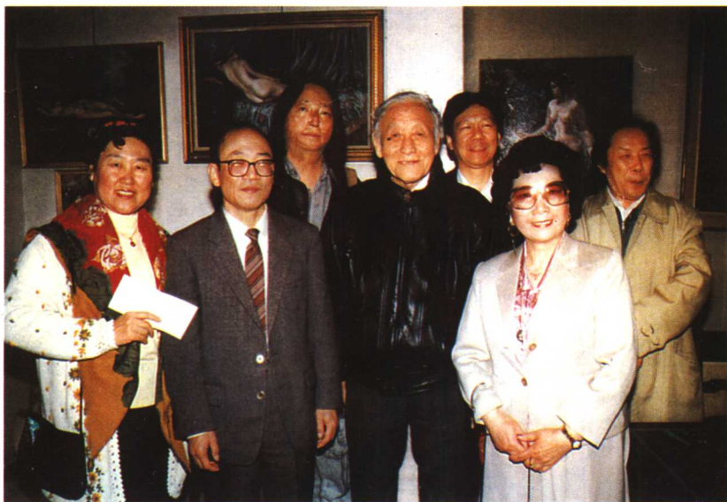
著名华人艺术家吕霞光（中）在杨光素画展上