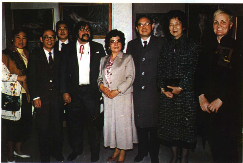
中国驻法大使蔡方柏夫妇与使馆工作人员参观杨光素画展后合影