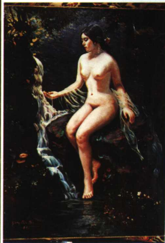
日本少女玛莎戈（油画）