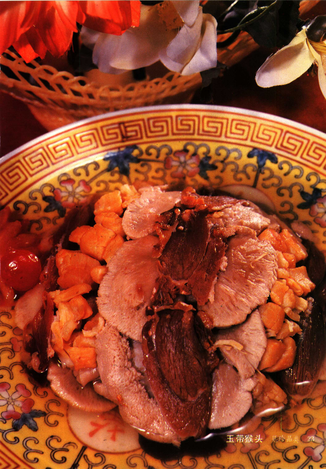
玉带猴头 见珍品类 23