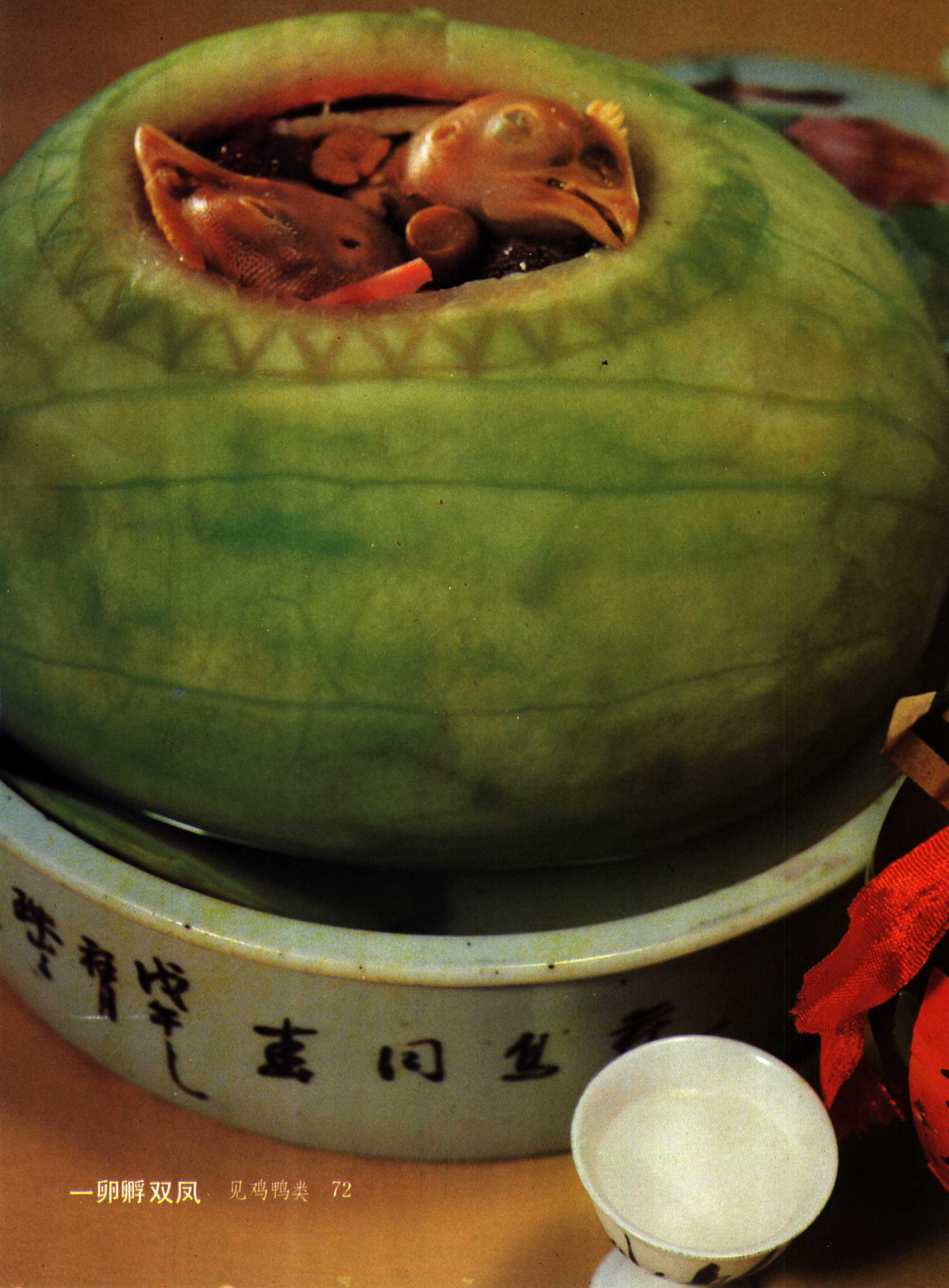
一卵孵双凤 见鸡鸭类 72