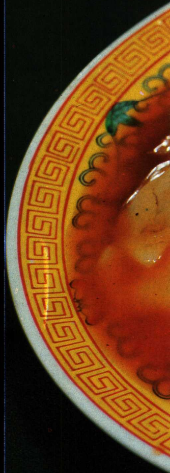
△ 鸭膀烧干贝 见珍品类 30 ▽ 葫芦大吉翅子 见珍品类 13