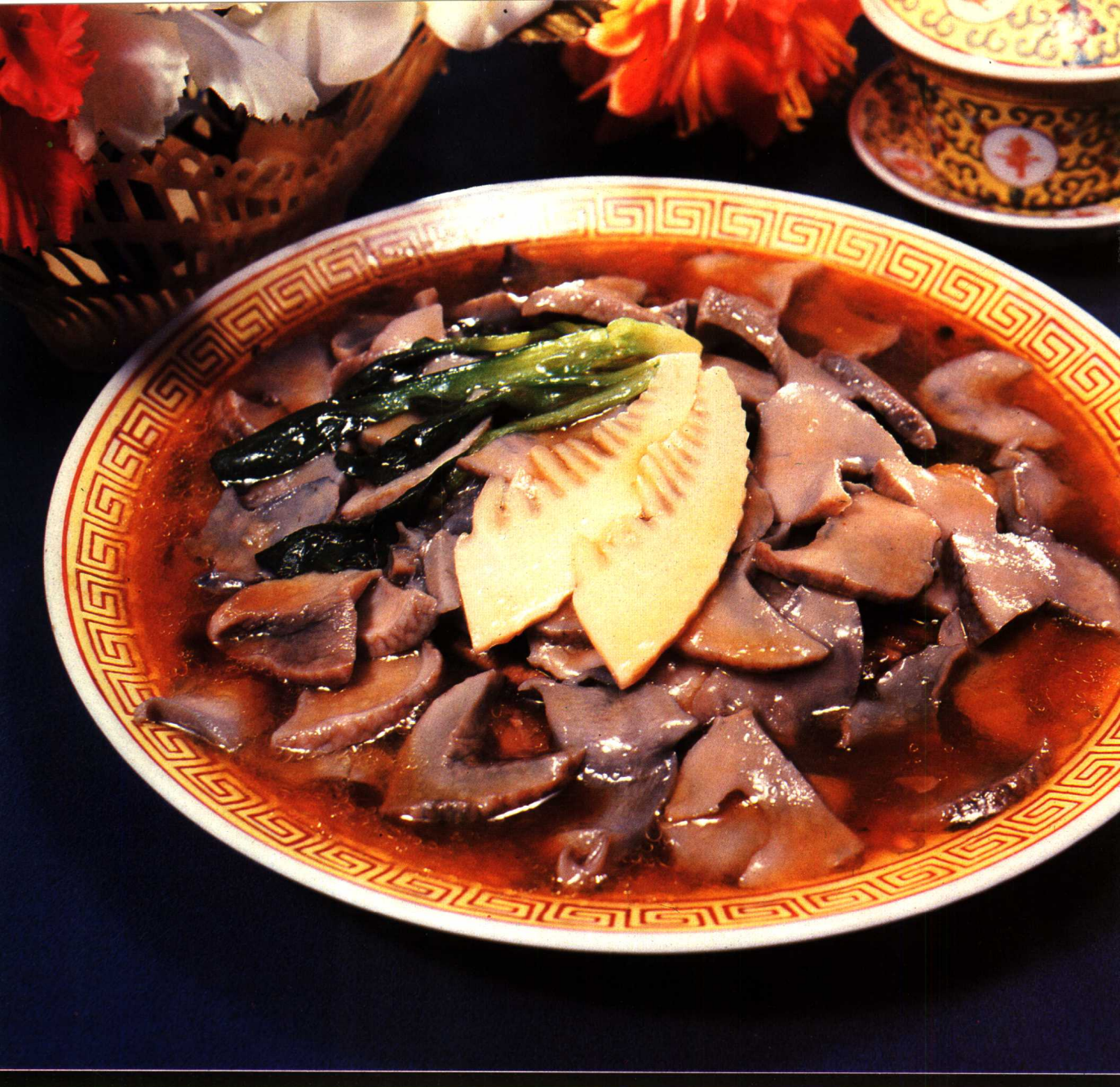
红烧鲍鱼 见珍品类 21