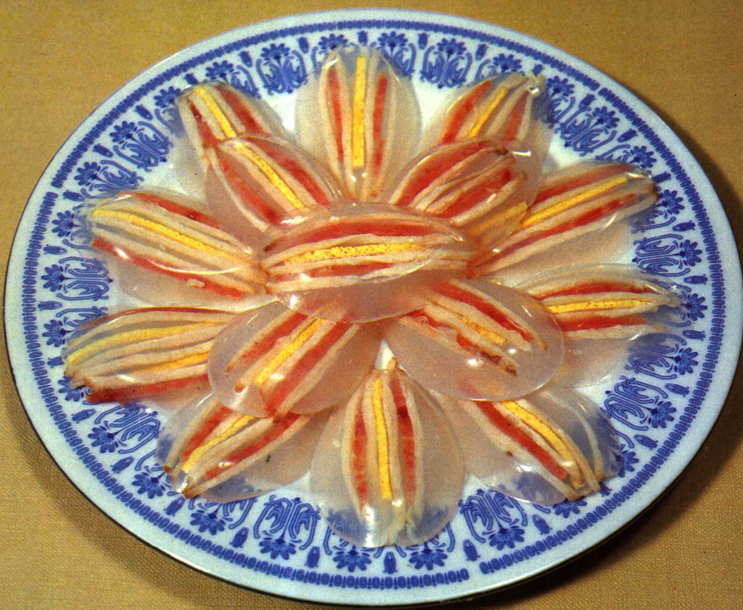
丁香鱼翅 见珍品类 5