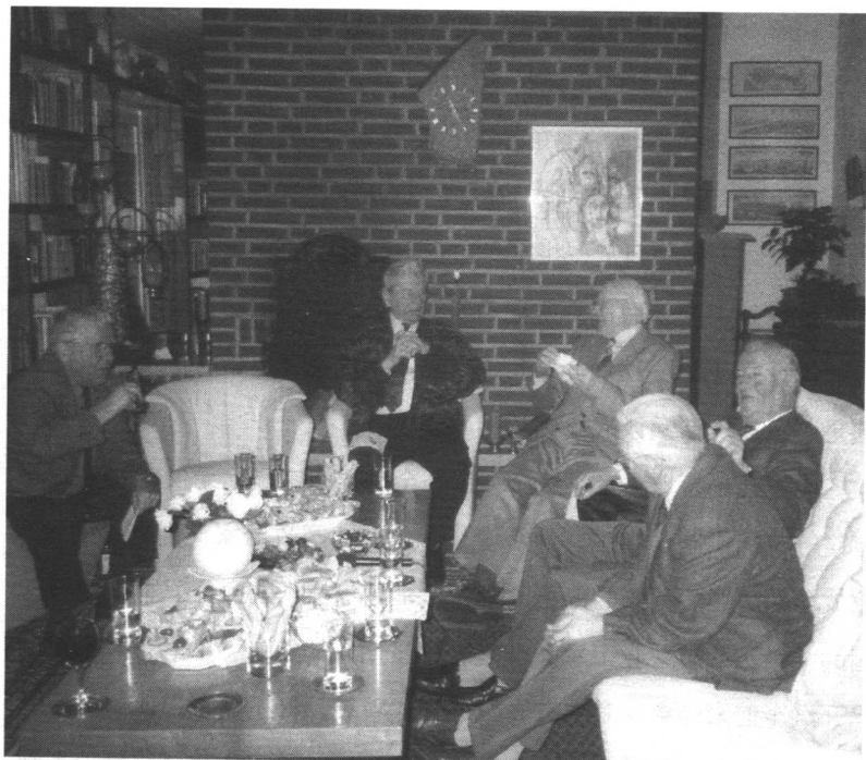
当年的海陆空三军种都到齐了。

德国老兵的世界神秘而遥远，而对这些战争亲历者本身来说，他们所属的这个社会群体曾经是整整一代人，是一起参军、一起打仗、一起被俘、一起重建家园的一代德国人，他们之间的相知与相处已经成为他们几十年来日常生活的一部分了。这次座谈会带给了我老兵群体的一个基本判断：作为德意志民族延续过程中特殊的一代人，这些老兵们在民族秉性上和他们的前人和后代并无本质上的差异。他们的独特之处只在于，特殊的历史境遇造就了他们特殊的命运。