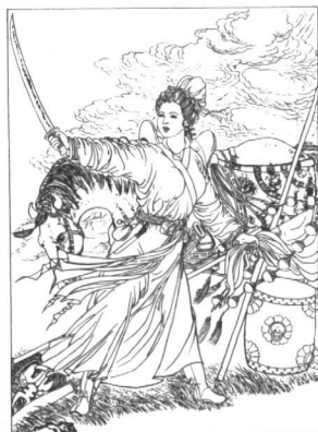
图4 辽太祖皇后述律平画像

律阿保机通过对外扩张、对内平叛等一系列艰苦卓绝的斗争，终于巩固了契丹王朝的根基。