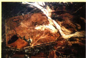
图2 辽上京遗址航拍图