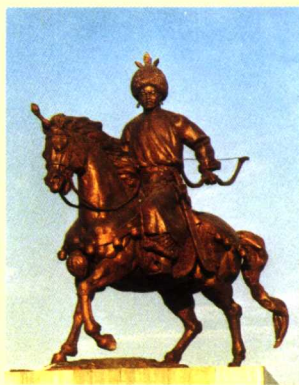
图1 辽太祖耶律阿保机塑像

耶律阿保机效仿中原，改用汉制，废除“可汗”称号，立国号为“契丹”，建元“神册”，自封“天皇帝”。神册三年二月，在契丹故地西楼（内蒙古巴林左旗林东镇南）建皇都，号上京。（图2）神册五年（920年）正月，利用汉文隶书之半增损之，制契丹大字代以往刻木之约。（图3）之后，又创制了契丹小字。于此同时，耶律阿保机又吞并了渤海国，建立了东丹国，以其长子耶律倍为东丹国人皇王。耶