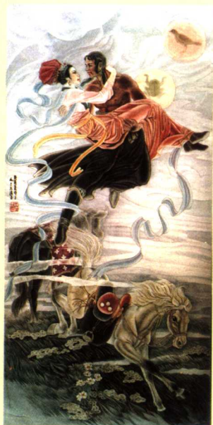
图1 契丹始祖起源的神话传说

《辽史》卷三十二《营卫志二》中也有相同的记载，这里不再摘录。通过以上二史籍的记载可以看出，契丹人种族起源的传说实际上是契丹人所信仰的原始宗教——萨满教的天神、灵魂、祖宗崇拜的具体体现。他们的祖宗是天神，他们是天神的后裔。契丹人的这种信仰习俗一直影响着在其统辖下的各少数民族，他们都把对本族或本地区有贡献的逝世先人制成偶像加以供奉。尤其是蒙古族，直到近代他们还把“死者也算作一种新的神，叫翁衮……能够决定什么人的灵魂才能当翁衮只有萨满。” ① 萨满教是一个多神教，有学者言其是“热闹非凡的万神殿”，这一评价并不过头。萨满教虽没有系统的教义，但其敬事范围之广，是任何宗教都无法