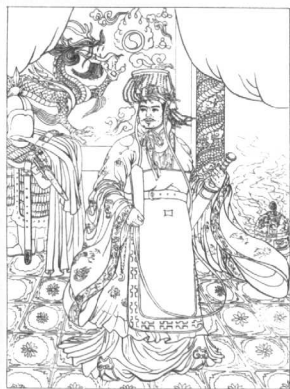
图5 辽太宗耶律德光画像

太祖天显元年（926年）七月，耶律阿保机于平渤海的归途中染病驾崩。皇后述律平总摄军国事。（图4）927年11月，述律平支持其二子，契丹兵马大元帅耶律德光继皇帝位，太宗大同元年（947年）正月太宗灭晋，入汴京（今开封），改穿中原汉族皇帝服装，改国号“大辽”。（图5）三月，辽将晋诸司吏、嫔御、宦寺、方技百工、图籍历象、明堂刻漏、太常乐谱、诸宫悬、卤簿法物、铠杖等全部运往辽上京。四月，耶律德光自开封返辽上京途中，病死滦城。永康王耶律兀欲（耶律倍子，汉名阮）被随军出征的南北两院大王拥立继皇帝位，是为辽世宗。世宗之后，辽又经六帝，即穆宗耶律璟、景宗耶律贤、圣宗耶律隆绪、兴宗耶律宗真、道宗耶律洪基、天祚帝耶律延禧。历时219年，于1125年被女真人所灭。