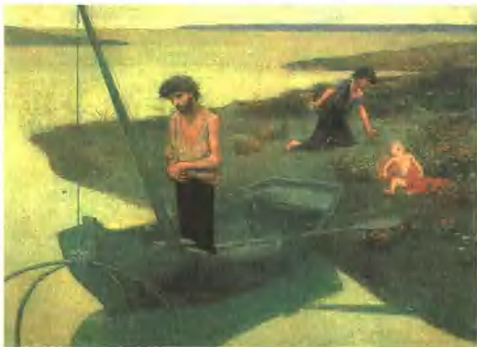
穷困的渔夫 皮埃尔·皮维·德·夏凡纳 油画 19世纪末

从夏凡纳的这幅画中，看不出有什么与那个时代写实画家相同的对社会贫富差距不满的意图，它充斥着一种散漫简单的情调，就像是芬格拉底在进行着对苦难的享受一般。心灵的富裕与物质的富裕并无逻辑关系。