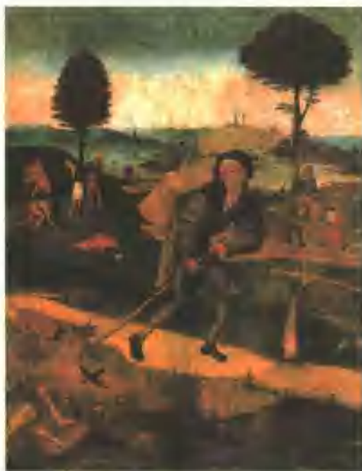
流浪的艺人 博斯 油画 17世纪

人们常说，人到老年，体力下降，痛苦将至，生命的幸福就开始走下坡路。但苏格拉底却有不同的看法。他怎么认为呢？他认为人痛苦的根源于性格。