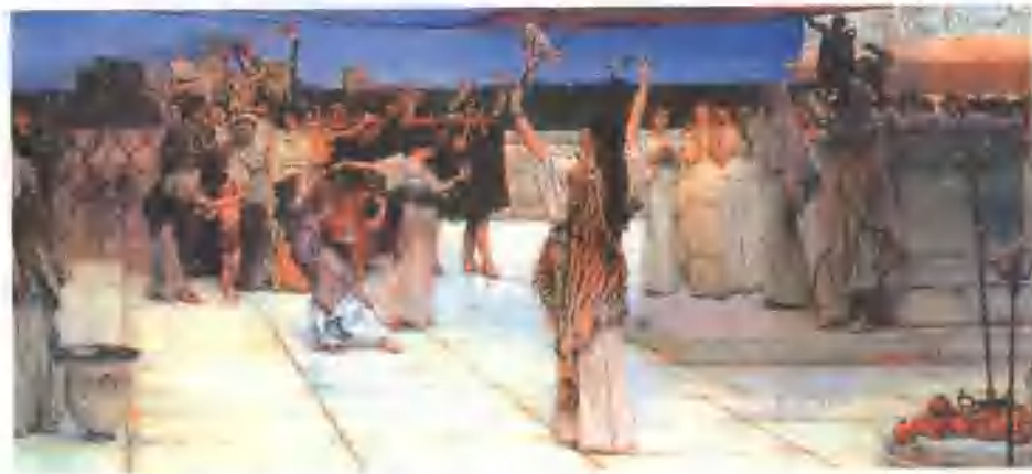
巴库斯的祭礼 阿尔马·泰德玛 油画 19世纪

我正准备回城的时候，被勒马霍斯远远地看见我，就打发他的家奴来留我在他家住。他父亲是我的至交，名叫克法洛斯。那家奴赶上来，在后面拉住我的披风说：“苏格拉底先生，请您稍等一下。”