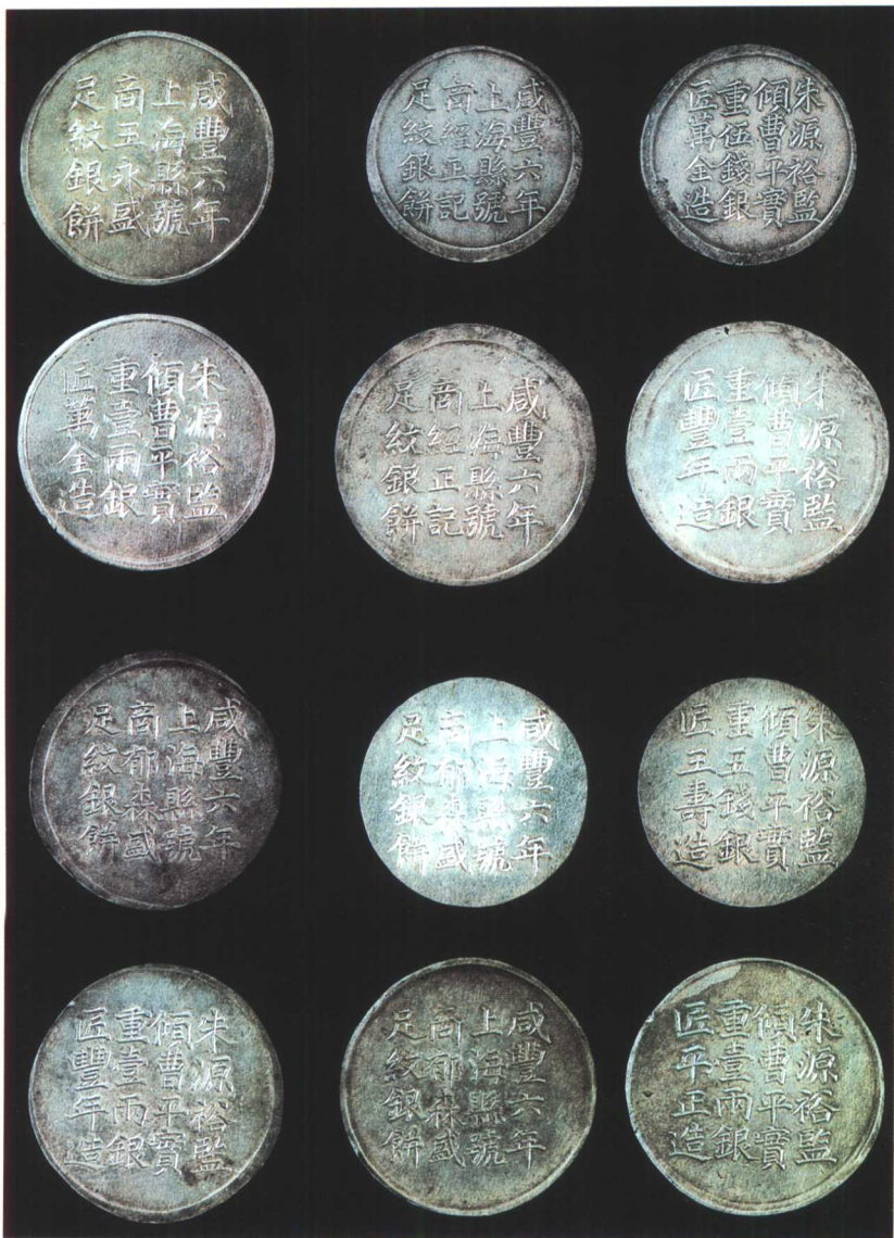
图版二 咸丰六年上海县号商银饼