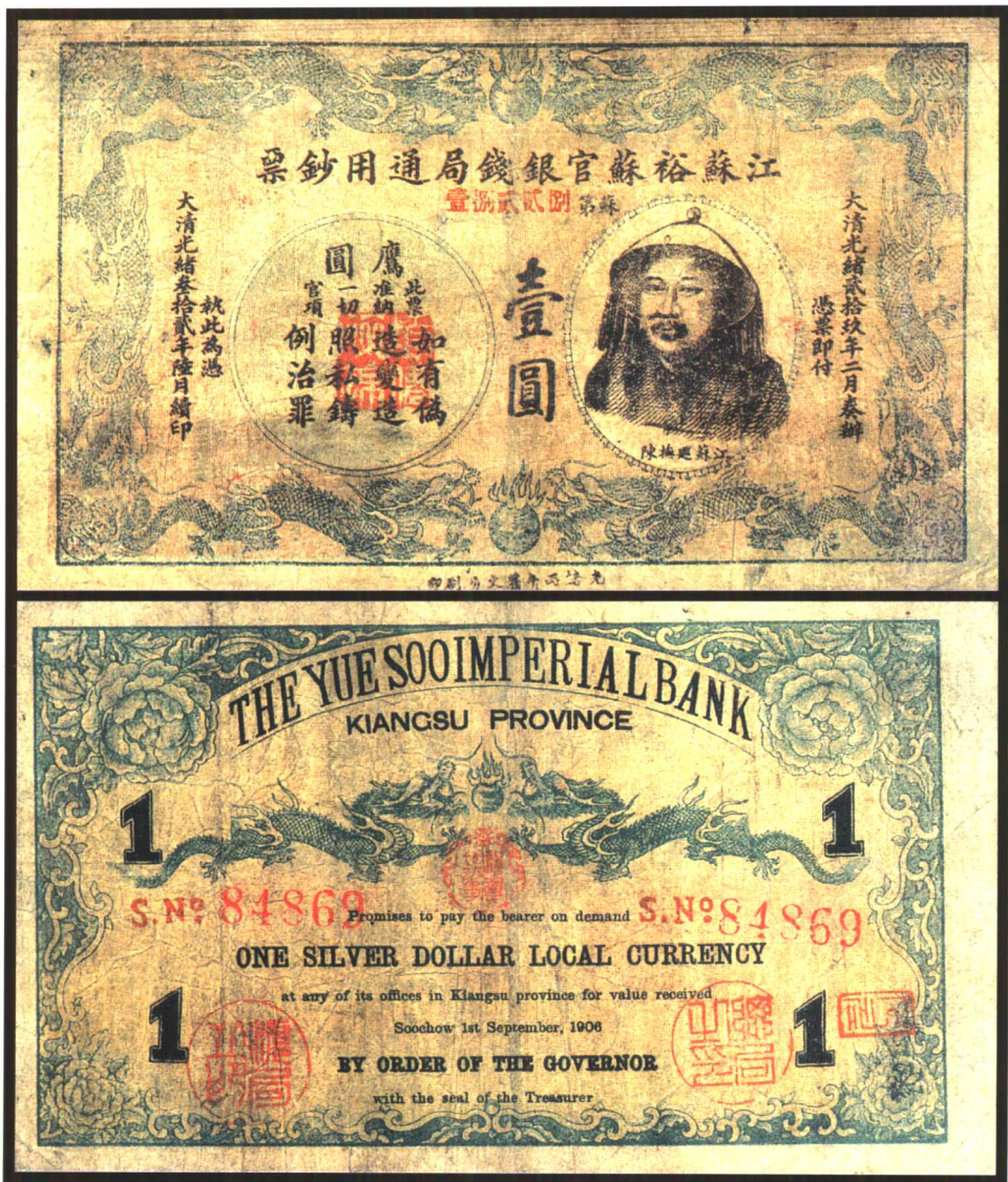
图版八 光緒三十二年江蘇裕蘇官銀錢局鈔票（一元） （原图14.2×8.4厘米）