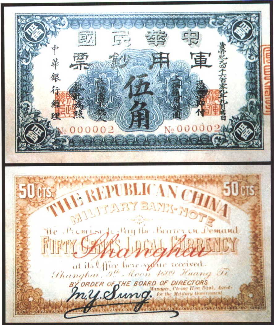
图版十三 黄帝纪元中华民国军用钞票（五角） （原图 12 × 7.5 厘米）