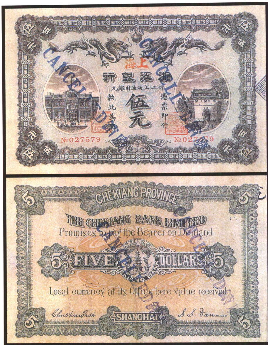
图版十二 清末浙江银行银元券（五元） (原图16.4 × 10.5厘米)