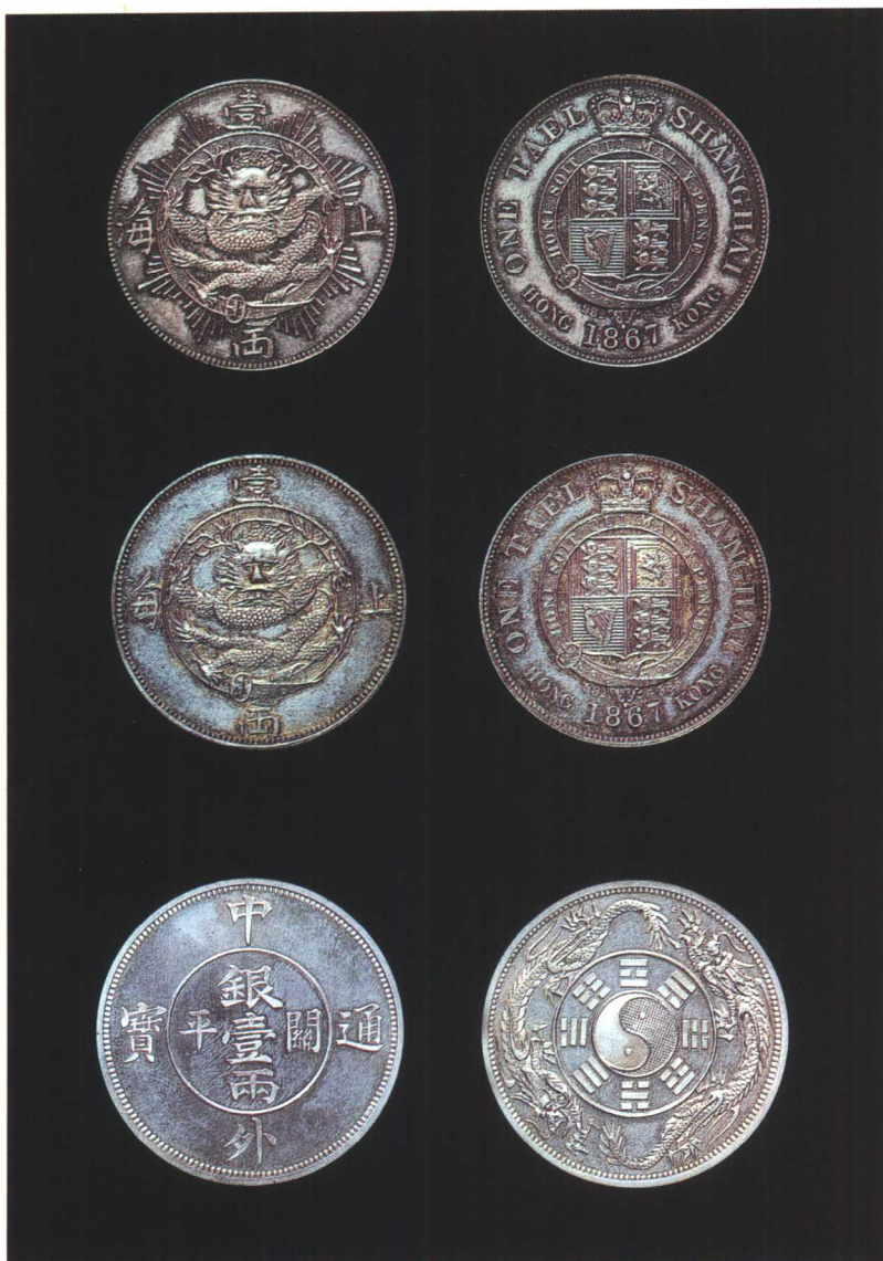
图版三 上海一两和中外通宝银币