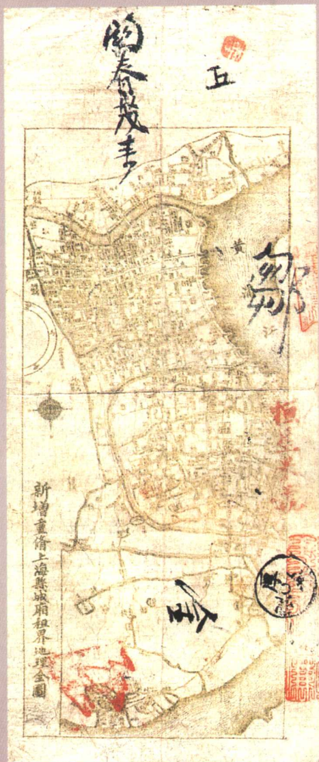
图版五 光緒二十五年春恒茂典钱票 (原图 10 × 24.8 厘米)