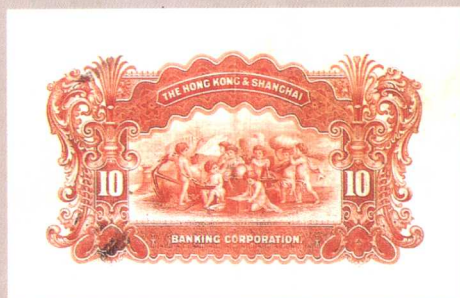
图版六 1900年英商香港上海汇丰银行银元券