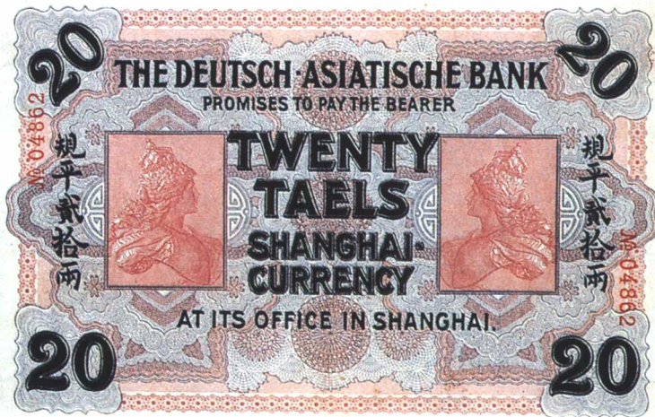
图版九 1907年德华银行银票（二十两）