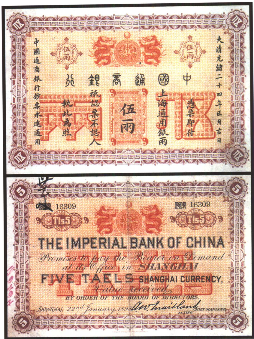
图版四 光绪二十四年中国通商银行钞票（五两） （原图16.5 × 11厘米）