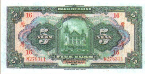
图版十四 中国银行兑换券