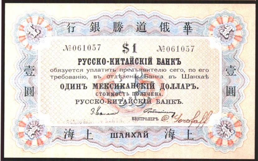
图版七 1901 年华俄道胜银行银元券（一元） （原图 16 × 10 厘米）