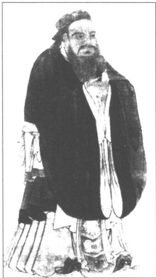
孔子说人分五个层次