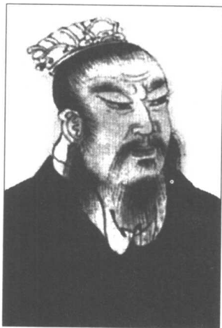
汉高祖刘邦善用人才