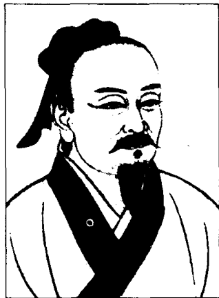
范蠡的计策谋略出神入化

品行高尚，容貌举止可为人楷模，这种人叫做“清节”之士，延陵、晏婴就是这样的人。能创建法规、制度，使国家强盛，使人民富足，这样的人叫做“法家”，管仲、商鞅就是这样的人。思想与天道相通，计策谋略出神入化，变化无穷，叫做“术家”，范蠡、张良就是这样的人。其德行足以移风易俗，其方法足以匡正邪恶，其权术足以安定天下，改朝换代，这样的人叫做“国体”，伊尹、吕望就是这样的人。其品德可为一国之表帅，其方法能够改变穷乡僻壤，其谋略能够权衡政事，这样的人叫做“器能”，子产、西门豹就