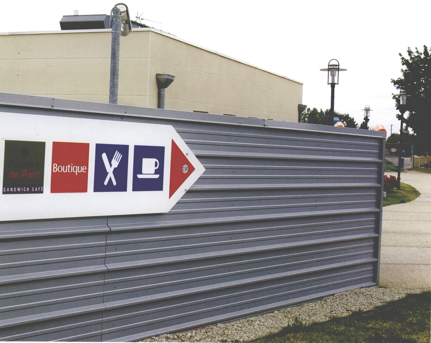
高速公路休息站系列指示（法国）

公共环境标识系统设计首先必须满足环境空间的实用性需求。环境的因素十分复杂，如环境的用途、建筑的性质、空间的性格与表情等；不同的环境特征、功能和性质都会制约和影响公共环境标识系统的设计和定位。像法国高速公路休息站的标识系统，就对受众的各种需求定位及环境因素作了较为完善的处理。因为对