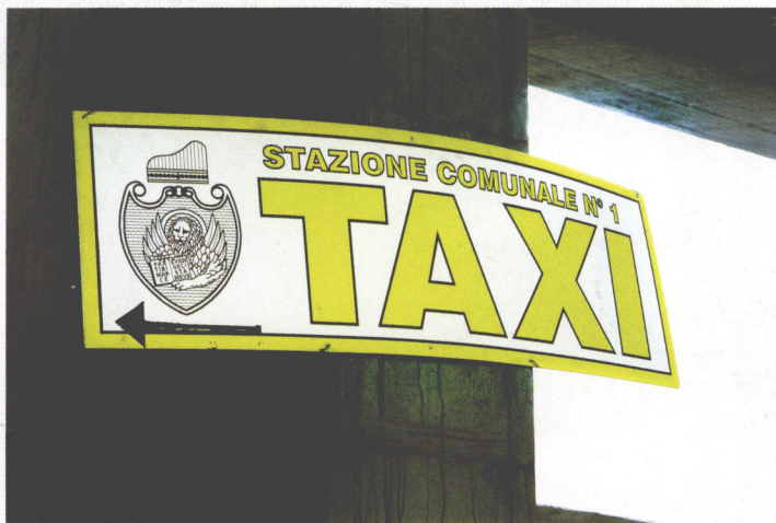
城市指示系统（意大利）

作为中世纪商业最繁荣的城市，威尼斯记载着意大利的光荣与历史。而这个号称世界第一的水上城市，其四面环海的优越地理位置注定了在那段以海为主要交通的大航海历史中的重要地位，而中国人熟知的马可·波罗就是从威尼斯到遥远的东方寻找梦想的英雄般人物。