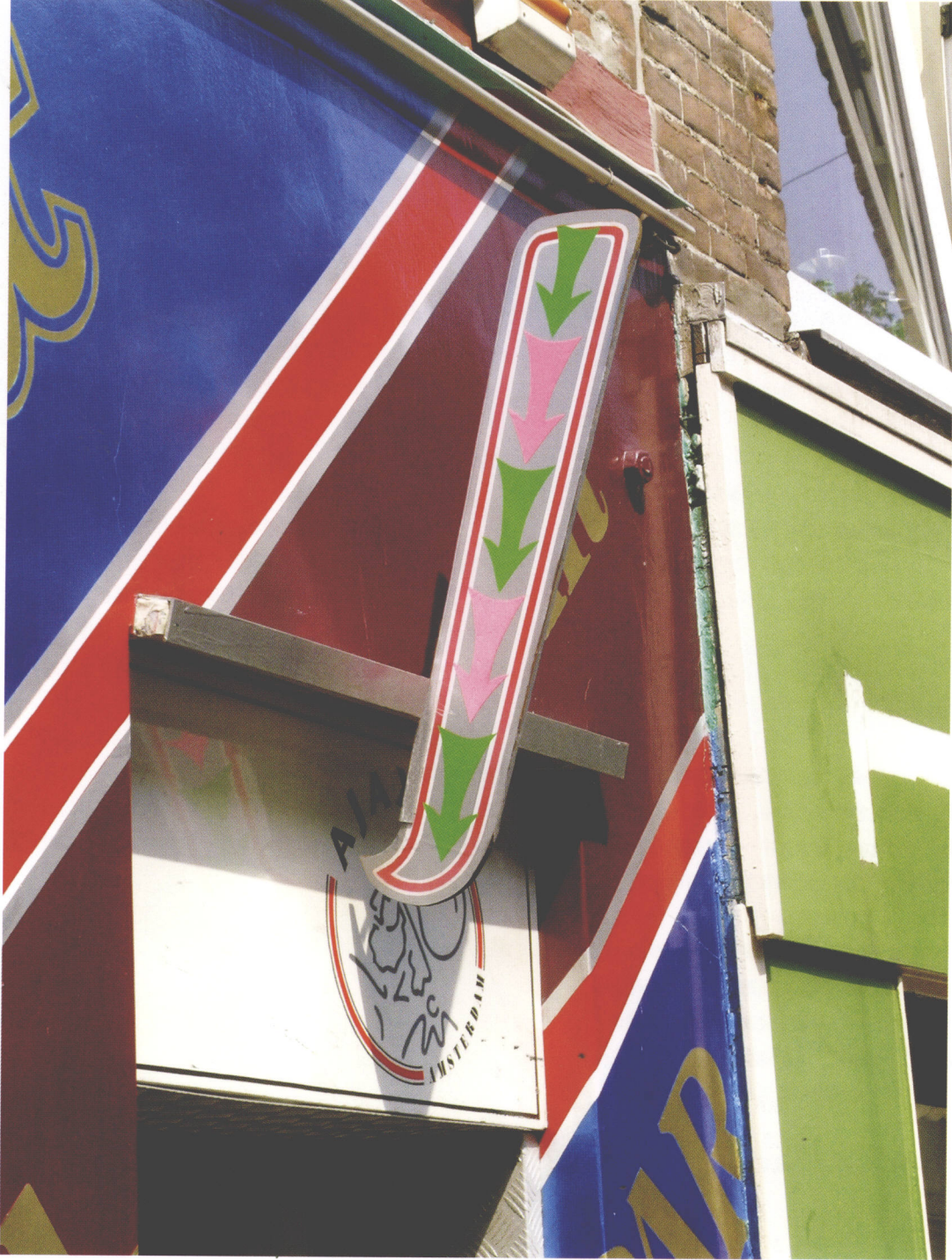
商业店面指示 (荷兰)