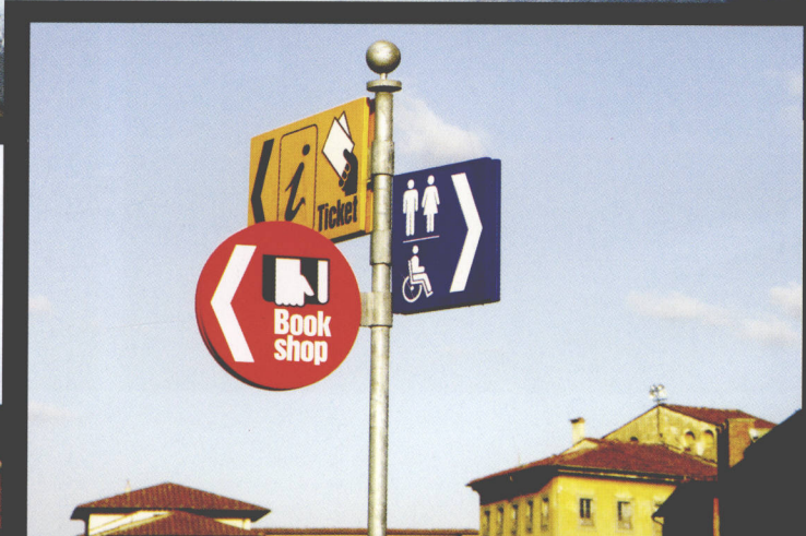
城市指示设计 (意大利)