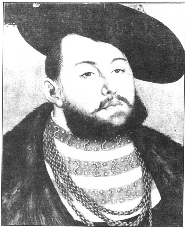
造教皇反的人：马丁·路德