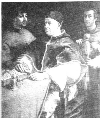
文艺复兴时期的人文主义教皇——利奥十世(居中者)