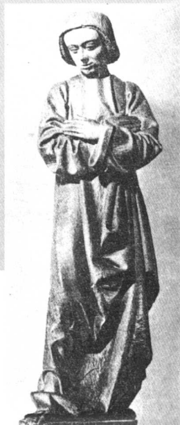
圣约翰:第一任教皇