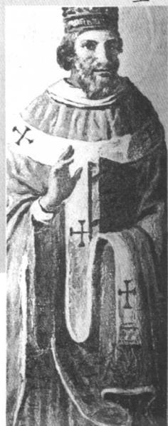
教皇格雷戈里七世