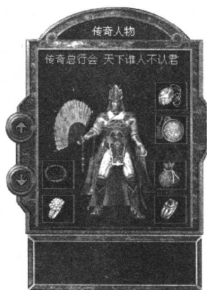
二区网通·传奇人物