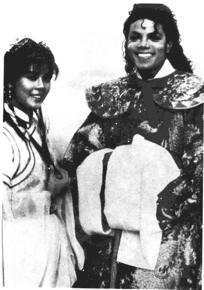
迈克尔·杰克逊访问香港留影（1988.3.）