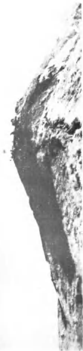
红旗插上一江山岛二〇三高地主峰