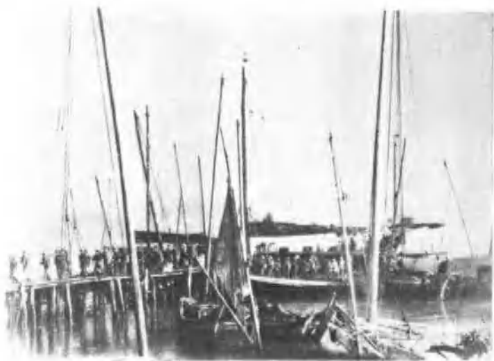
解放军渡椒江进入海口