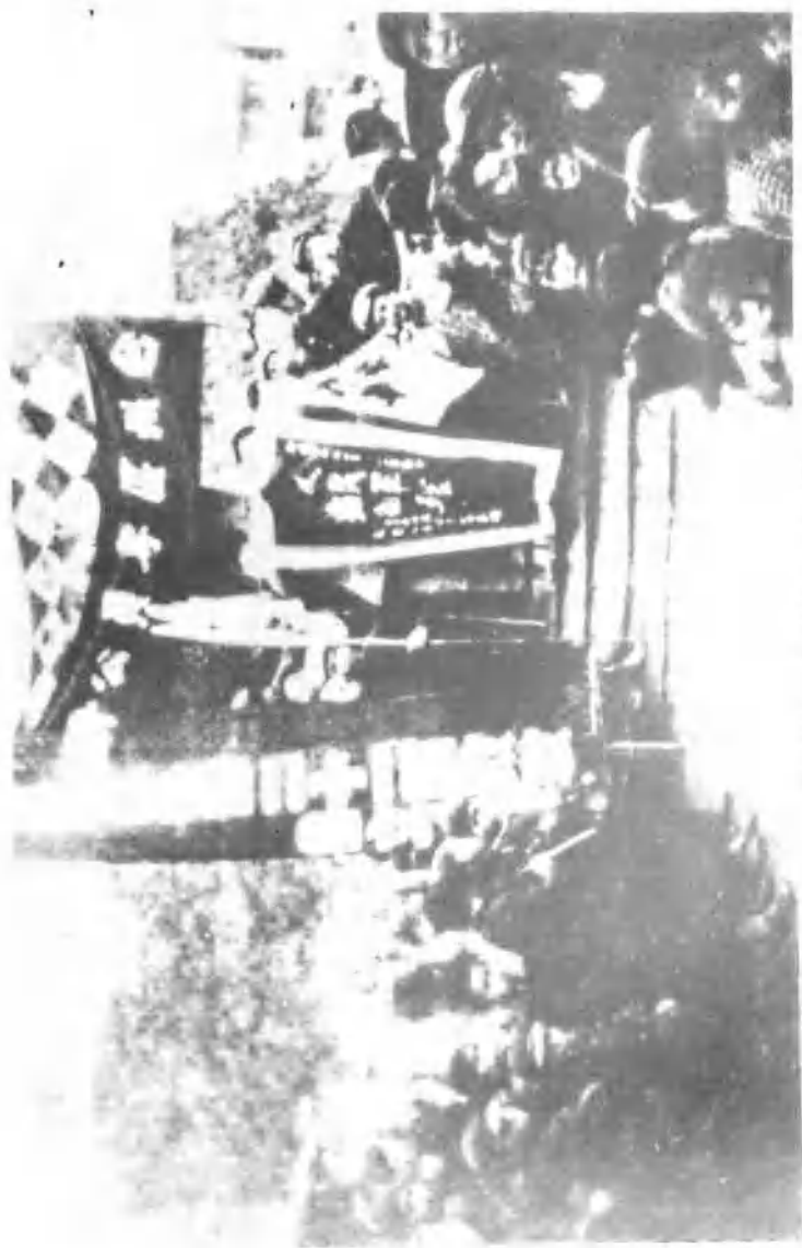
臨海城區人民迎接解放大軍進城