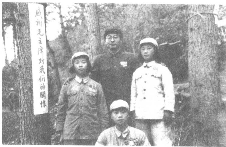
1952年10月，两位女兵与祖国人民慰问团西南慰问团副团长合影。