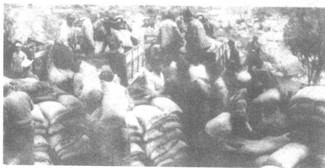
1952年秋，祖国运来了大米，女兵们也去搬运。