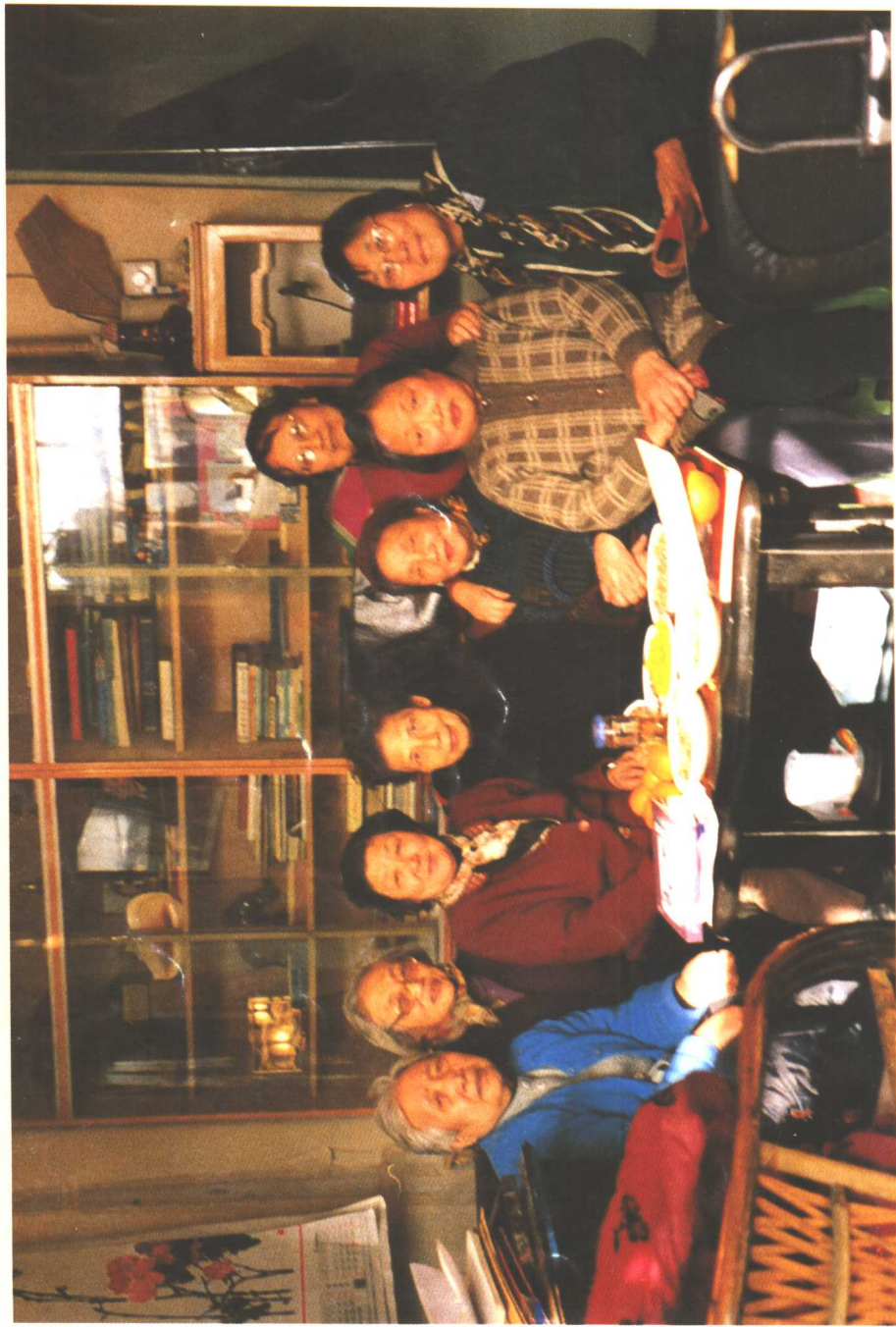
2000年12月，在京部分女兵讨论集出版此书后合影。