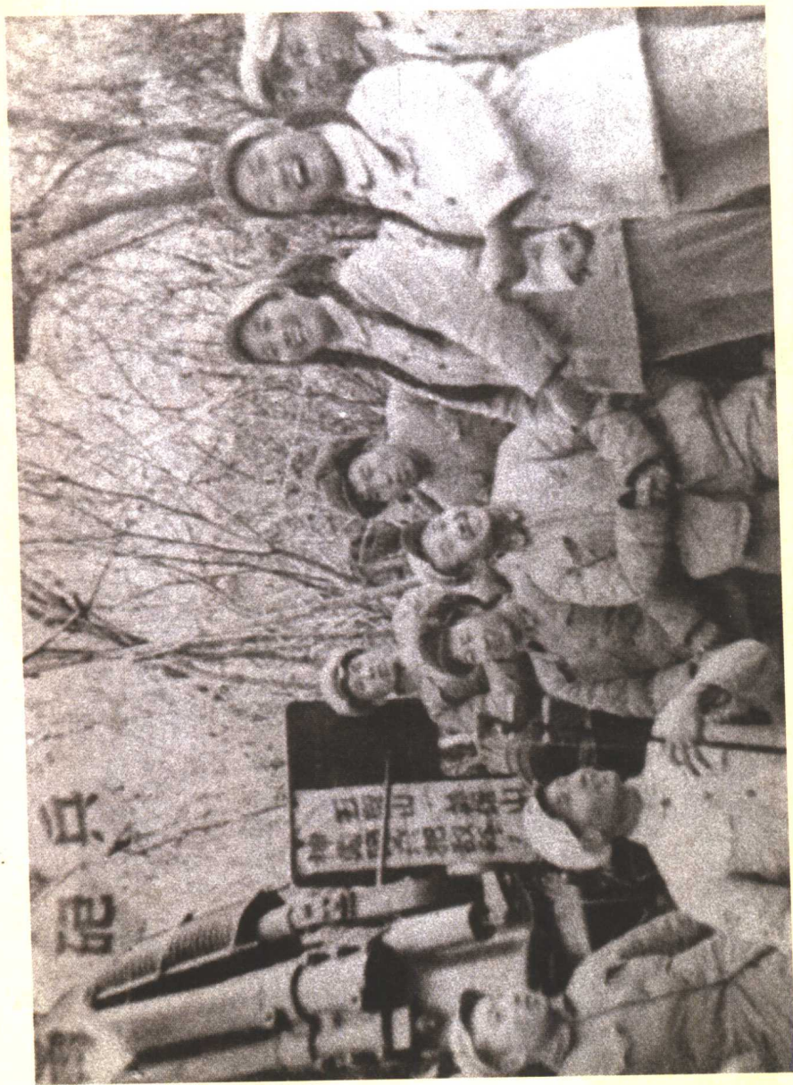
在炮兵阵地慰问演出。