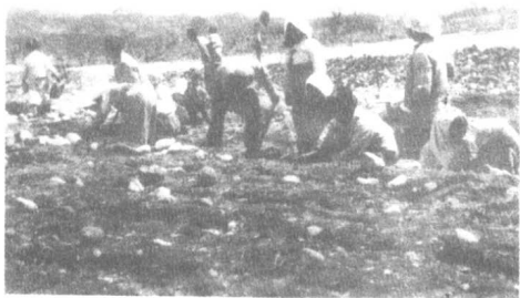
志愿军女兵帮助朝鲜老乡平整田地。