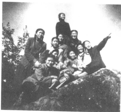
与平壤艺术团团员合影。