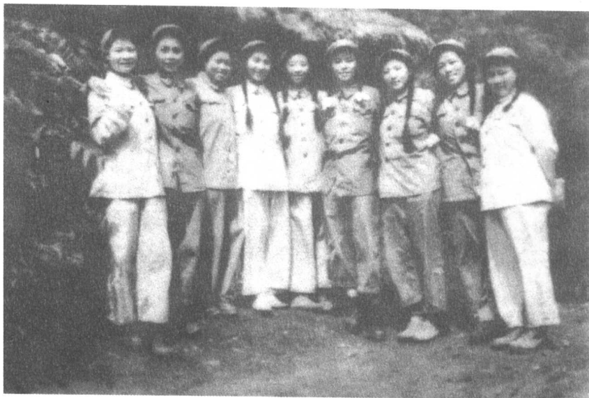
在自己修的掩蔽部前合影。