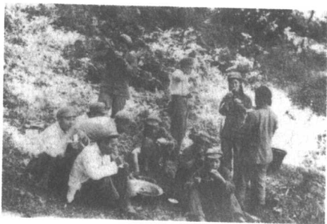
第五次战役后，部队休整时文工团员的第一次会餐。