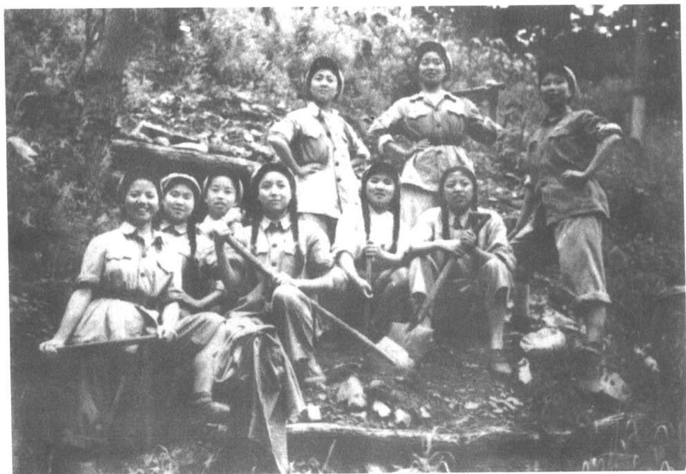
整修防空洞休息时。