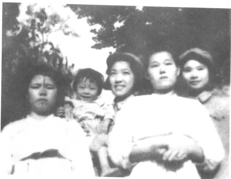
在朝鲜黄海道谷山郡岭底洞和朝鲜大嫂合影（1951年）。