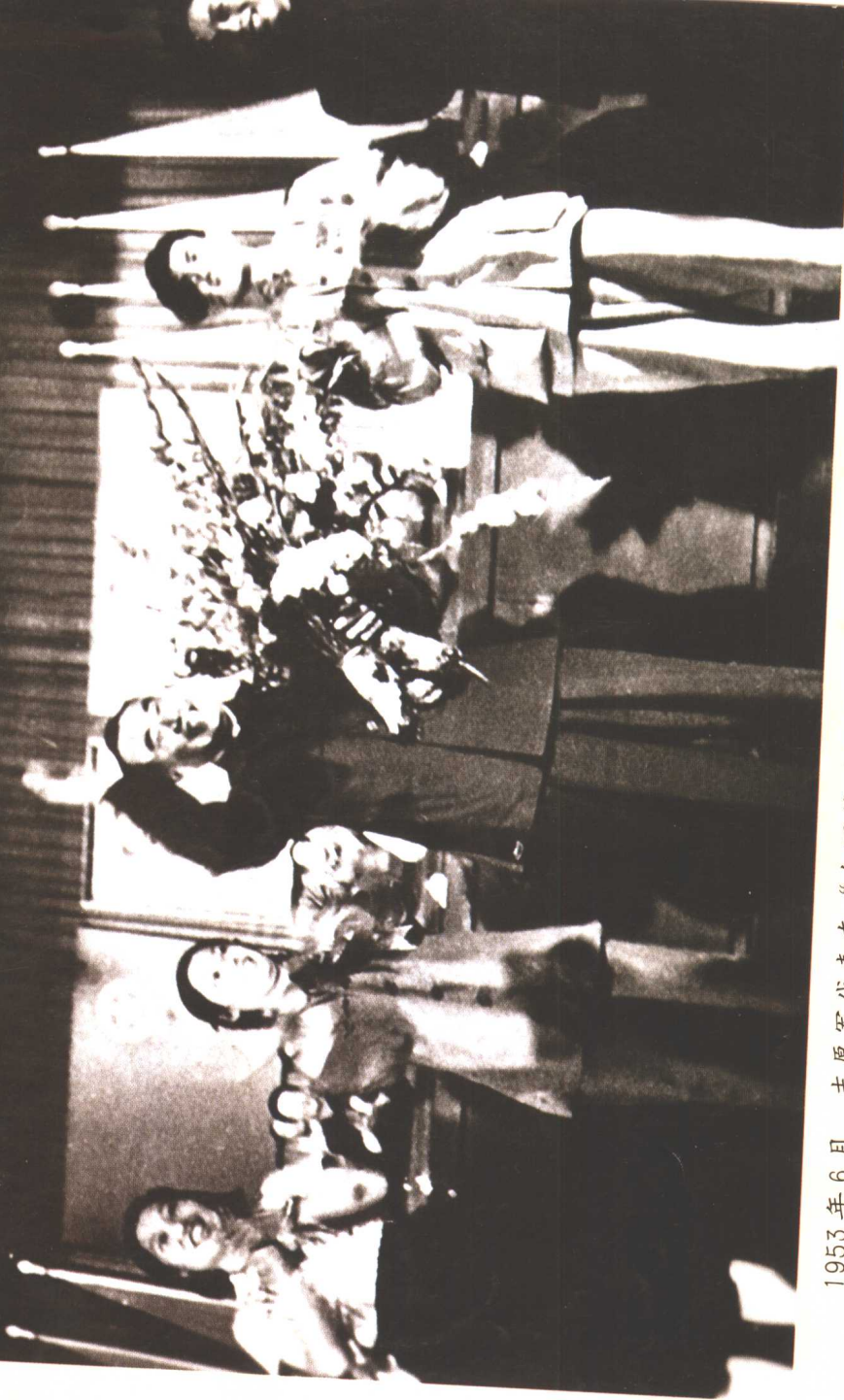
1953年6月，志愿军代表在“全国第二届青年团代表大会”闭幕式上向朱总司令献花。