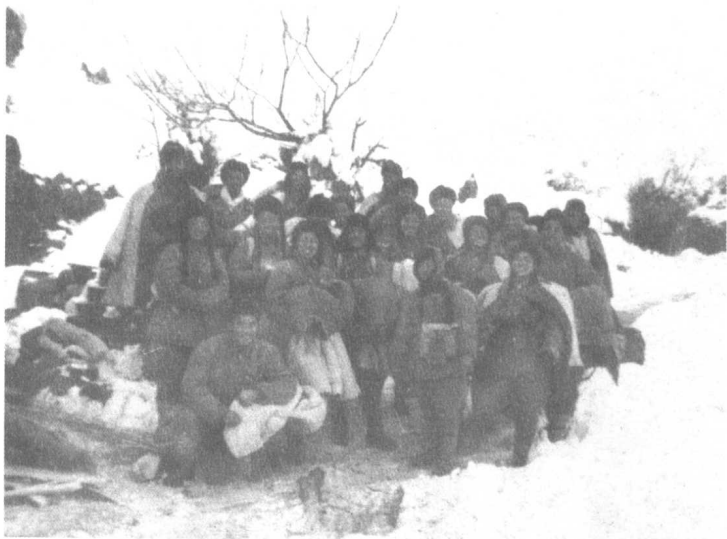
1951年冬，文工团员们在前线指挥部演出返回前合影。