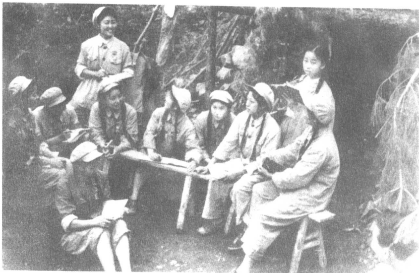
在自建的防空洞口学习、讨论。