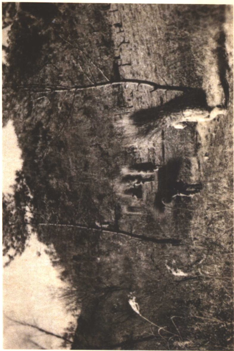
1952年秋，女兵们翻山越岭到月来洞背草，准备过冬。