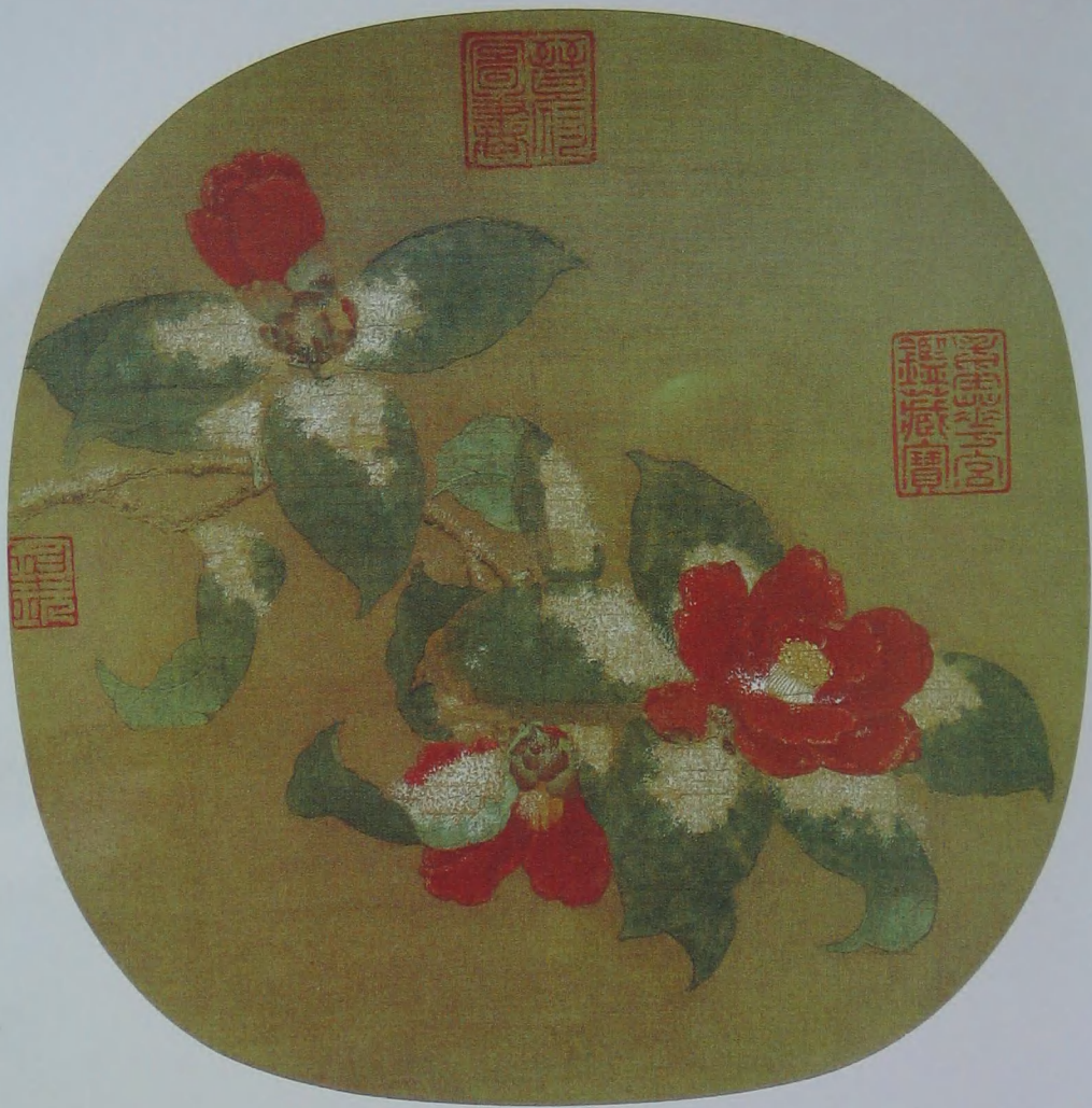
山茶霁雪图 宋 无款 绢本 设色 纵二四·八厘米 横二七·二厘米

宋人在写生作品中，即使是一花、一叶，都能匠心独运，夺造化之妙。这幅册页小品，一枝山茶横斜而下，其间朱红色花与深绿叶交相辉映，并用白粉点雪，色彩艳丽，气息高古。此图虽无款识，但枝、叶、花的用笔老辣而具变化，尤其鲜红的茶花在雪中挺立，这种气质绝等闲之辈所能写出，定为宋人画院中高手所为。