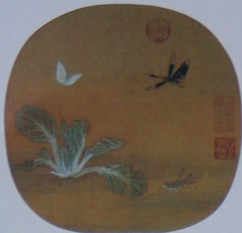
野蔬草虫图 宋 无款 绢本 设色 纵二五·八厘米 横二六·九厘米