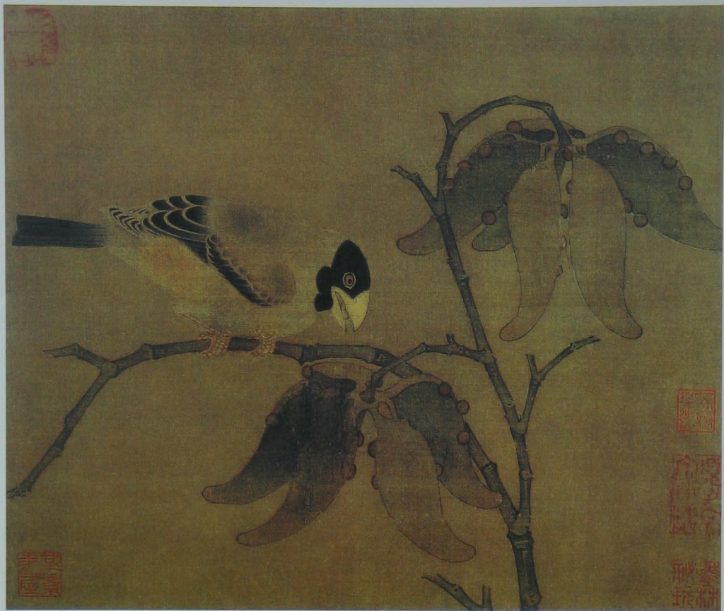
梧桐蜡嘴图 宋 无款 绢本 设色 纵二二·九厘米 横二七·二厘米

这幅宋人作品设色淡雅，描写工致，并略带装饰趣味。蜡嘴停于画面左部的枝干上，啄食桐籽，而略已枯黄的桐壳悬挂在刚硬而有装饰性的枝干上，呈现深秋的意味，此图是宋人小品中少见具有装饰性而不失真味的作品，是古人在艺术创造中源于自然、高于自然的表现。在设色淡雅的作品中，最能体现出线条的表现力，因而要临好这幅画，就必须对其细加分析。