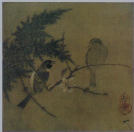
蜡梅双禽图 宋 赵佶 绢本 设色 纵二五·六厘米 横二五·八厘米