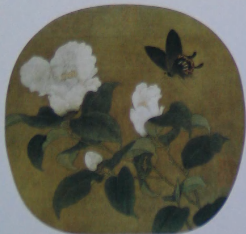
梨花蝴蝶图 宋 无款 绢本 设色 纵二二·一厘米 横二三厘米