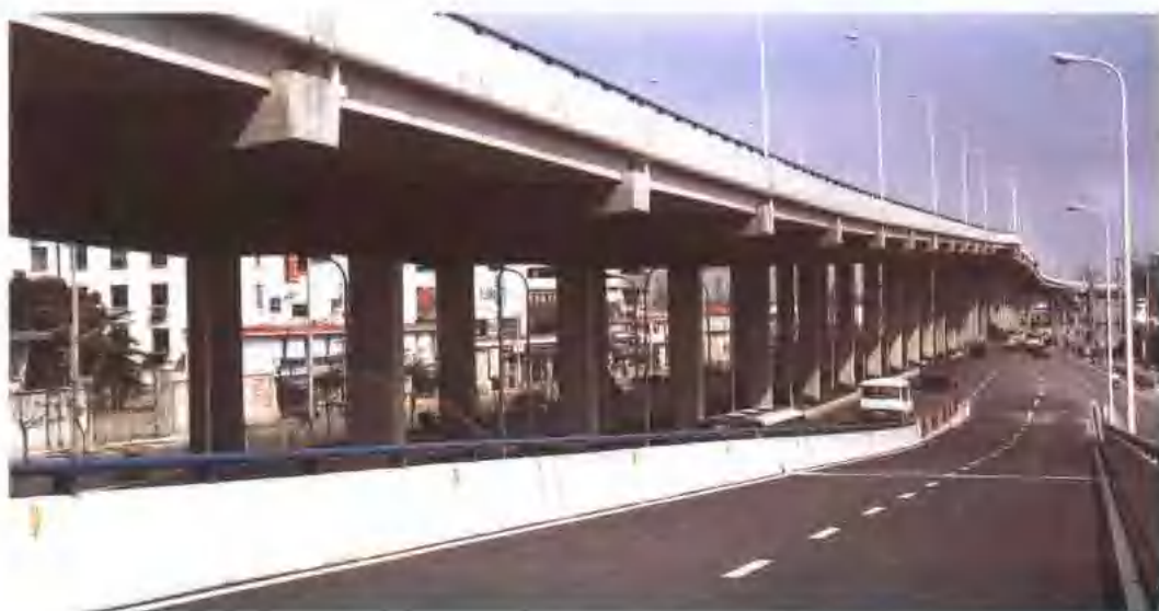
上海逸仙 路 2.5 标高架 桥。