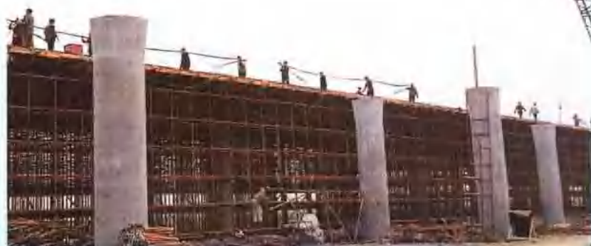
潘塘立交桥施工 现场。