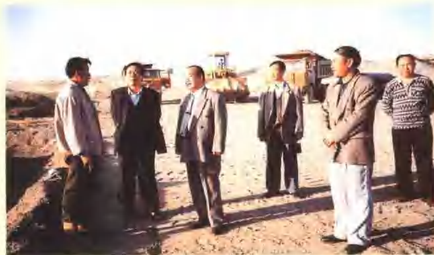
局党委书记王德臣（左三）在新疆克拉玛依水库大坝工地考察工作。