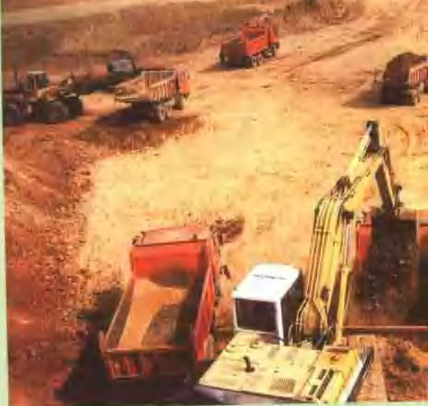
潍莱公路土方施工。