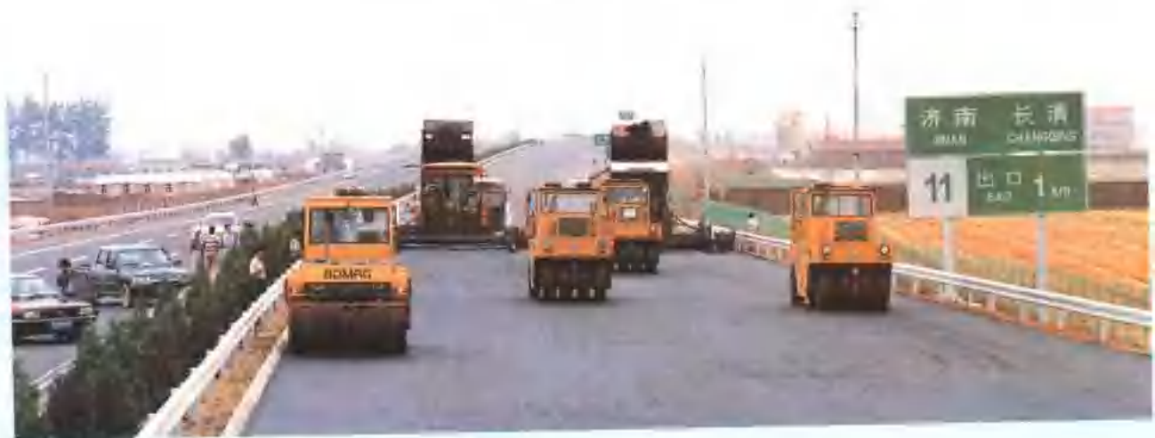
施工设备在济德高速公路第八合同段路面摊铺作业。