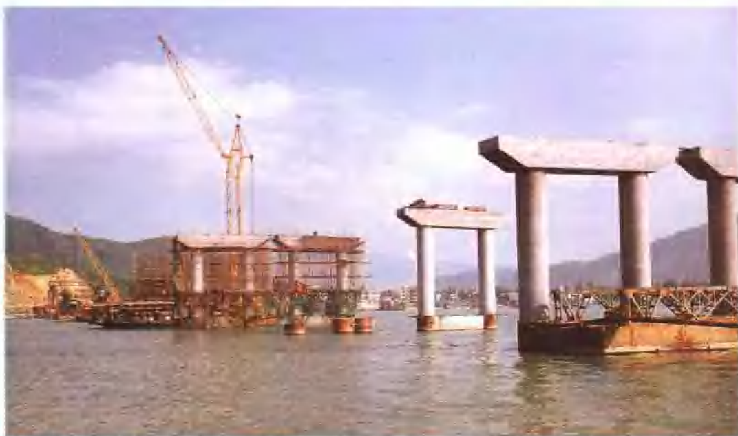
三处在富春江 中埠大桥施工中， 攻克深水墩裸岩桩 施工技术。