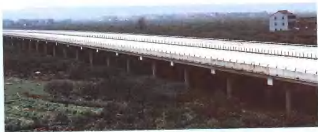
甬台温高速公路 永宁江特大桥。