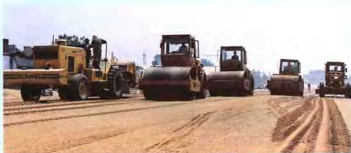
泰山大街 宽工程机械化 业。