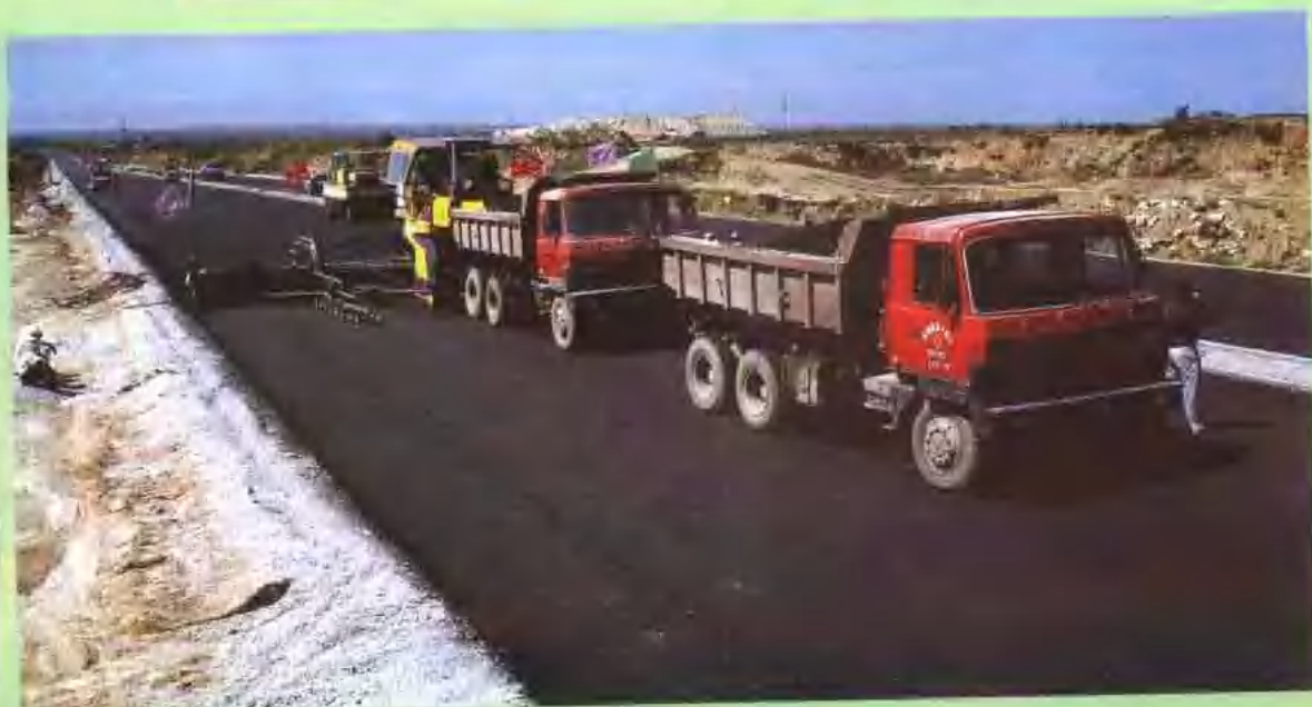
潍莱高速公路路面摊铺作业。