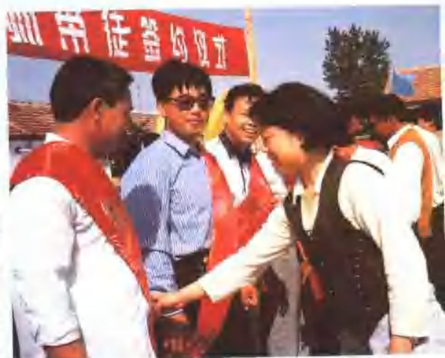
“导师带徒”活动签约仪式。