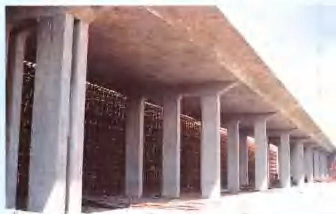
济泰公路天平互通立交桥。