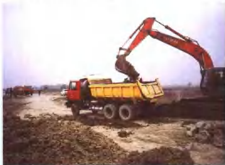
界阜蚌公路路基施工。