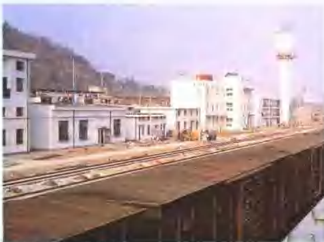
南星桥客车整备所房建工程。