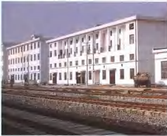
三处承担施工的杭州南星桥客车整备所房建工程竣工。