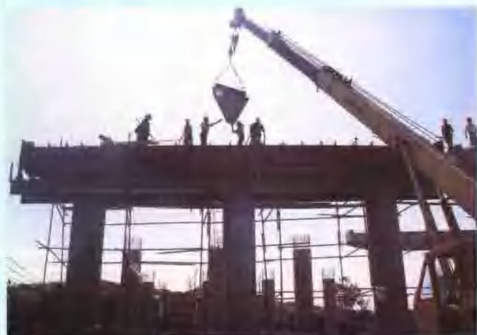
施工中的陡山大桥。