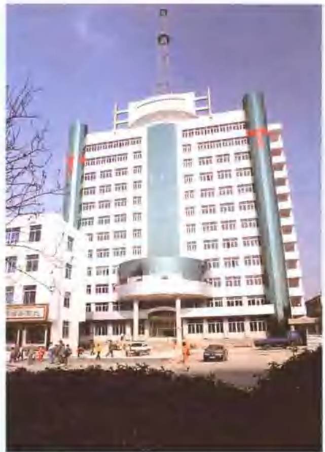
三处施工的淮南金海大厦工程竣工。