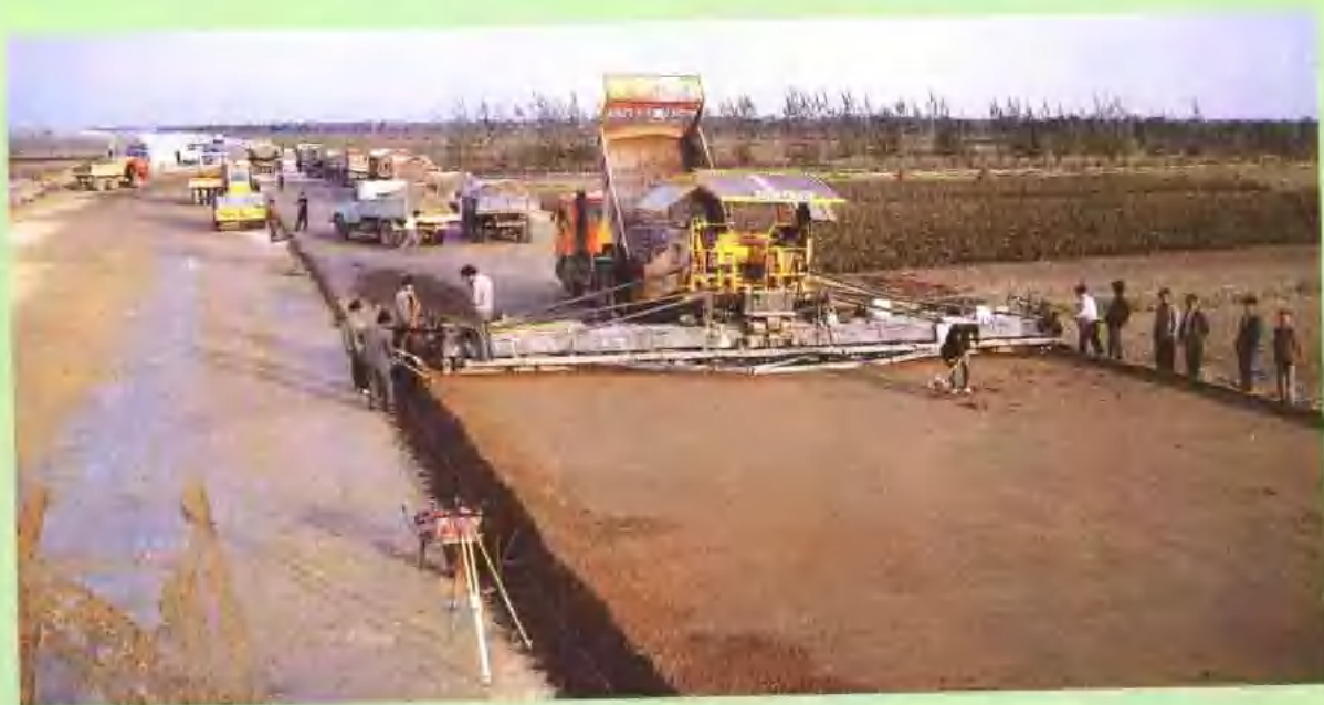
潍莱公路稳定土摊铺作业。