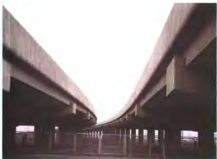
上海外环线 1.5 标高架桥。