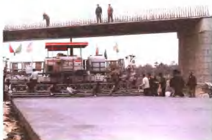
沪蓉高速公路混凝土路面摊铺机作业。