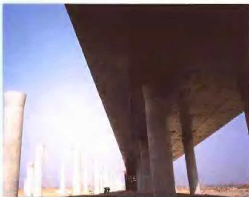
徐连高速公路潘塘立交 交桥。