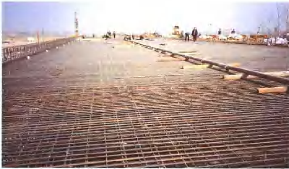
徐连高速公路潘塘立交桥桥面布筋。