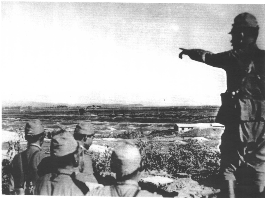
卢沟桥事变·包围宛平城的日军

1937年7月，包围宛平城的日军准备发动攻击。7月14日，新任日军华北驻屯军司令官香月清司向宋哲元提出七项要求，包括镇压爱国运动、中国军队撤出城外等。宋哲元最初不明日方的底细，不主张轻易开战，而倾向于和平谈判。20日，日军却以巨炮轰击长辛店及宛平城，造成中国军民严重的死伤。不过此时宋哲元仍迁就日方要求，下令撤除北平街头的沙袋、拒马等，并电请南京中央命令北上增援的孙连仲部停止前进。