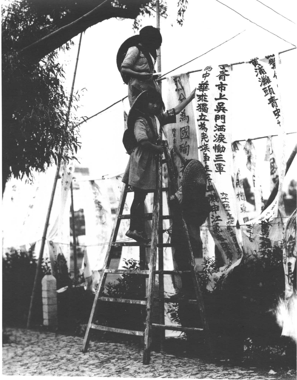
追悼“一·二八”阵亡将士（之二）

1932年5月，“一·二八”抗日阵亡将士追悼大会在苏州举行，图为女学生在竹竿上挂起各界人士送来的挽联。这场战役自1月28日进行到3月3日，中国第十九路军与第五军官兵牺牲四千余人，负伤近万人，由于战事在城市内进行，上海市民伤亡亦十分惨重，震撼国际社会。英勇作战的十九路军则成为中国人民抗战救亡的象征。