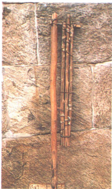
农业脱粒工具——连枷