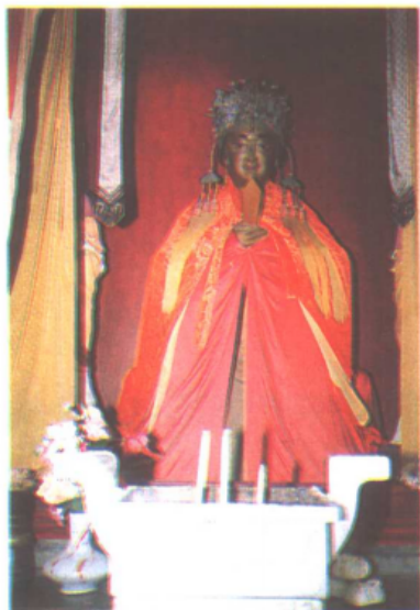
“海上保护神”海神娘娘塑像