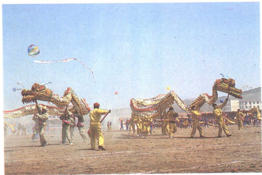
渔民节——'94荣成国际渔民节