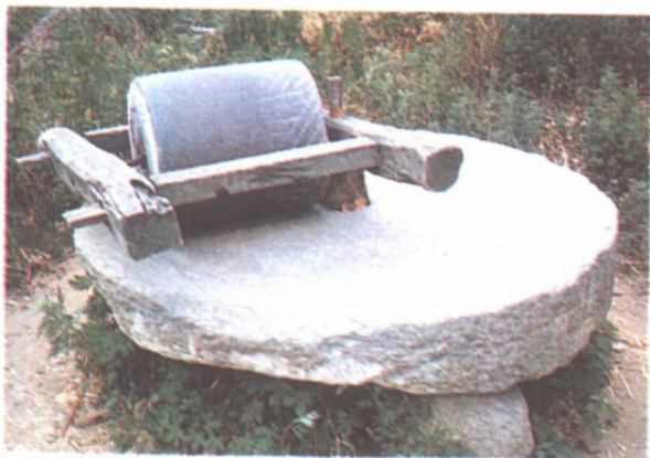
器用民俗之一——碾子