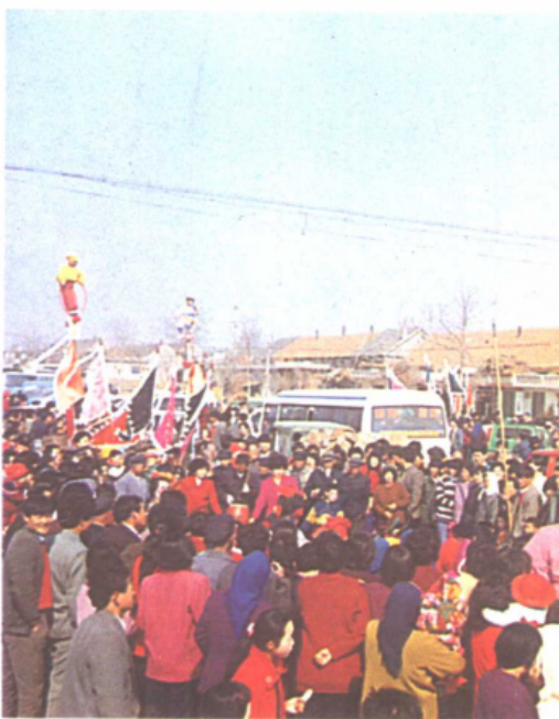
山会中的背阁与抬阁——现代的背阁与抬阁改人背人抬为车载