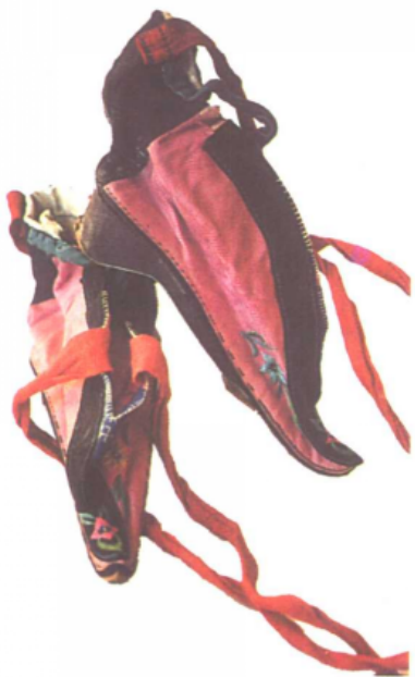
服饰民俗——古代的绣花鞋