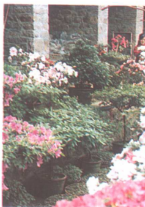
休闲民俗之一——庭院养花