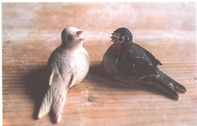
民间美术——面塑 燕子、动物等