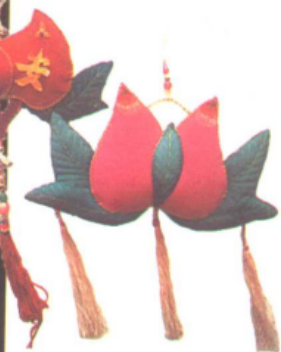
民间美术——布制玩具 作者 万桂凤