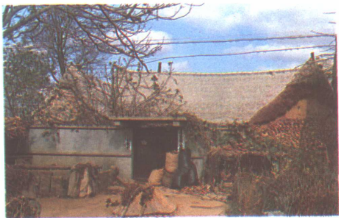
海草房的建筑布局——正房、对口厢