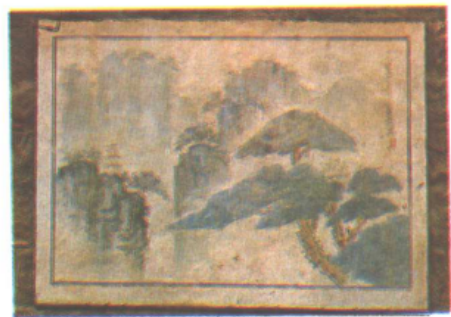
民居墙体装饰——灰盘彩绘