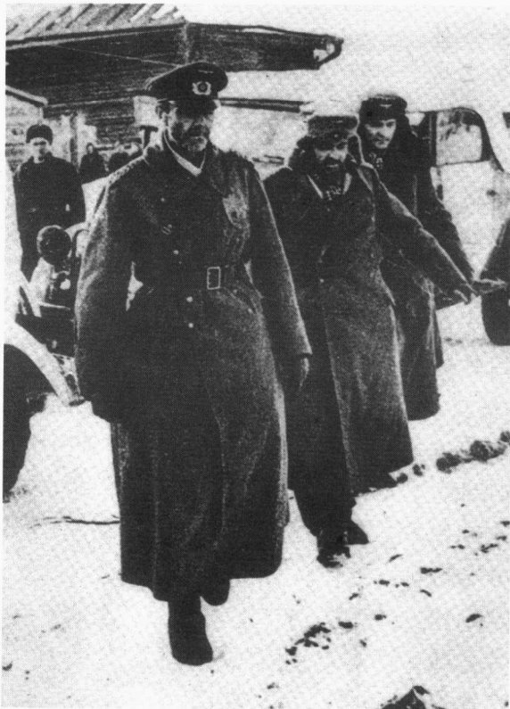
◀ 德军第6集团军司令保卢司率残部向苏军投降

基辅和克烈缅楚格方向，共长达1500公里的战线上向德国侵略军发动进攻，历时5个月，据苏军统计，共重创德军118个师团，相当于1943年夏初苏德战场德军兵力的