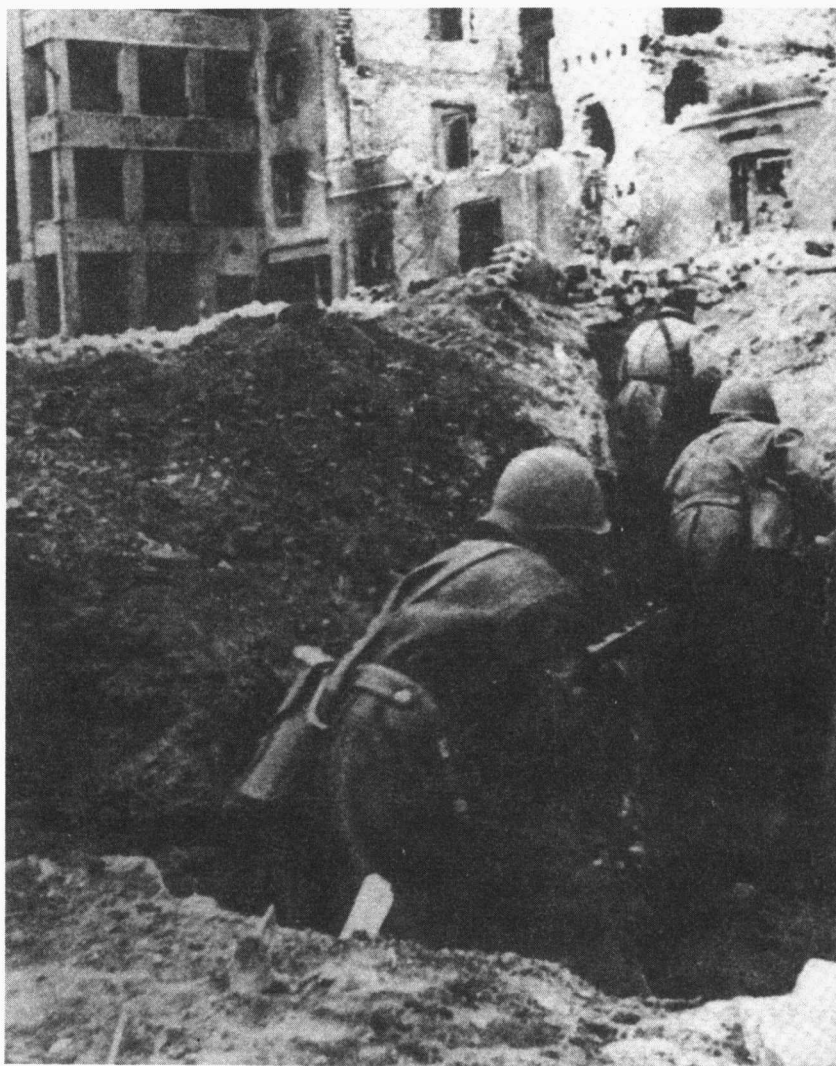
▲ 苏军士兵冒着炮火穿过战壕