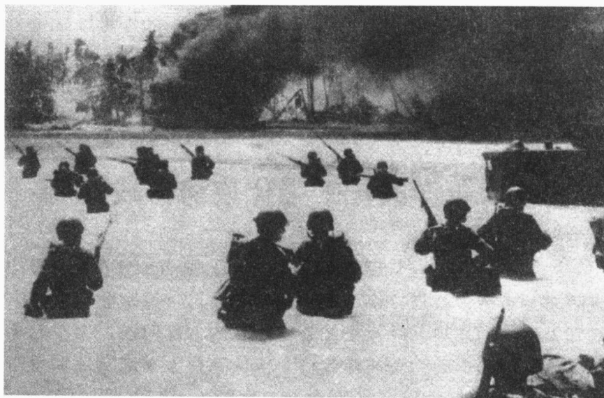
▲ 美国海军陆战队在瓜达尔卡纳尔岛登陆

场作战方案：“（1）由潜水艇封锁日本向东印度群岛输送石油的航线；（2）一旦得到在中国和太平洋的基地就立即实行对日本的持续轰炸；（3）进攻日本本土。”