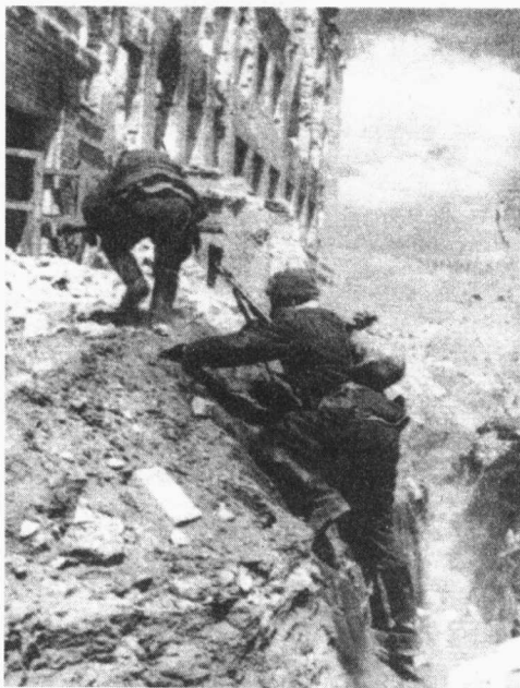
▲苏军战士转战在废墟中