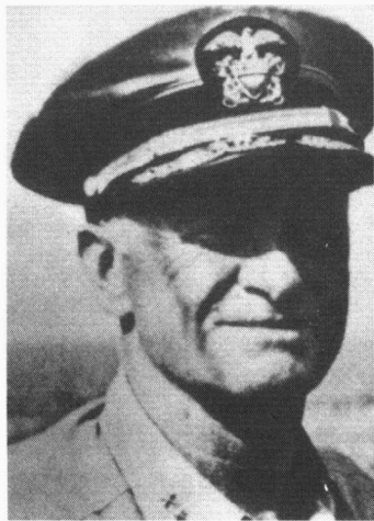
► 美太平洋舰队总司令切·尼米兹上将

1943年5月12日至25日，美、英两国首脑再度聚会华盛顿，协调反法西斯战争的军事战略，确定美、英新的战略和军事行动计划。首脑会议决定：1943年7月1日实施西西里岛登陆战役；1944年5月1日实行“霸王”计划，在欧洲开辟第二战场。华盛顿会议结束时，英国正式接受美国参谋长联席会议备忘录所阐述的太平洋战