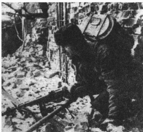
▲斯大林格勒保卫战中，一个战士背着食品爬过废墟