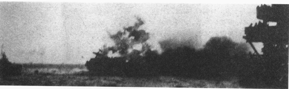
▲ 珊瑚海海战中美航空母舰“列克星敦”号遭日机的轰炸升起浓烟烈火

场作战方案：“（1）由潜水艇封锁日本向东印度群岛输送石油的航线；（2）一旦得到在中国和太平洋的基地就立即实行对日本的持续轰炸；（3）进攻日本本土。”