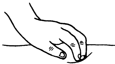
图 2 其他手指法