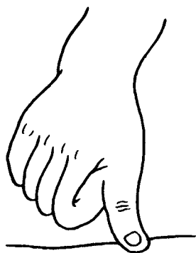
图 1 拇指法

(5) 代指法: 有时用手指或手掌按压效果不好或力度不够, 抑或按压面积太小, 而需用其他物品来代替手指或手掌治疗, 这种方法即代指法。