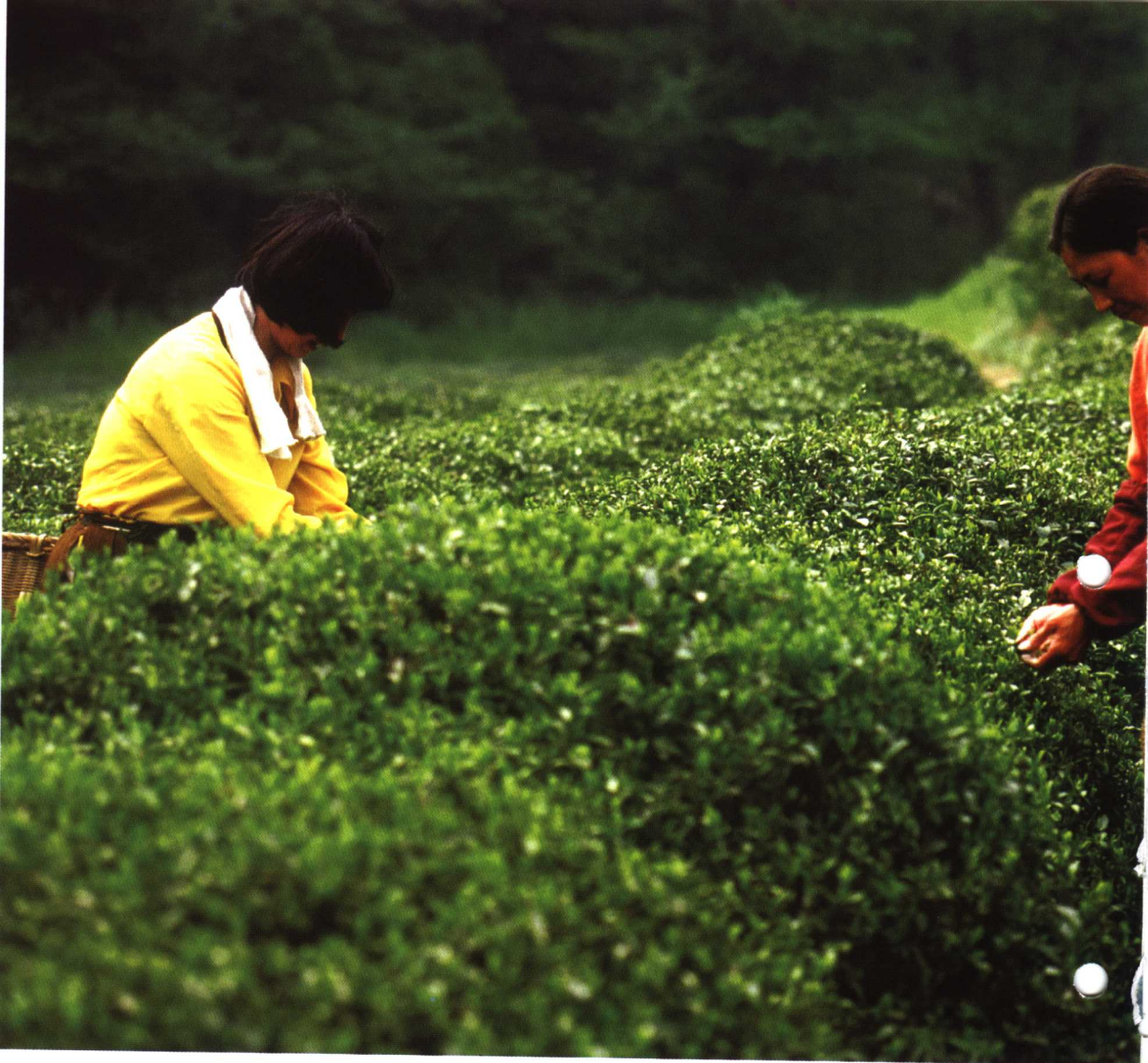
杭州茶园里工人采茶