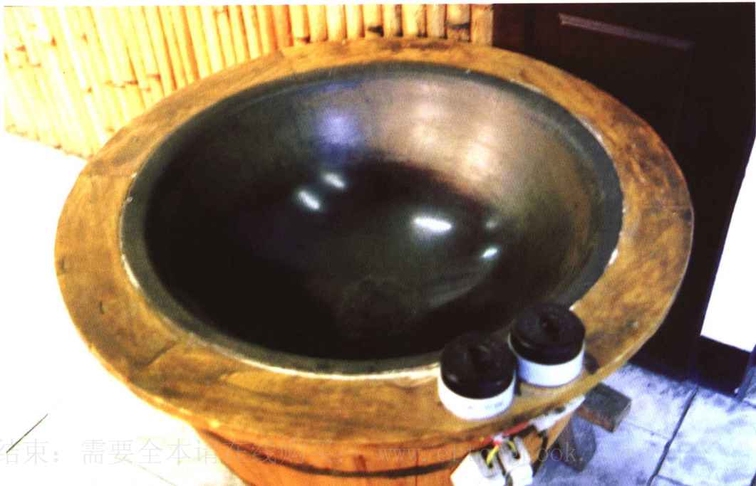
杭州中国茶叶博物馆展示的炒茶锅

龙井茶外形扁平挺秀，色泽绿翠，素以“色翠、香郁、味甘、形美”四绝著称，驰名中外。冲泡龙井茶时取一玻璃杯，用80度左右的开水冲进杯中，只见朵朵茶芽袅袅浮起，旗枪交相辉映，