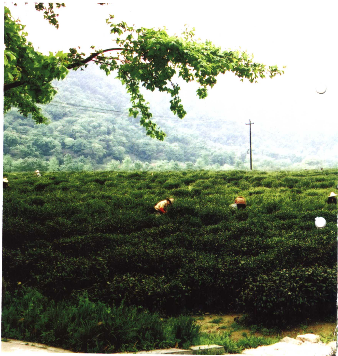
杭州西湖龙井茶田景色