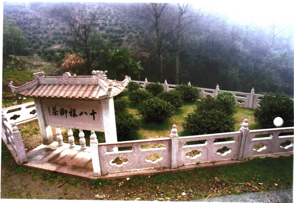
杭州龙井村18棵御茶树