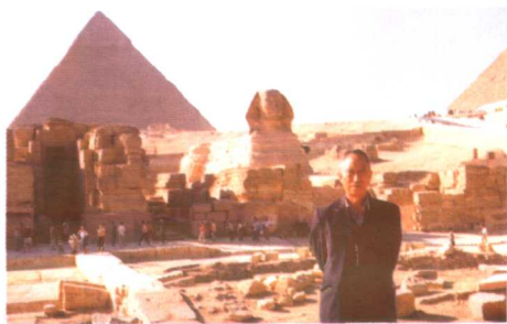
埃及——在金字塔与狮身人 面像前（2003年8月）