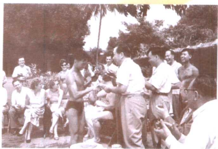
在中国驻缅甸大使馆——与苏联、东欧使馆跳水比赛，李一氓大使给我发奖（1958）