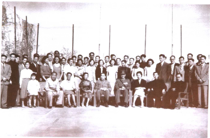
在中国驻巴基斯坦大使馆——周总理、贺龙副总理访巴合影（1957）