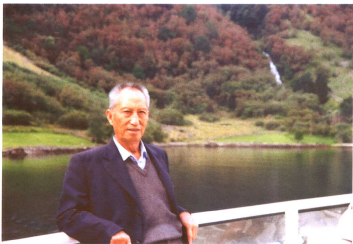
挪威——在美丽的峡江上（2004年8月）