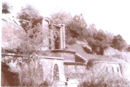
在中国驻阿富汗大使馆——在查希尔国王行宫游泳池游泳（1956）