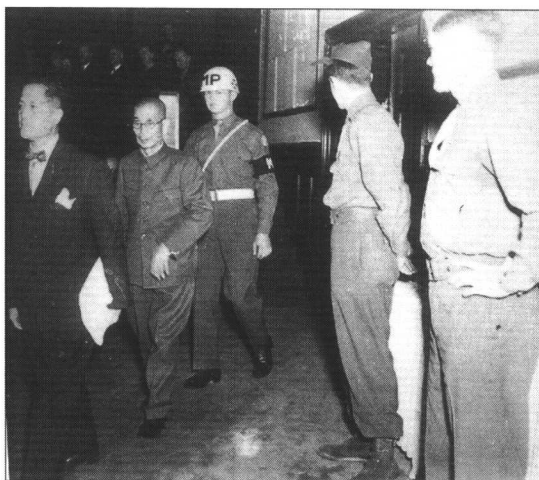
南京大屠杀案主犯松井石根（左二）在美军宪兵的押送下前往东京军事法庭受审。