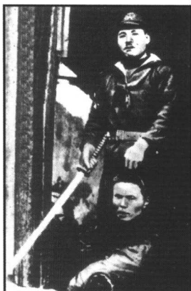
日军手提被残杀的 中国同胞首级，自鸣得意。