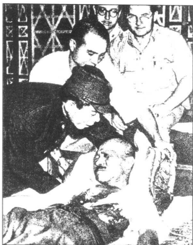
日本甲级战犯、首相东条英机被捕时以手枪向胸部射击，子弹偏离心脏，从肺部穿过，自杀未遂。后判处死刑。