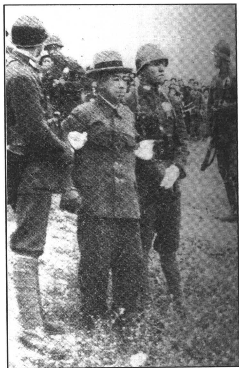
两腿瘫软的谷寿夫被中国士兵架着押往刑场。