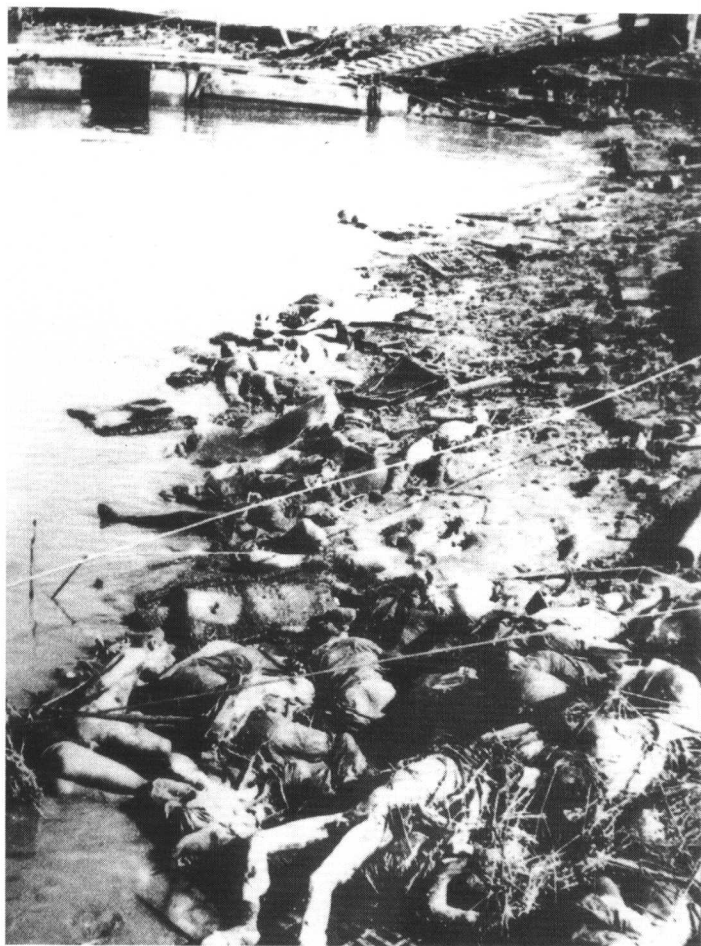
日[村]濑守保拍摄的下关江边被日军屠杀的 中国人尸体多如山积的场面。