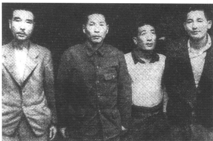
进行“杀人比赛”的凶犯向井敏明(右一)、野田毅(右二) 于1947年归案,1948年被中国军事法庭判处死刑。