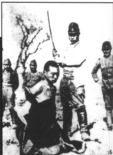
日军以残杀中国人为游戏， 旁观日军喜笑颜开。