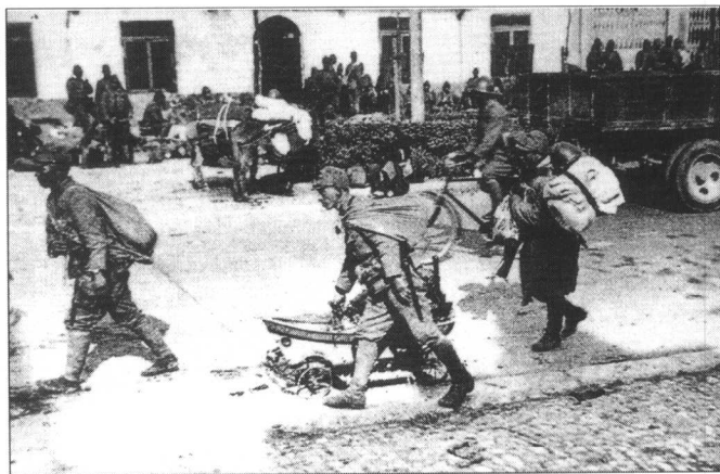
日军用卡车、骡马车、自行车,甚至中国的儿童车来装载劫得的财物。