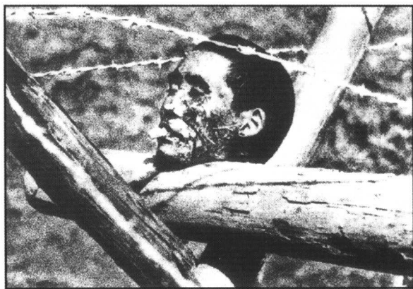
日军砍下中国人的头颅，置于铁丝网上， 还恶作剧在被害人嘴里插入一支香烟。