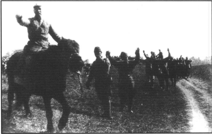
日本宣布无条件投降后,侵华日军纷纷向中国军队举手投降。