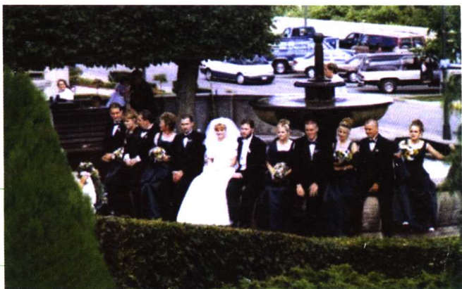
● 看婚礼浩浩荡荡 /2000年摄于加拿大