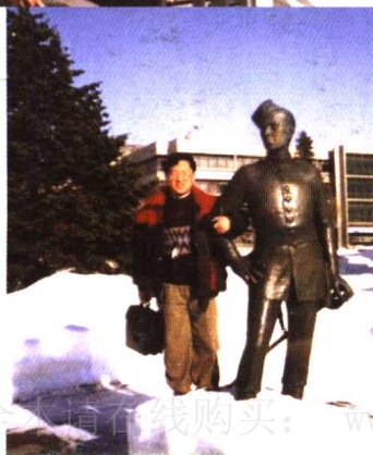
在皇家军事学院教书育人 2000年冬摄于加拿大