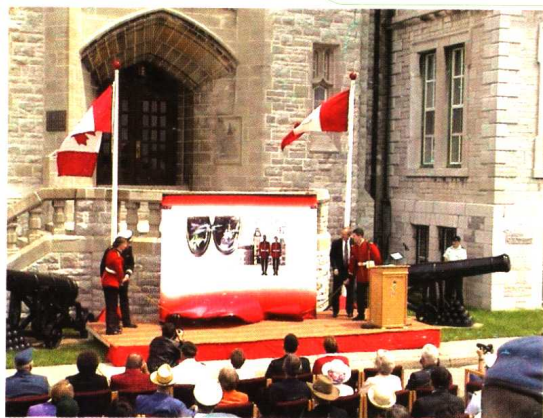
在加拿大皇家军事学院 一次毕业典礼上