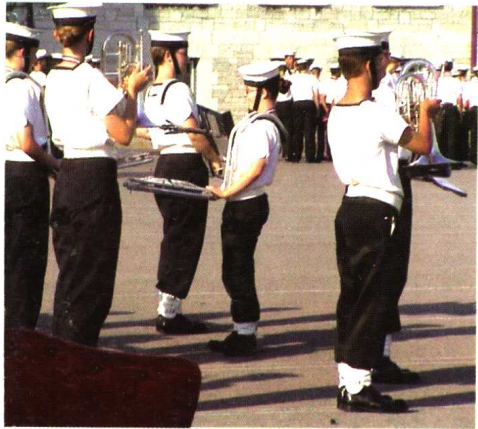
加拿大皇家军事学院的学生们正在操练