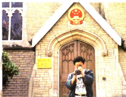
在中国驻曼彻斯特领事馆前 /1996年摄