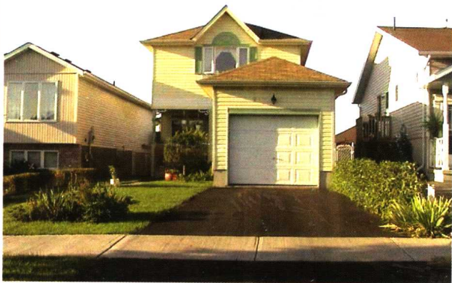
我在加拿大的家/2000年