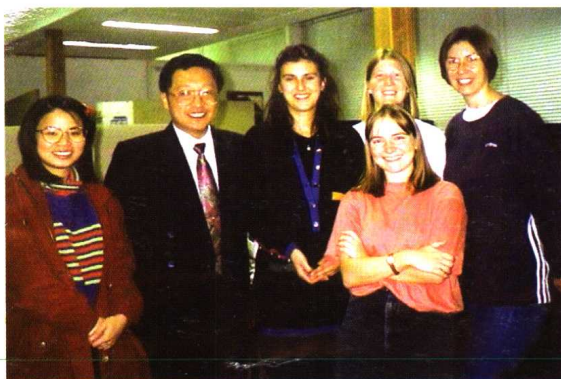
和师姐妹们一边教书一边学习 /1996年摄于英国利兹大学