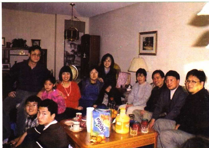
● 在多伦多和朋友们一起过圣诞节