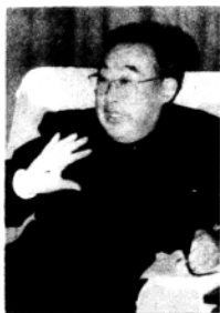
傅 锡 寿 学 长

工程师、副院长，马鞍山钢铁设计研究院院长，马鞍山钢铁公司党委书记、经理，中共马鞍山市委副书记。1987年起任中共安徽省委副书记，后兼任副省长，1989年起任安徽省省长，1992年连任。中共十三大、十四大代表，中共十三届中央候补委员，十四届中央委员。五届全国人大代表。