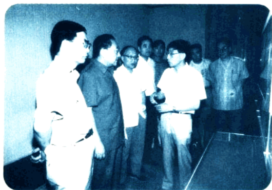
△核研院院长王大中向李岚清副总理(左2)介绍情况。

▽8月17日,张孝文校长(右2)会见毕业于新竹清华的著名科学家、诺贝尔奖获得者、美国加州大学伯克利分校教授李远哲(左2)和夫人,陪同会见的有汪家鼎教授(左1)。