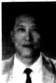
陈 士 能 学 长

1938年生，浙江嘉兴人，1956年毕业于上海高中毕业参军到青岛海军潜水艇学院学习，1958年因院系调整提前毕业离校、复员，1964年毕业于清华大学工程化学系，历任上海市合成橡胶研究所技术员、团总支副书记，四川晨光化工厂中心试验室负责人，西安市革委会工交办技术处干部，西安市塑料制品厂党委副书记、革委会主任，上海市化工局科技处干部，上海市塑料制品工业公司技术科科长、工程师，上海市二轻局总工程师、副局长，1984年起任国家轻工业部副部长、党组成员，1991年任贵州省副省长、党组成员，1993年1月起任贵州省委副书记、省长、省政府党组书记。