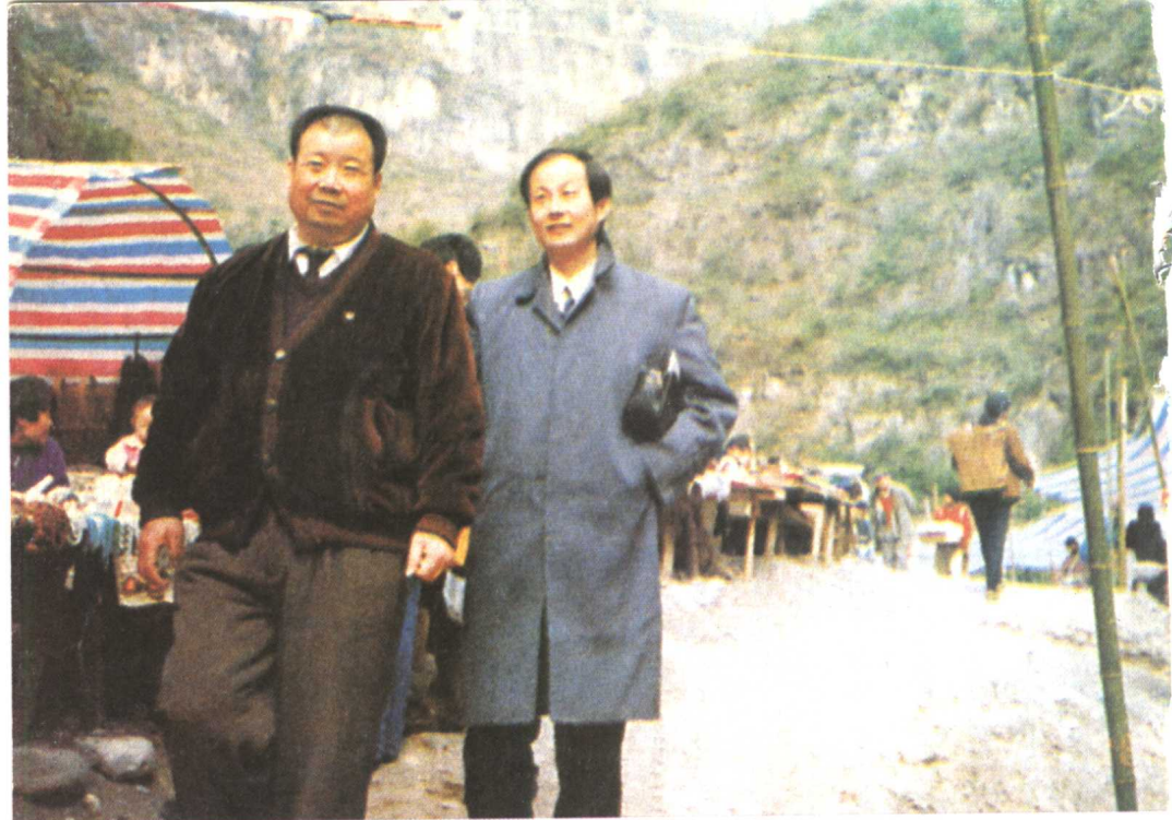
△ 和《雍正皇帝》责任编辑在三峡库区。