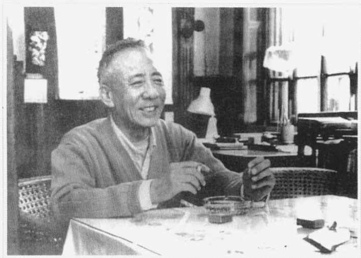
作者像 (1983年 天津)