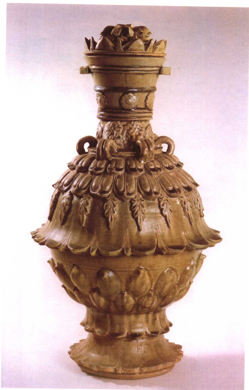
青瓷仰覆莲花尊 北魏