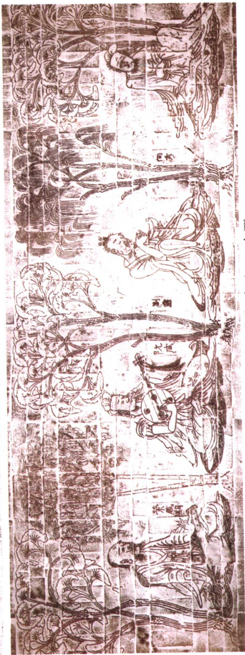
“竹林七贤及荣启期” 砖画 东晋