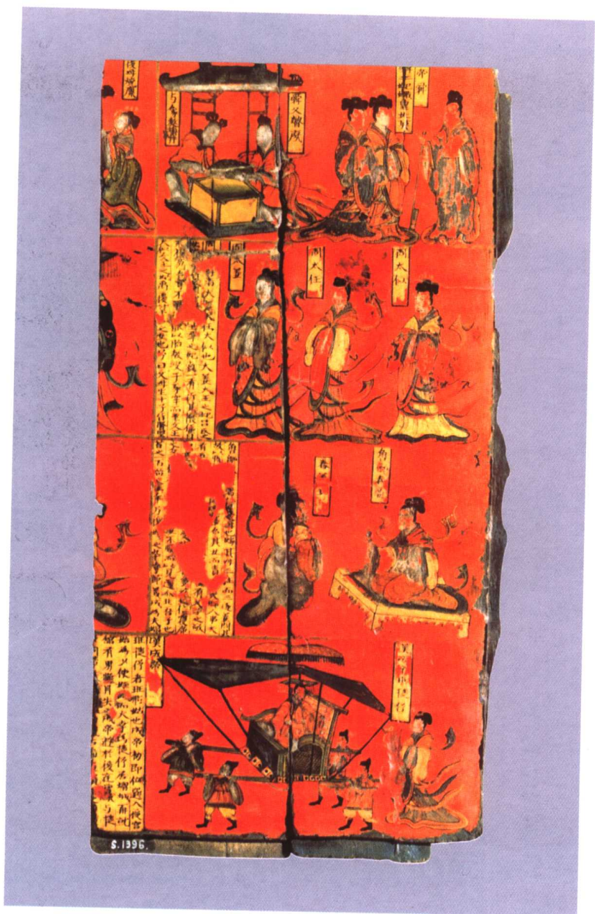
彩绘人物故事屏风 北魏