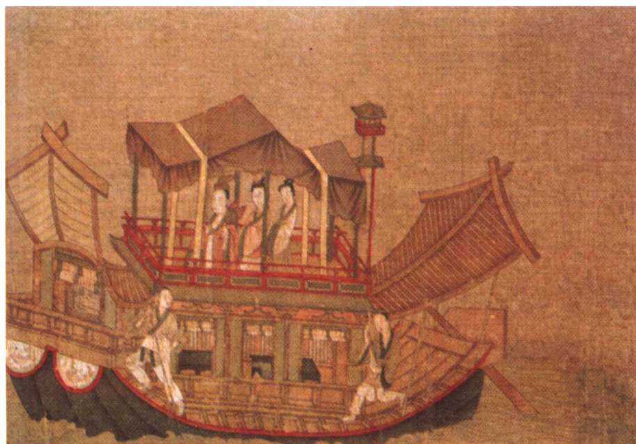
顾恺之(传) 洛神赋图卷 (局部) 东晋