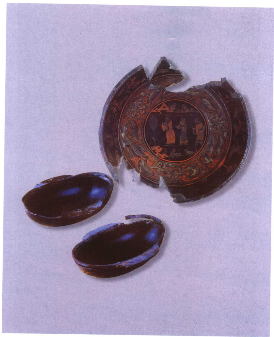
犀皮鑲金銅釳皮胎漆羽觞 三国·吴