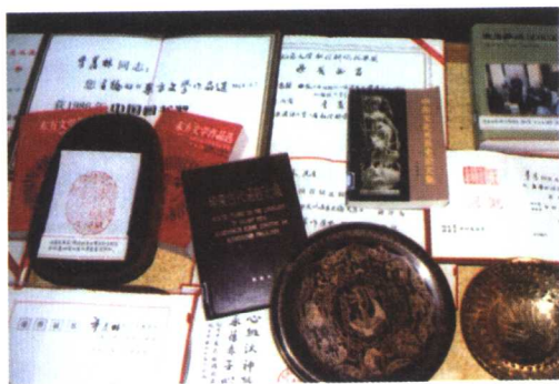
季先生的部分著作和奖状。