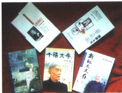
季先生 2000 年—2002 年出版的部分著作。