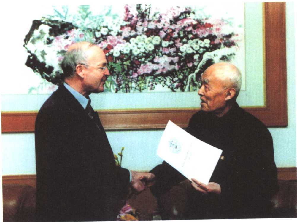
2000年德国驻华公使代表哥廷根大学授予季先生“金质奖章”。