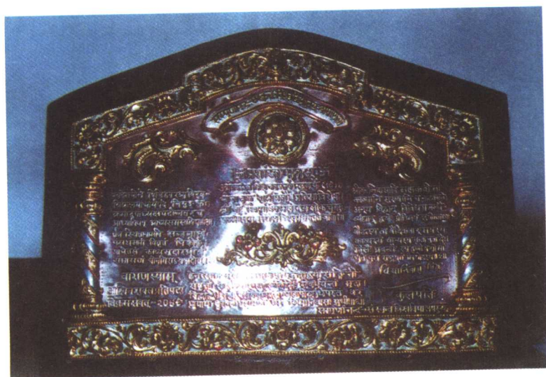
1992年11月季先生荣获印度瓦拉那西大学授予的最高荣誉奖“褒扬奖”。