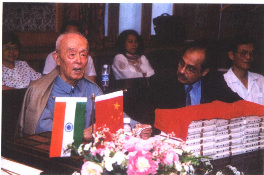
季先生致答词。