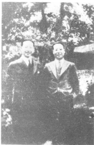
余上沅与梅兰芳合影