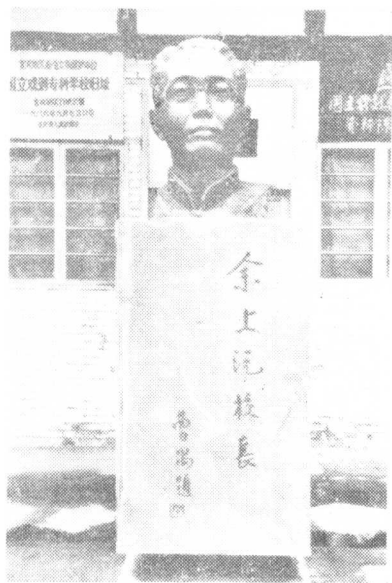
余上沅塑像 (江安国立剧专旧址)