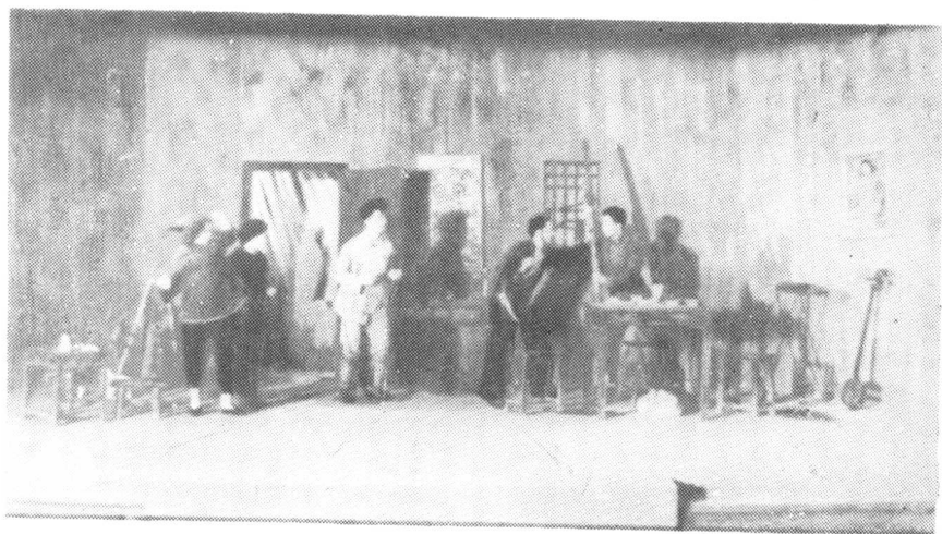
余上沅编导的《回家》演出剧照 (由国立戏剧学校第三届学生公演)