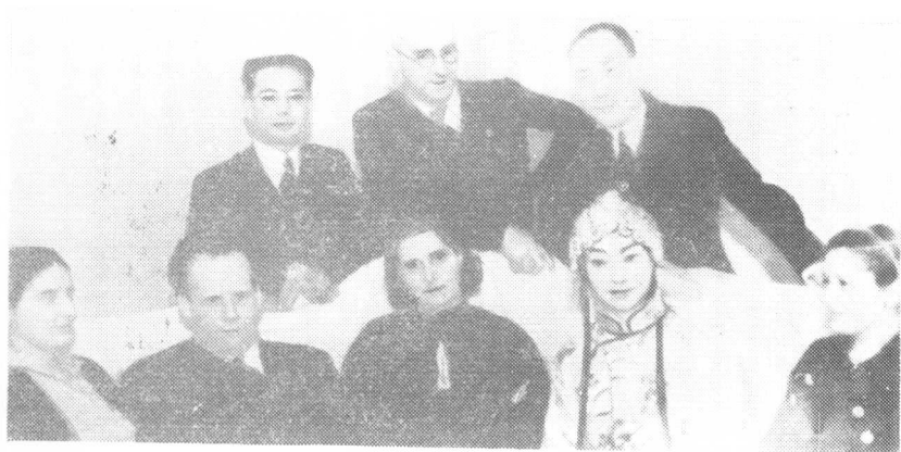
余上沅陪同梅兰芳与斯坦尼斯拉夫斯基等苏联戏剧大师会晤