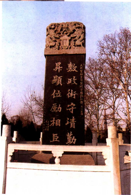
洛阳狄公碑林 中心碑刻 (碑上所刻文字 为武则天赐狄仁 杰自制的12个 金字)