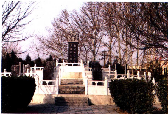
洛阳狄公碑林