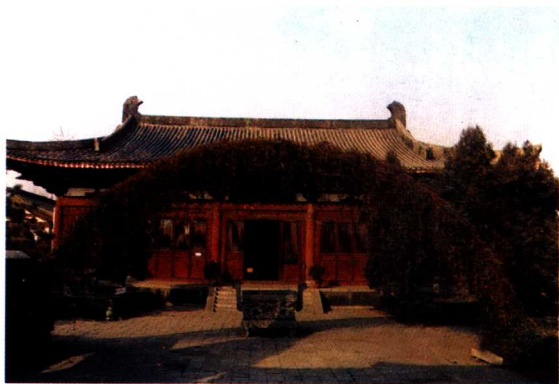
洛阳狄公祠 文惠殿