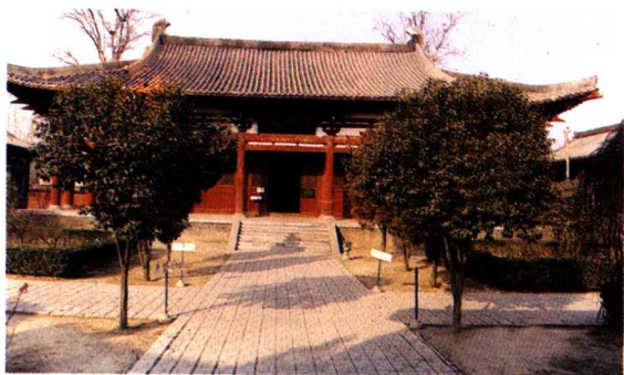
洛阳狄公祠 御封殿