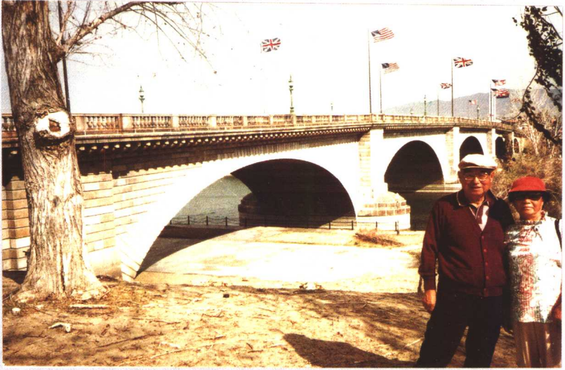
作者伉儷在倫敦橋