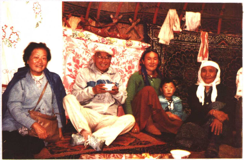
作者伉儷在新疆蒙古包