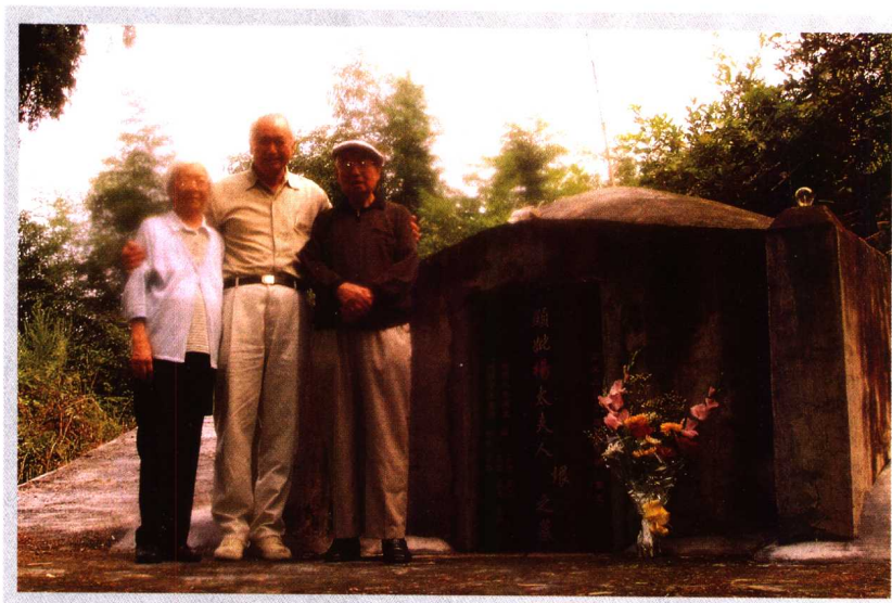
作者伉儷暨兒正中鶴村掃母墓