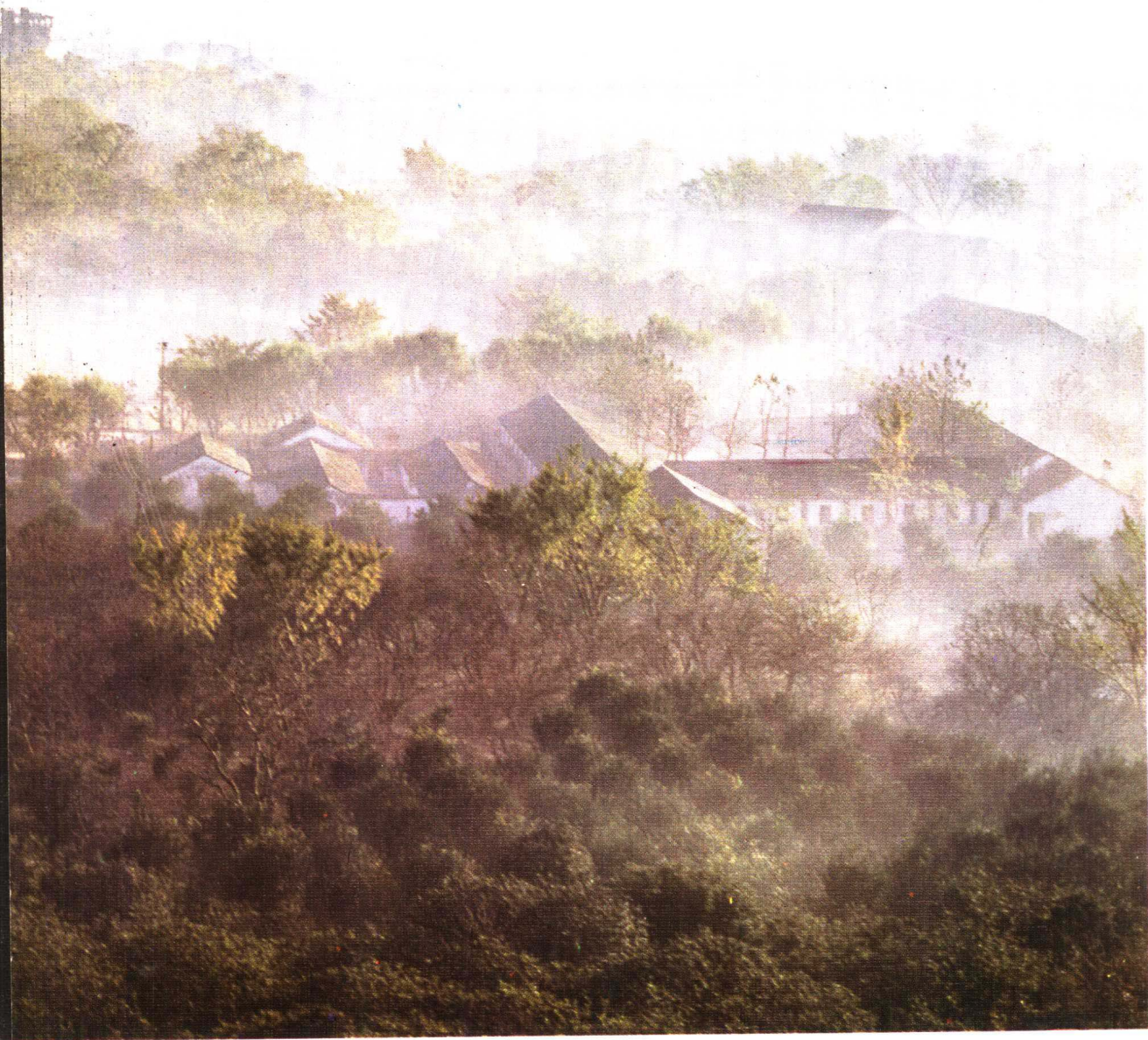
秋 晨