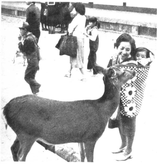
上：喂 鹿 右：京都岚山醍醐寺 下：东京的街道