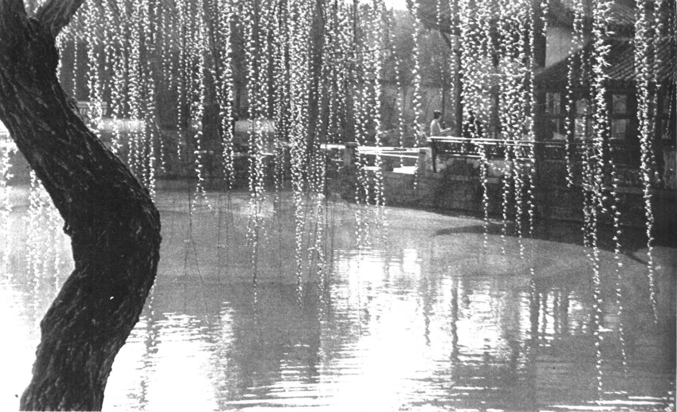
珠帘凝翠露华浓