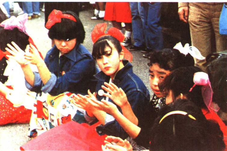
上：在火车上 中：假日