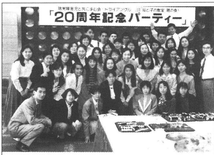
“母子教室”毕业生同学会