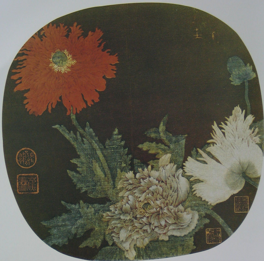
罌粟花图 宋 无款 绢本 设色 纵二五·五厘米 横二六·二厘米

《罌粟花图》是南宋重彩花鸟画的经典之作，描绘朱砂、粉紫、粉红三朵罌粟花，姿态各异，蔚有生机。从构图上看，较为集中的部分是粉紫、粉红两花，一朵斜侧，一朵背向，在绿叶簇拥中娇柔含羞。而上扬的花柄和叶片，则将观众的视线引向左上方当阳的红花——画面的主角。右上方的空间内，巧妙地点缀了一枚花瓣早已凋谢的花房，朴实自然。这样的构图重心稳重，主体突出。画面底色深重，衬托出石色的花与叶，响亮的色彩在深色背景上格外雍容堂皇，浓丽而不过分张扬。足见原作画家对色彩、造型的把握极有分寸。