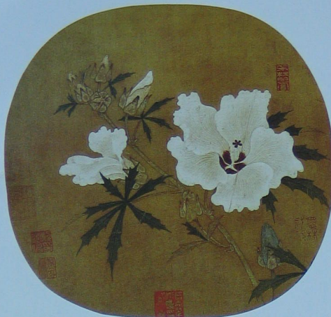
秋葵图 宋 无款 绢本 设色 纵二三·四厘米 横二五·八厘米