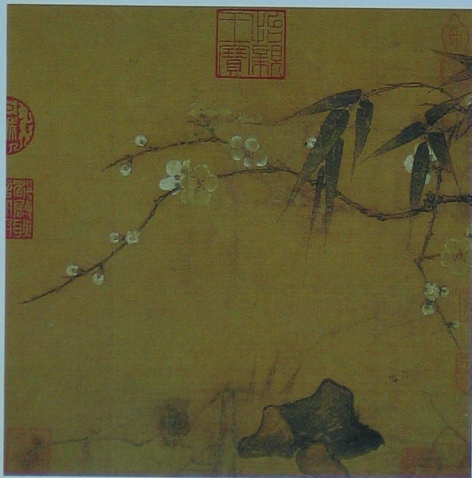
暗香疏影图 宋 马麟 绢本 设色 纵二四·九厘米 横二四·六厘米