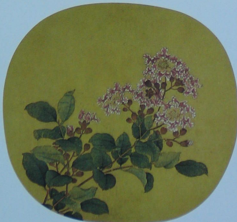
写生紫薇图 宋 卫昇 绢本 设色 纵二三·八厘米 横二五·三厘米