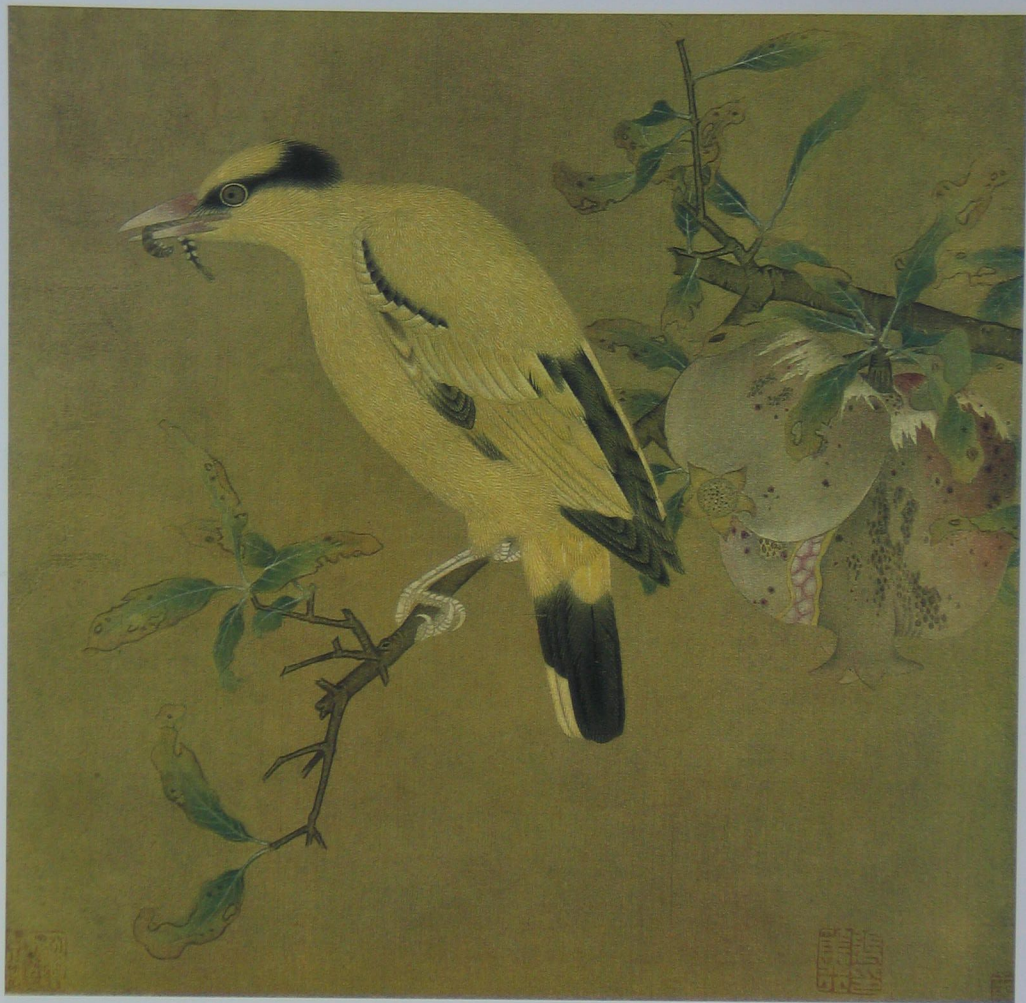
榴枝黄鸟图 宋 无款 绢本 设色 纵二四·六厘米 横二五·五厘米

《榴枝黄鸟图》描绘一只羽翼丰满的黄鹂，站在深夏的石榴枝头上，黄鹂鸟形体精准，羽翼结构写实而微妙，栩栩如生，逼真传神，是宋人翎毛的经典之作。黄鹂口衔毛虫为食，生动有趣，充满了生活情趣，宋代画家完全是从自然的现象中抓住了黄鹂捕食这一鲜活的瞬间。此外，对于背景的描绘也是细致入微，刻画了石榴结实初绽的季节，枝叶翻转、摇曳，色彩细腻，变化微妙。