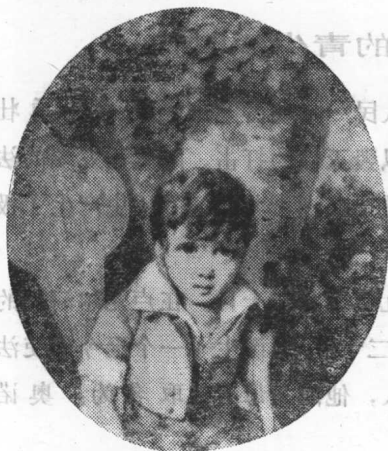
童年时代的巴尔扎克