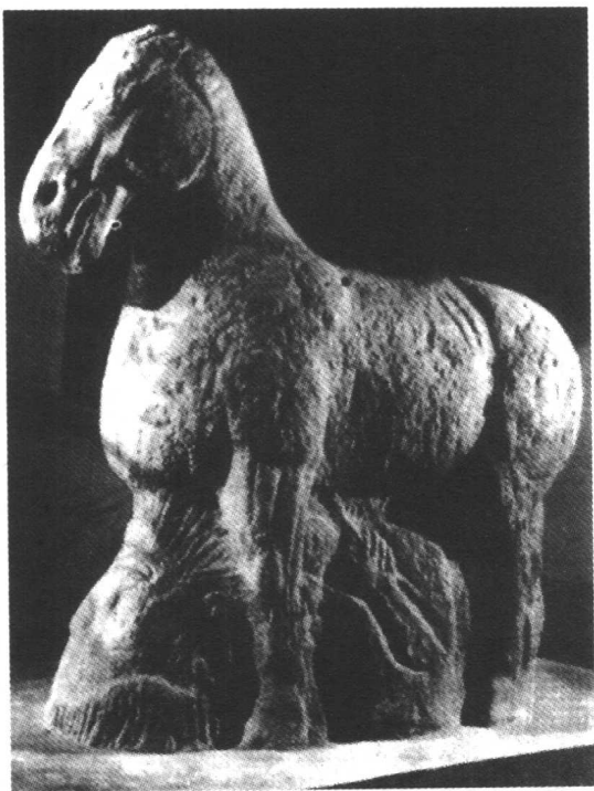
图2 霍去病墓马踏匈奴石刻

霍去病将军的形象,但却能使人们想象到他当年驰骋疆场的勃勃英姿,从而缅怀他为国家、民族贡献青春的崇高精神,铭记他的丰功伟绩。在雕刻技法上,突出了我国古代传统艺术的特点,就是只表现对象的‘神’,而不再现对象的‘形’。把圆雕、浮雕与线刻有机结合起来,既自由又凝练的手法,增强了作品的