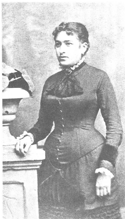
卡夫卡之母朱莉叶·勒维。