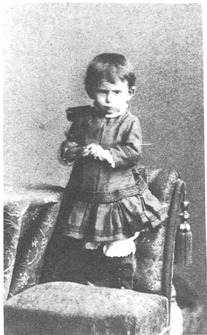
卡夫卡两岁时,为了拍照的趣味,故作愤怒状。