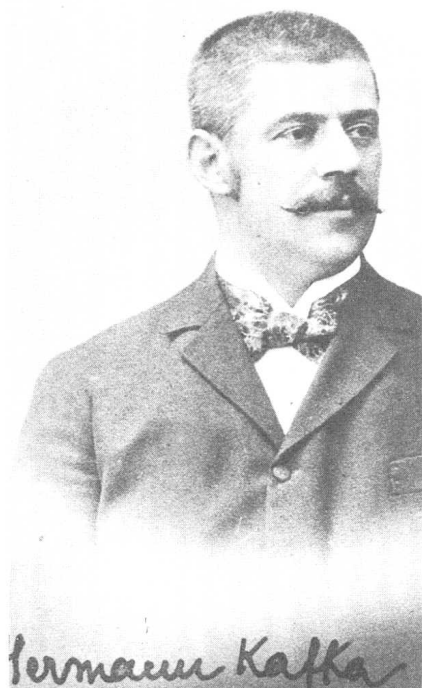
卡夫卡之父赫尔曼·卡夫卡。