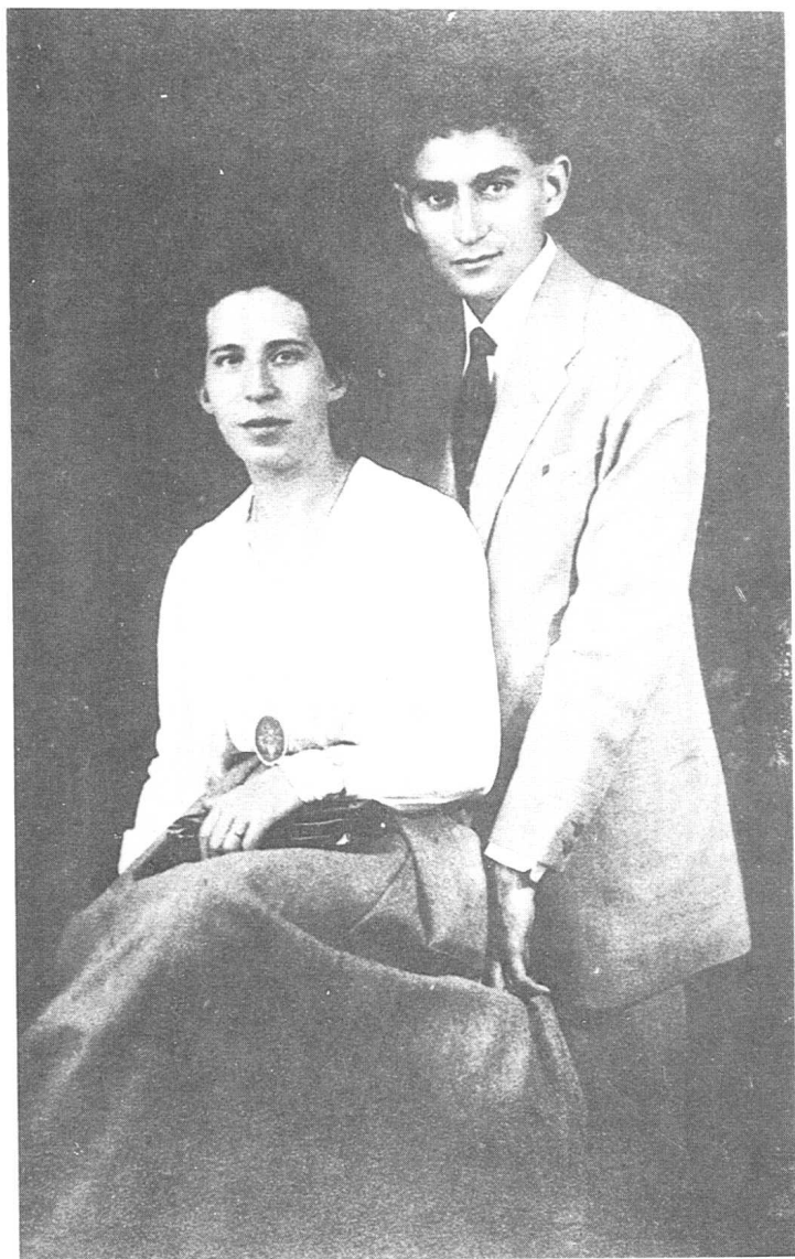
卡夫卡与未婚妻费莉莎。