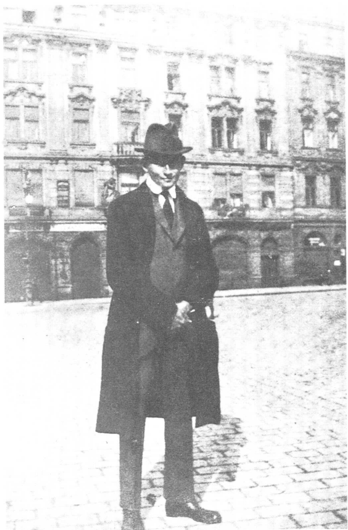
1922年卡夫卡摄于布拉格住家大楼前的广场。