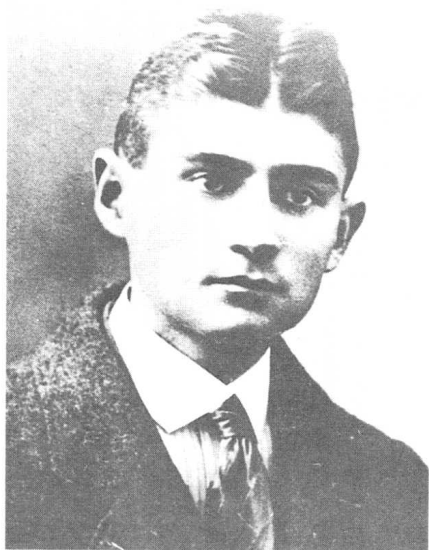
卡夫卡开始任职于保险公司,对办公室的生活他感到极大的压力与无奈。