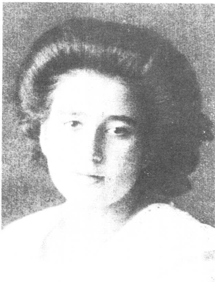
卡夫卡最喜爱的妹妹奥特拉。