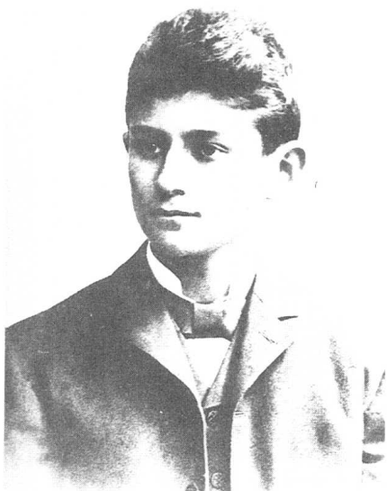
1901年卡夫卡从中学毕业,进入大学,选读两星期的化学后才改读法律,并旁听艺术史。