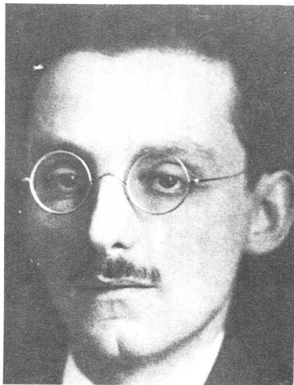
马克斯·布洛德,卡夫卡的终生好友,不嫌烦琐地为卡夫卡整理遗稿,公诸于世。