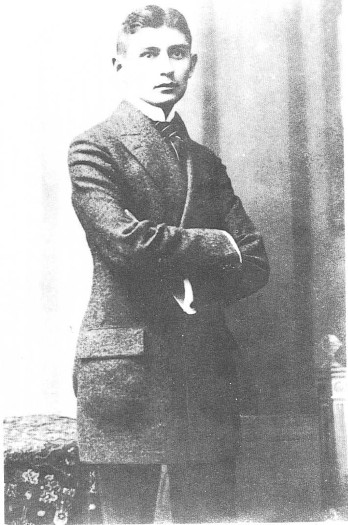
卡夫卡于1906年获得法学博士学位。法学并非他的兴趣，但是他仍然努力研读，成绩十分优异。