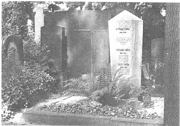
布拉格施特拉尼彻公墓的卡夫卡墓。