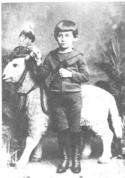
卡夫卡五岁时对于周围一切已毫无安全感。