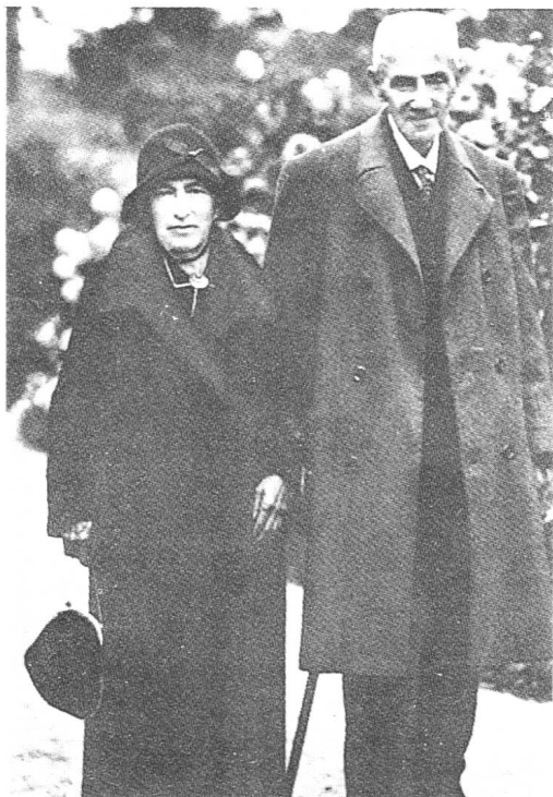
卡夫卡的父母1930年在 巴特·波第勃拉特。