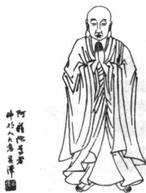
阿难陀尊者 禅宗八代祖师 图