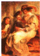
第一影响力艺术宝库

生欢乐的，气势宏伟、色彩丰富、运动感强、积极肯定的画风。这种画风及其倾向代表着巴洛克宫廷美术的健康的一面。