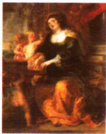
第一影响力艺术宝库

象。1630年至1640年间，鲁本斯的绘画进入了一个新的发展阶段。在用色用笔方面，比上一阶段的油画更为奔放自如，在画风上，有点接近于提香晚年的油画。虽然因患风湿病而手指成为畸形，但他仍坚持画大型的人物油画。