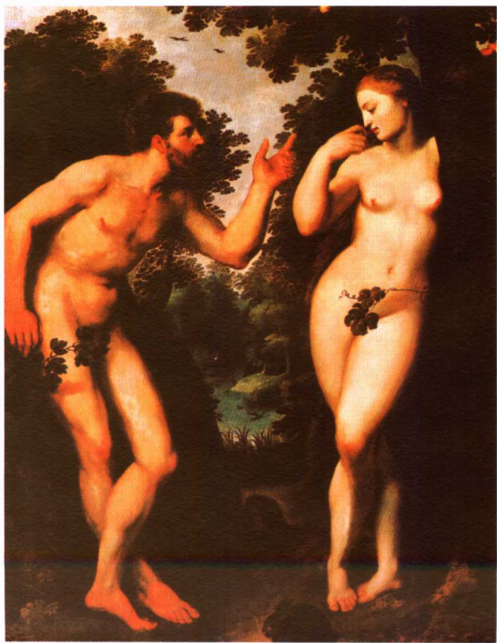
板上油画 180 × 158cm 安特卫普鲁本斯邸宅藏

《圣经》上说：亚当与夏娃无忧无虑地生活在伊甸园中，因为抵抗不了蛇的引诱，偷吃了树上的禁果，被愤怒的上帝逐出伊甸园，从此开始艰苦的生活。这幅作品描绘的是亚当和夏娃偷尝禁果后，有了智慧和羞耻感，开始用树叶遮蔽身体。这是画家早期的作品，此时画家还没有形成独特的个人风格。✍