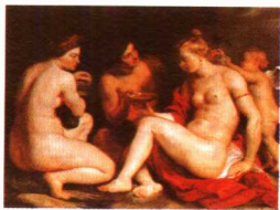
第一影响力艺术宝库