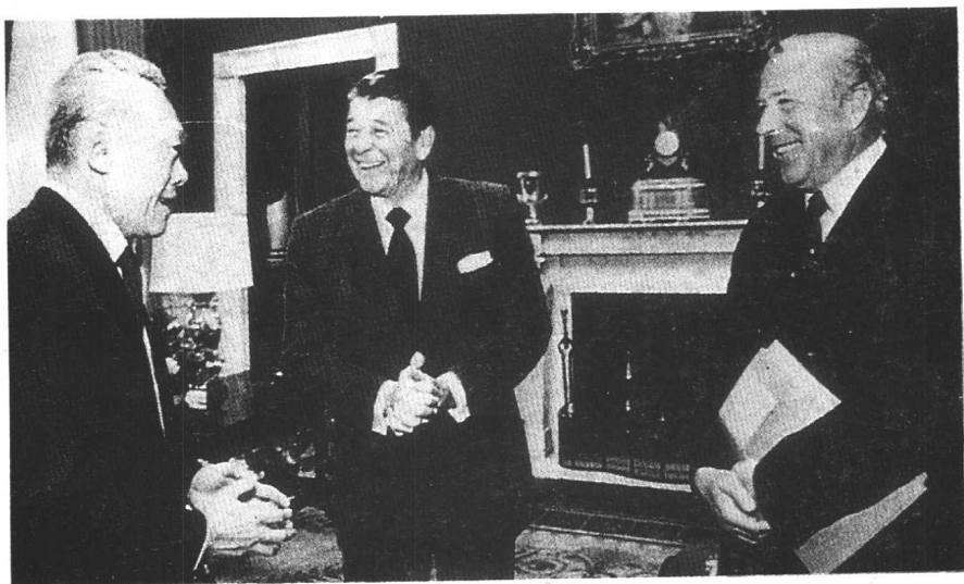
1982年，李光耀访问美国时，和美国总统里根、国务卿舒尔兹交谈。