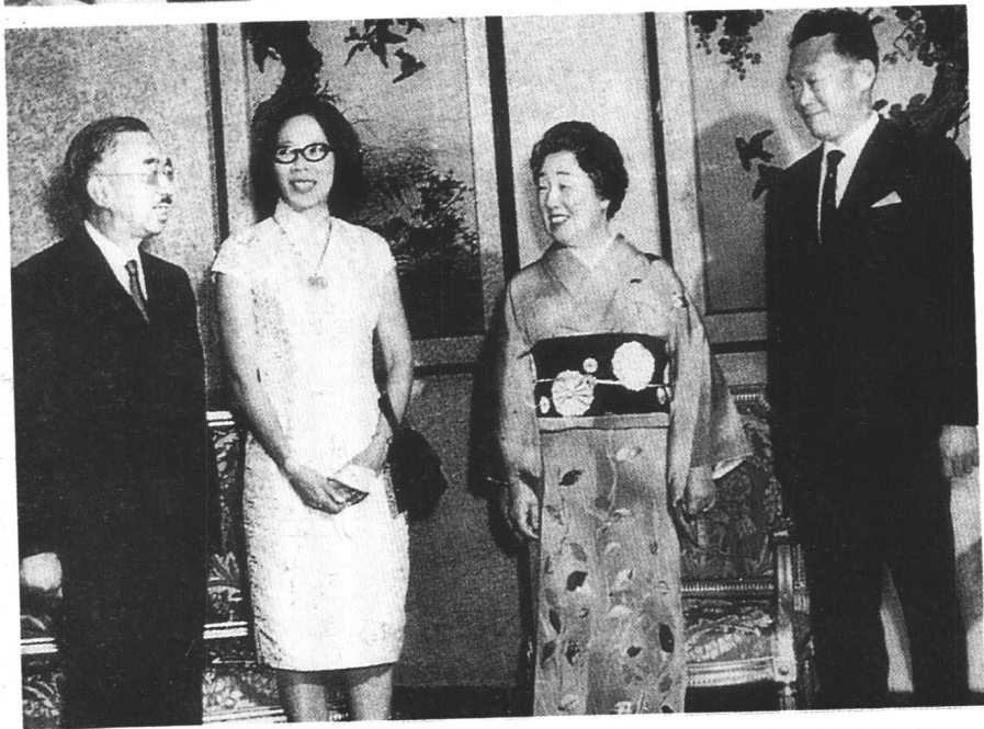
1968年，李光耀夫妇访问日本时，在东京皇宫会见裕仁天皇与皇后。