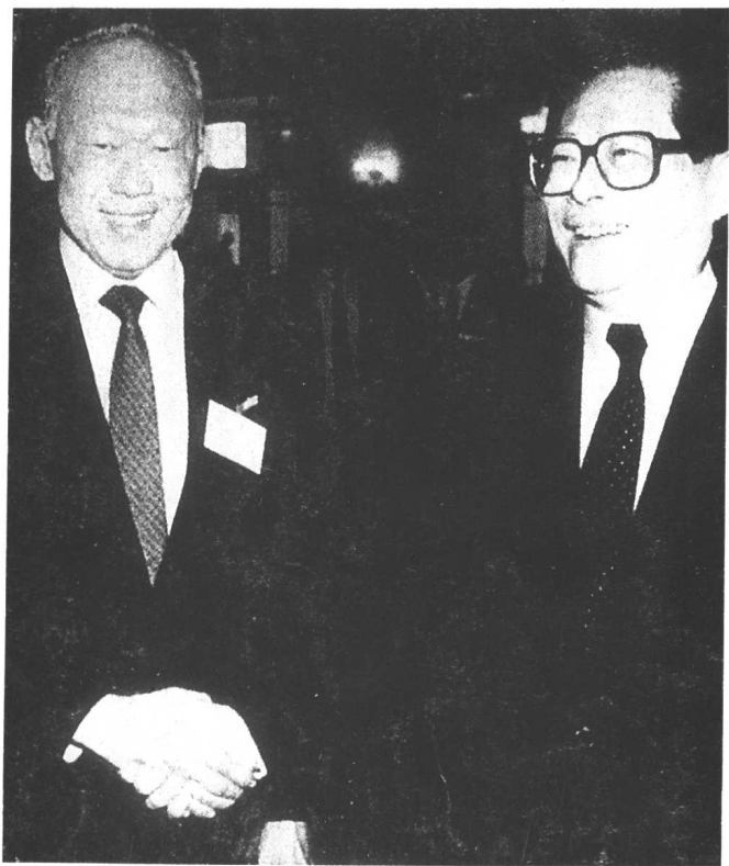
1993年， 李光耀访华时， 江泽民主席会 见他。