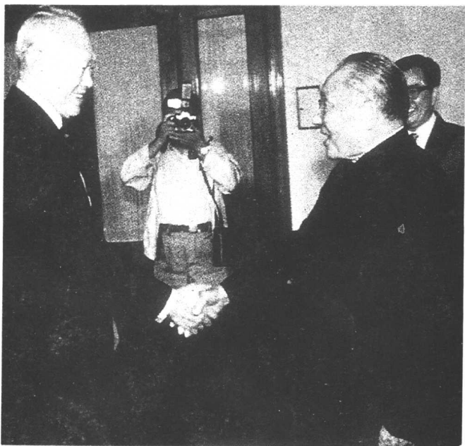
1988年， 李光耀访华时， 邓小平会见他。