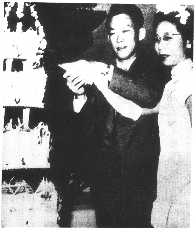
1950年,李光耀和柯玉芝携手步上红毯,共切蛋糕。