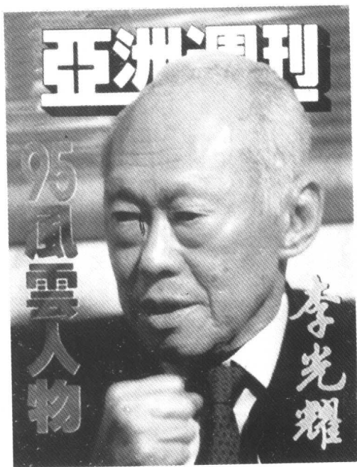
李光耀被《亚洲周刊》评为'95风云人物。