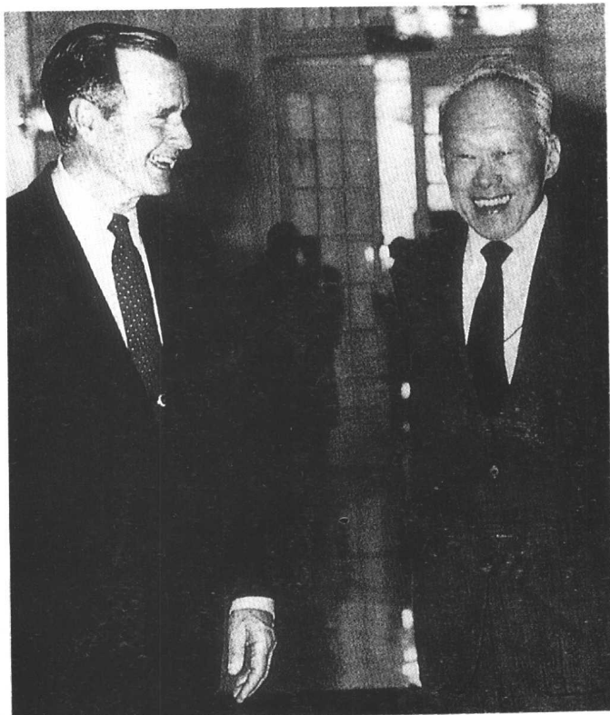
李光耀会见 美国总统布什。