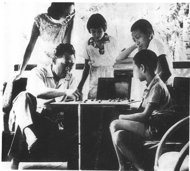
李光耀和大儿子李显龙在家下棋,家人在旁观战。