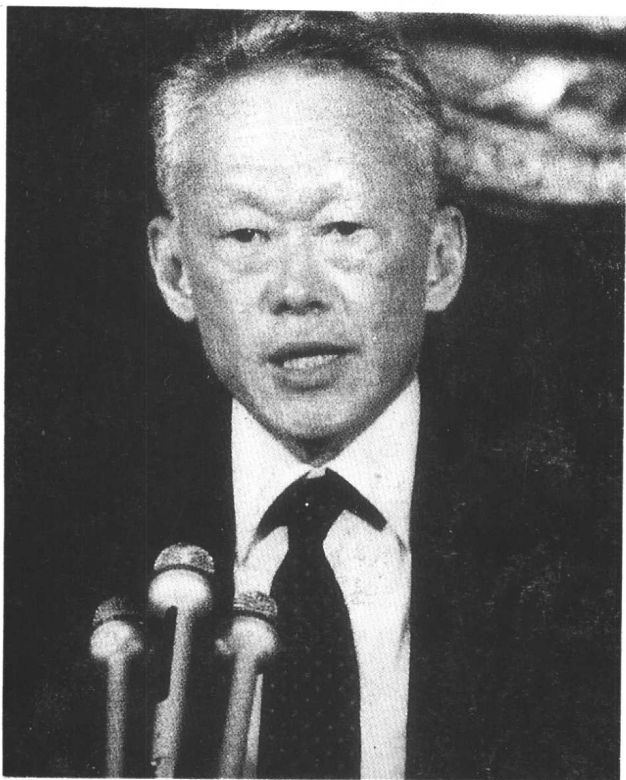
李光耀是一个 善于雄辩的政治家。