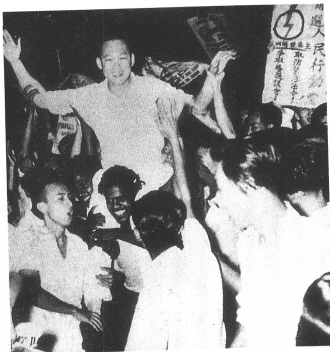
1955年，李光耀首次参加立法议会选举，此为当选后的场面。