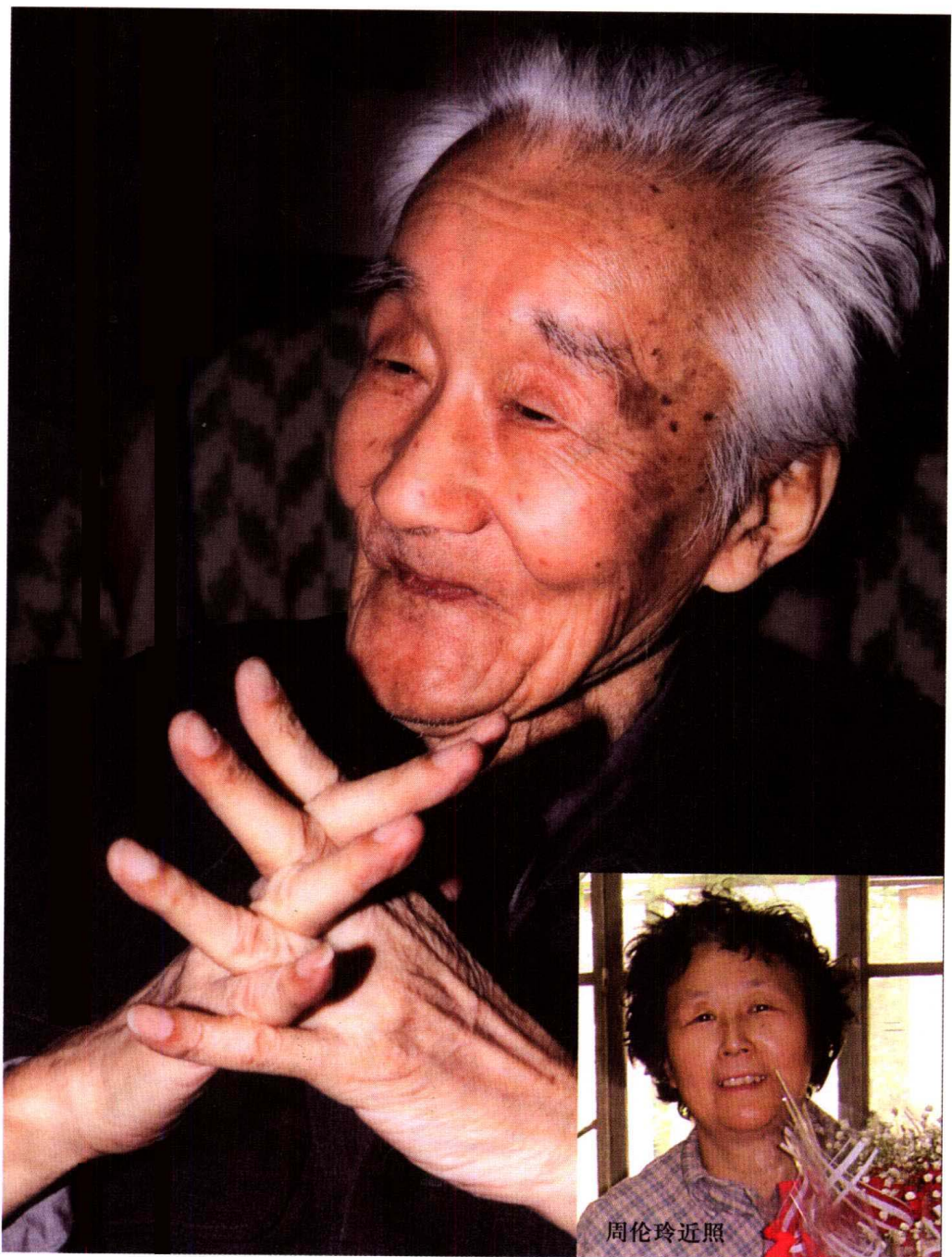
周汝昌近照 (黄亦工 摄)