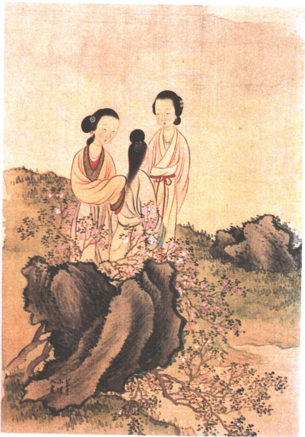
翠墨、入画、小螺(清红楼名画家改琦 绘)