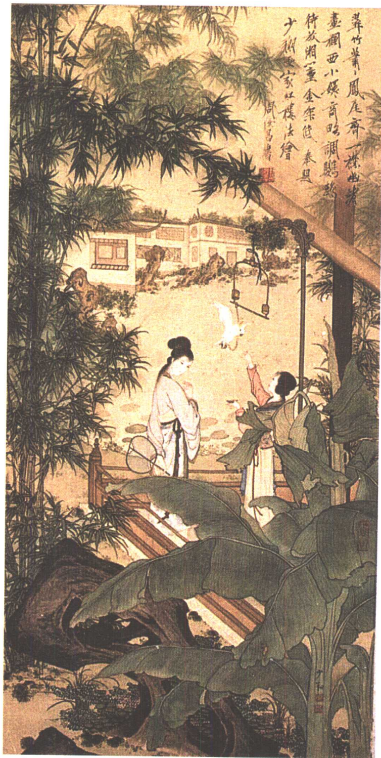
潇湘倩影(晏少翔 绘)