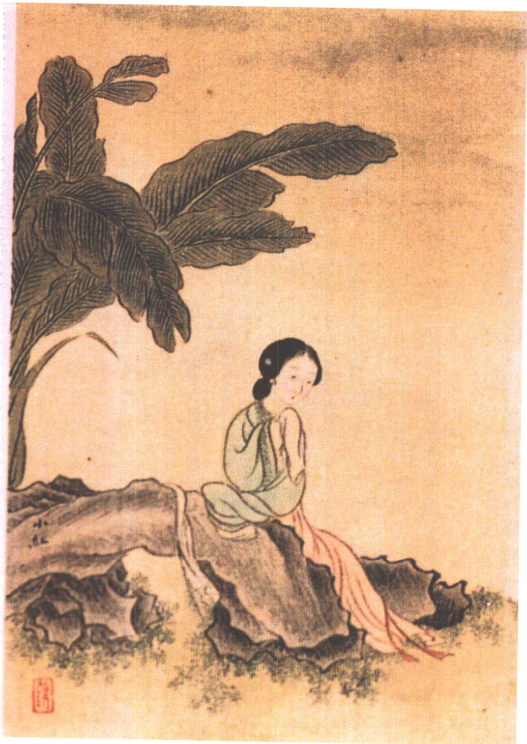
小红(清红楼名画家改琦 绘)