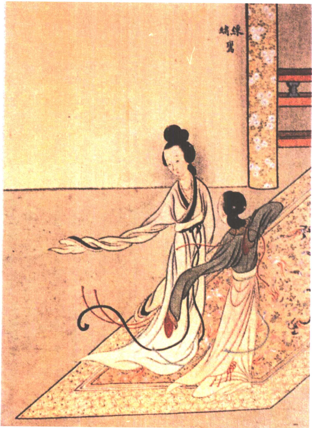
绣鸾、彩鸾(清红楼名画家改琦 绘)