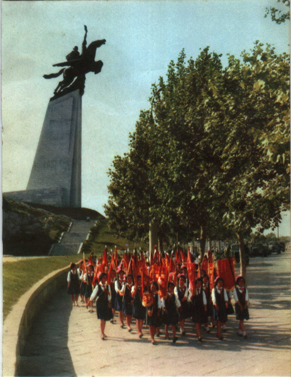
迎着朝霞，腾空飞翔的千里马，象征着朝鲜人民在社会主义建设大道上一往无前的英雄气概。