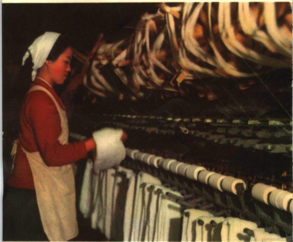
朝鲜地方工业如雨后春笋般蓬勃发展，这是沙里院毛巾厂的女工在车间劳动。