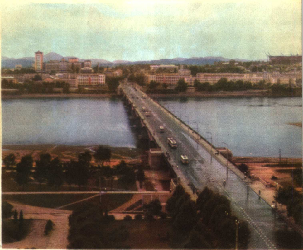
宏伟的玉流桥把东西平壤紧紧地 连接起来，使平壤变得更加壮丽。