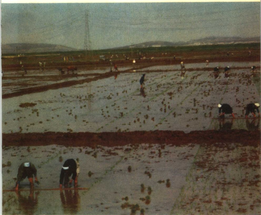
五月的朝鲜农村，到处呈现着一派生气勃勃的繁忙景象，这是农民在田间插秧。