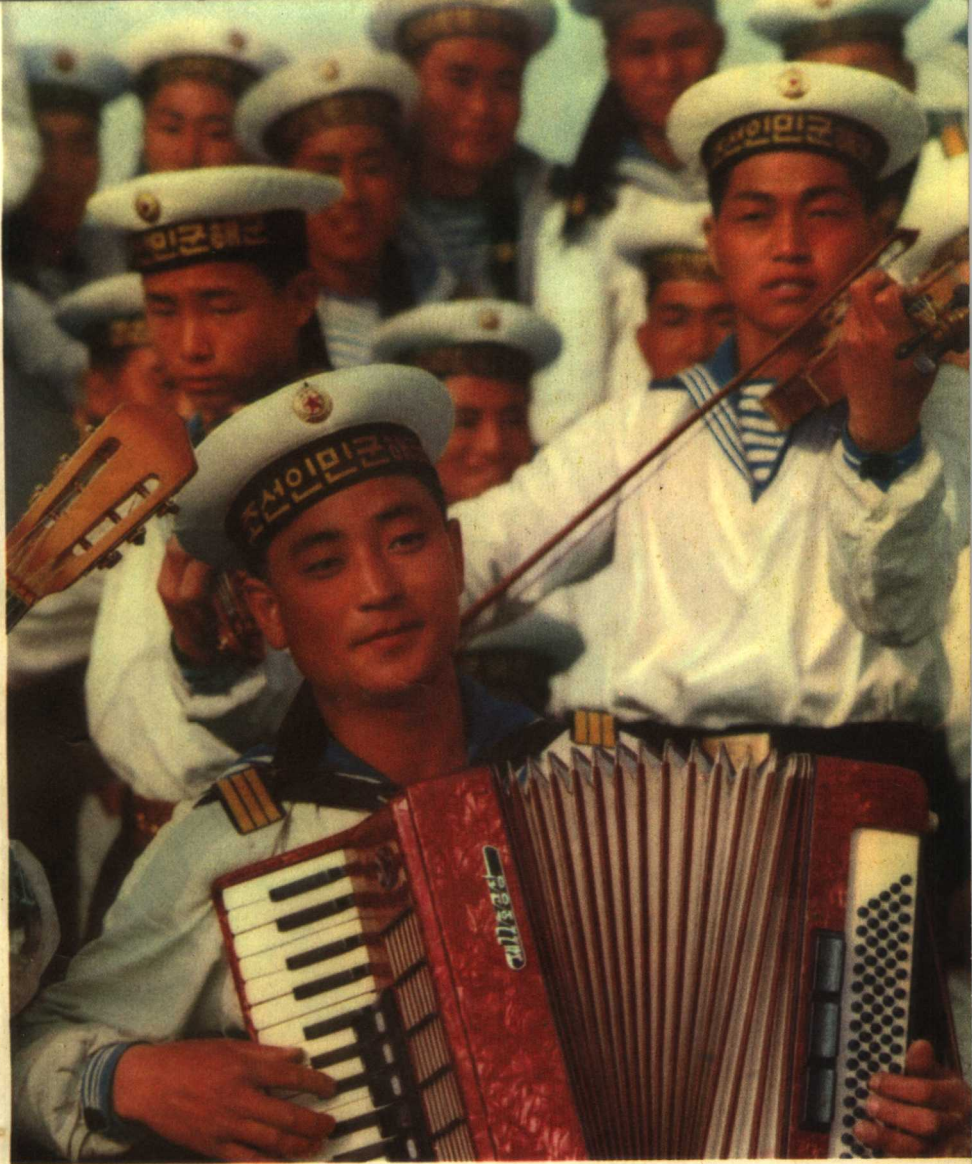
朝鲜人民军海军战士在军舰甲板上表演文艺节目。