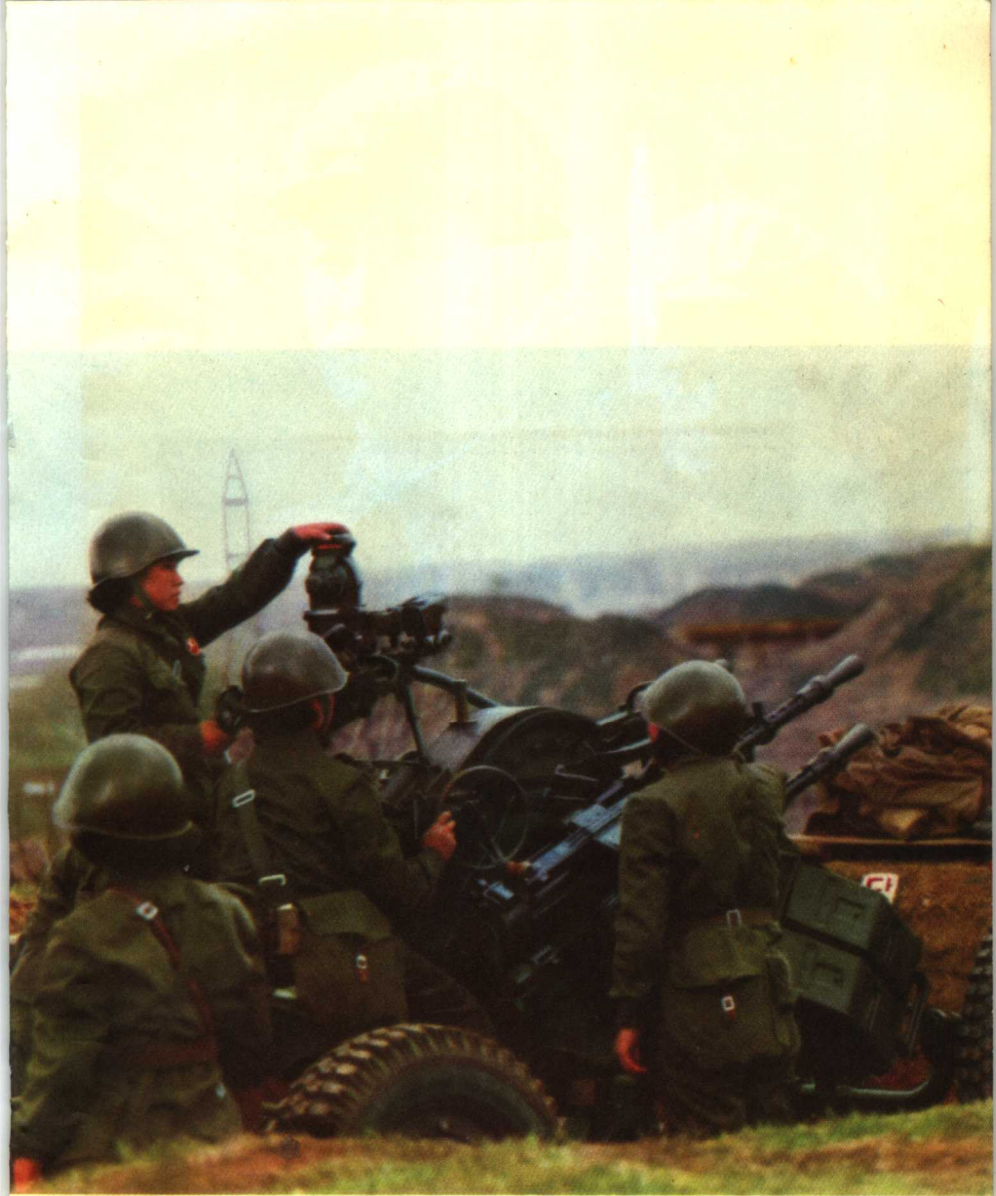
朝鲜女大学生参加军事训练，为 保卫祖国苦练杀敌本领。