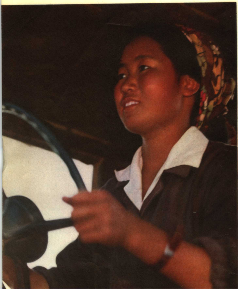
青山里的女拖拉机手正在田间劳动。