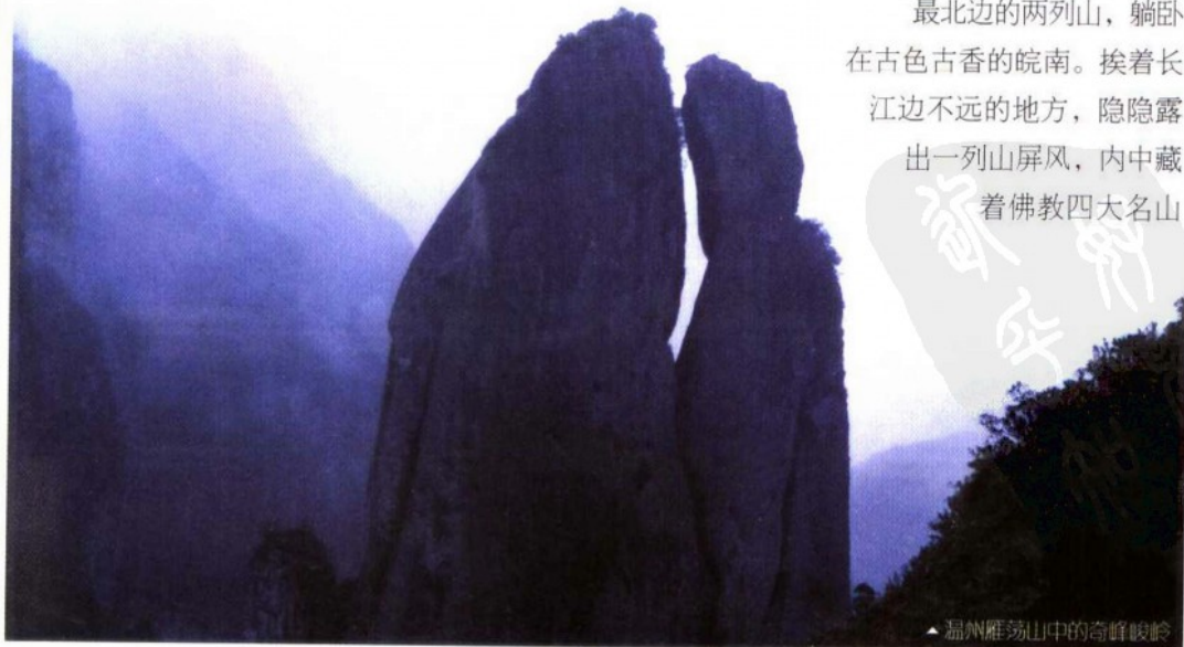
温州雁荡山中的奇峰峻岭

最北边的两列山，躺卧在古色古香的皖南。挨着长江边不远的地方，隐隐露出一列山屏风，内中藏着佛教四大名山