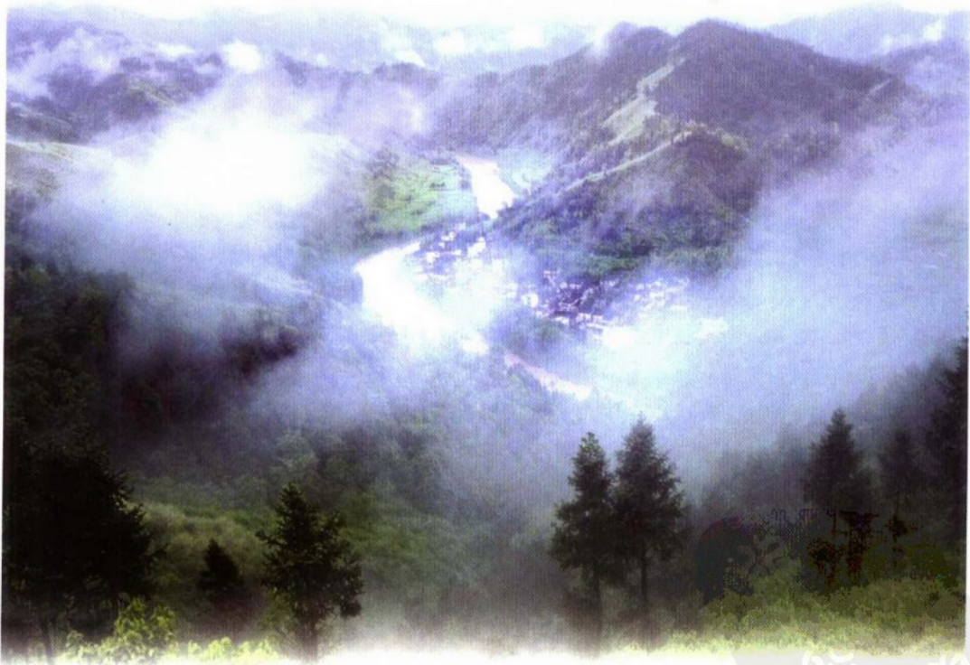
▲ 雨雾中的东南山区