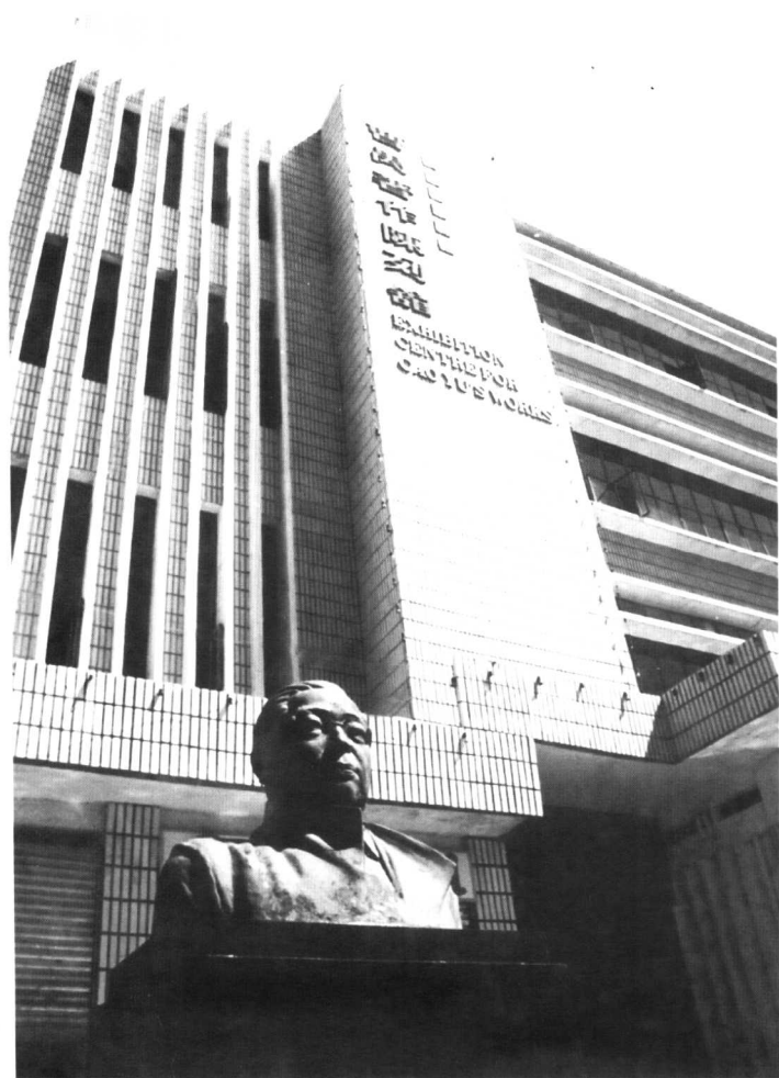
潜江市曹禺著作陈列馆