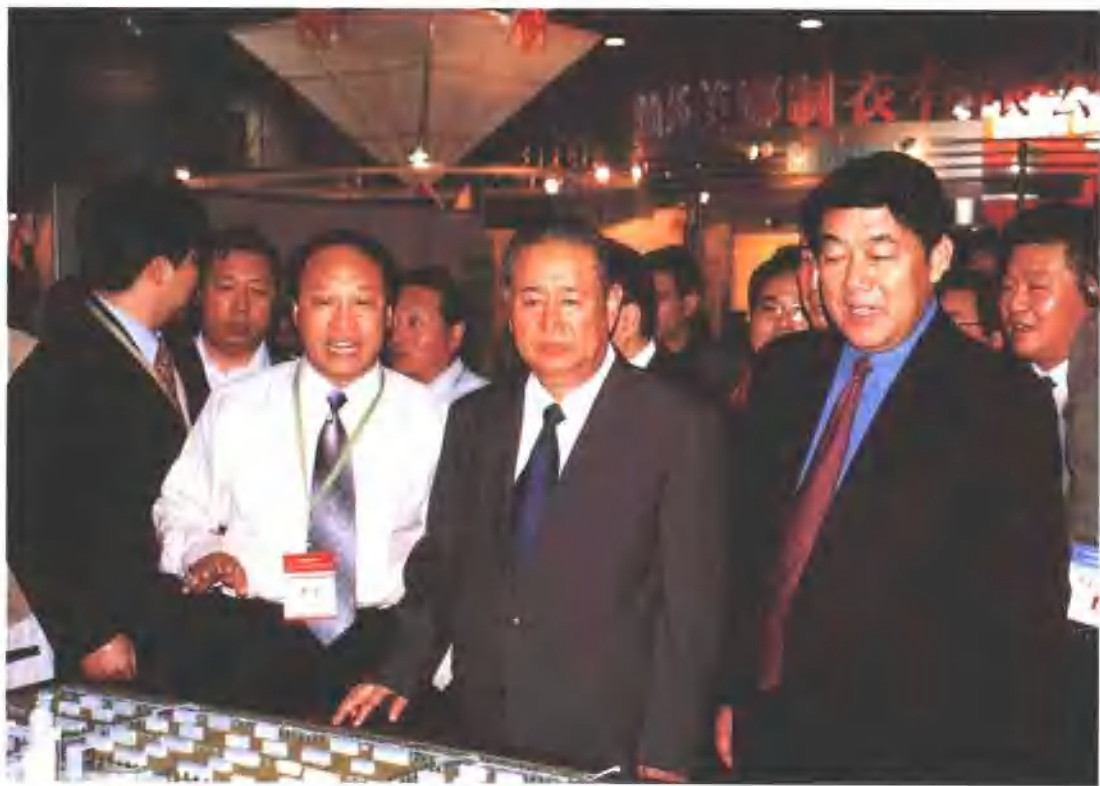
中共中央政治局委员，全国人大常委会副委员长姜春云（前右二）在中共青岛市委书记张惠来（前右一）陪同下视察青岛服装工业园展区。