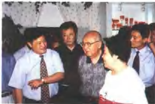
2001年7月25日，全国人大常委会副委员长王光英视察金王集团。