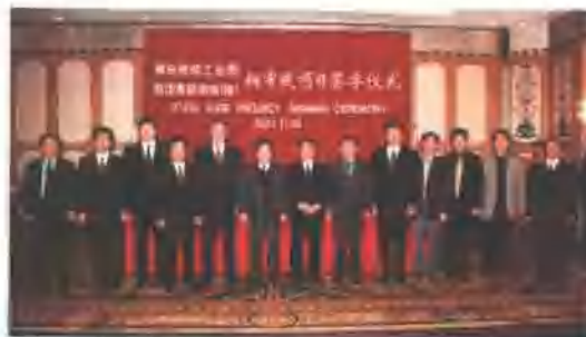
青岛服装工业园与韩国高丽纺织（株）投资8000万美元的院线项目签字仪式

青岛服装工业园成立于2000年3月，总规划面积7.7平方公里，是青岛市十大重点工业园之一，是山东省唯一的税外无费专业园区，是以纺织、服装、服饰等轻工行业企业为主体的专业园区。