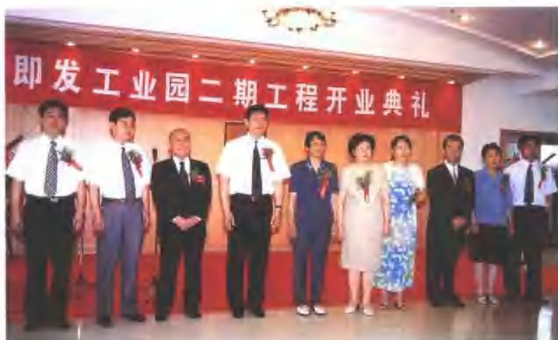
即发工业园二期工程开业

2001年，青岛服装工业园与韩国高丽钢线(株)签订钢帘线项目。该项目是年内青岛市第二个投资额最多的外商工业项目。