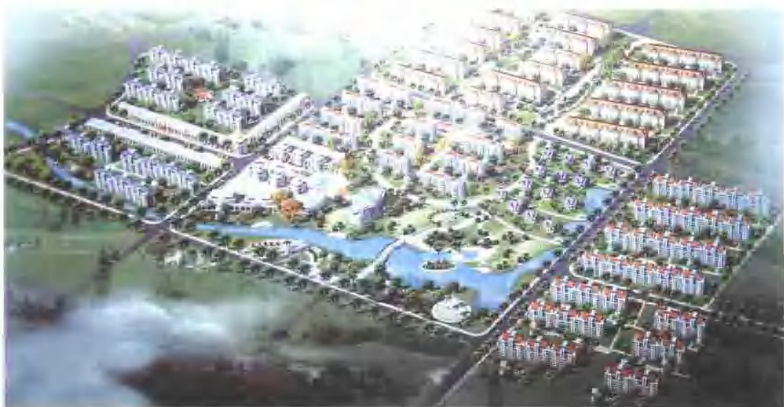
青岛环保产业园生活服务区

青岛环保产业园是在原青岛即墨工业园的基础上发展而来的市级工业园区，是山东省内惟一一处以环保产业为主的工业园。位于青岛市北部，园区周边有6条高速或一级公路通往济南/烟台/威海等城市。园区总规划面积10平方公里，现一期规划4.75平方公里已实现了“九通一平”标准，已投入基础设施建设资金总额8000余万元，二期规划正在施工当中。园内已落户企业68家，其中以“海汇生物”“金王集团”“纳米材料”“东阳国技”等企业为龙头，4家投资过亿元，12家投资过千万元的高科技环保企业，初步形成了一个深具发展潜力的环保产业隆起带，日益成为国内外商家投资兴业的一片热土。