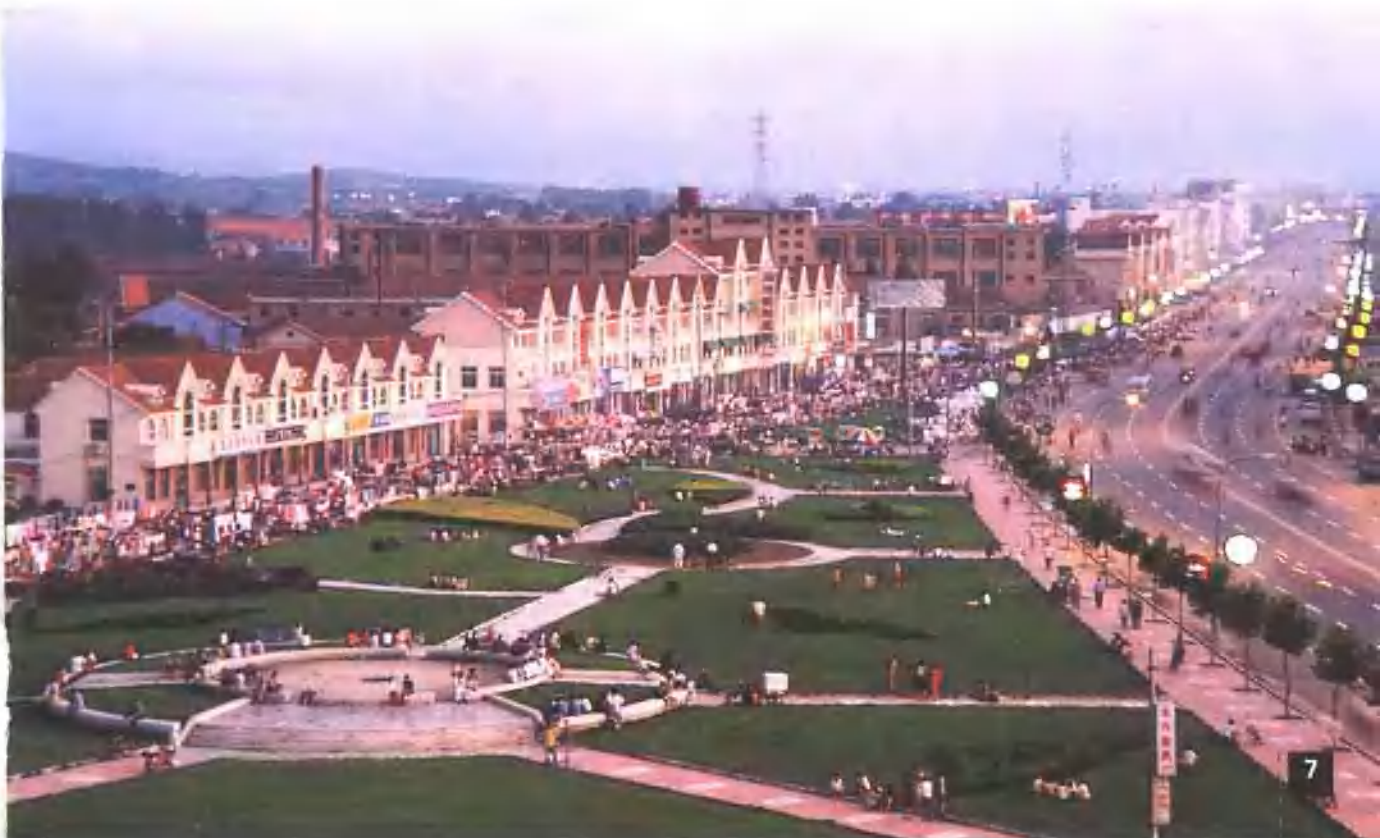
即墨市城区一角