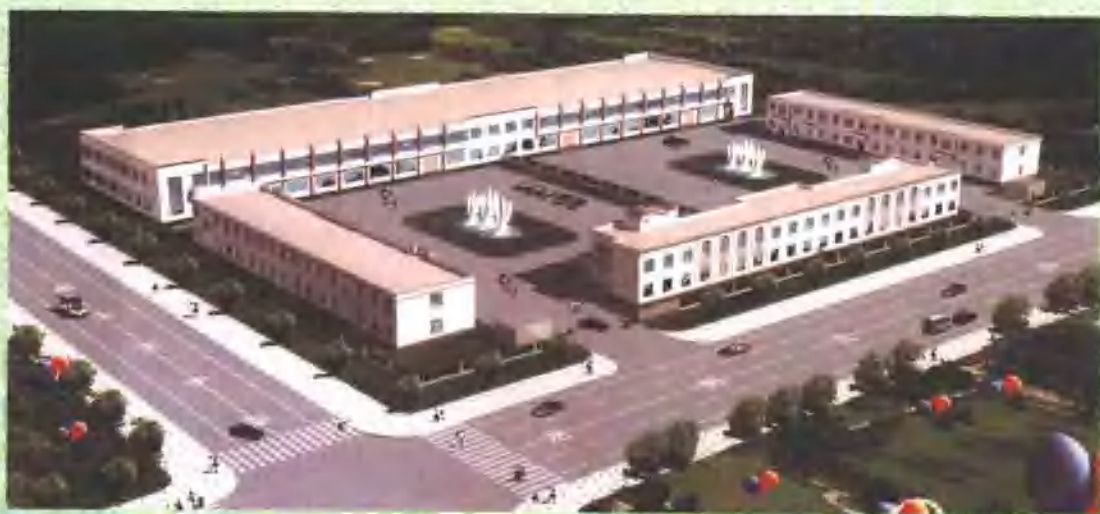
园区标准厂房效果图