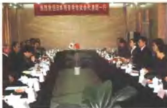
2001年11月29日，日本观音寺市议会代表团来即墨访问。