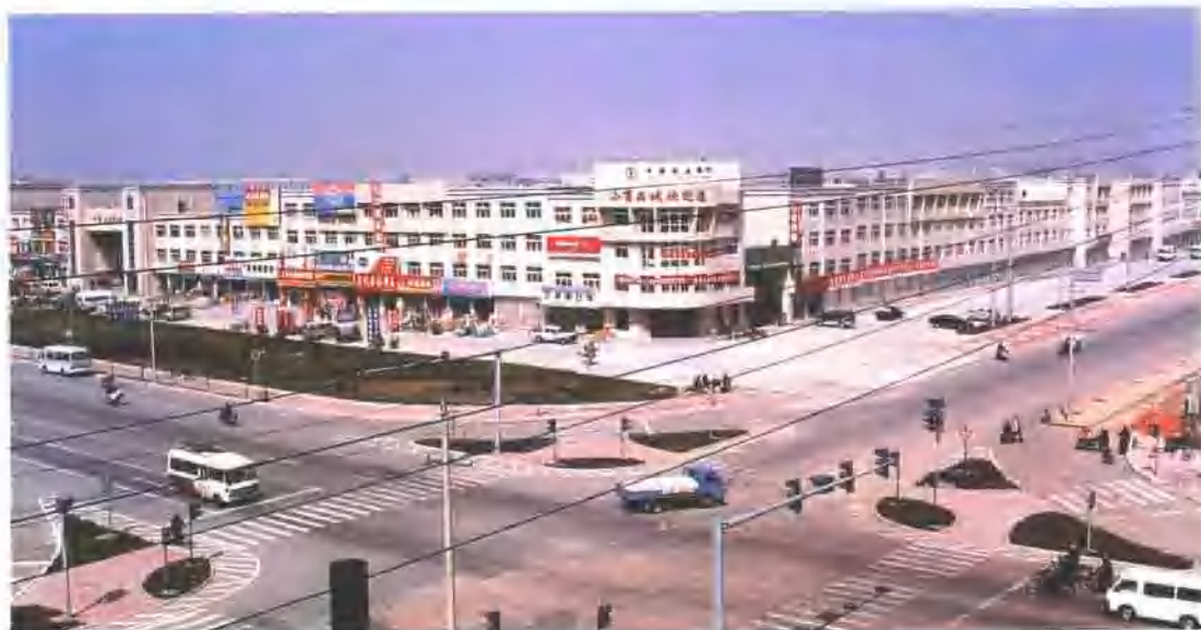
2001年竣工并开业的即墨小商品城厂家直销区