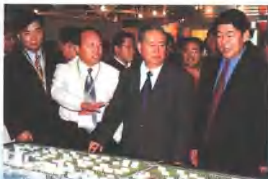
园区管委会主任王国世清（左二）向中央政治局委员、全国人大常委会副委员长姜春云，青岛市委书记张惠来等领导介绍园区情况