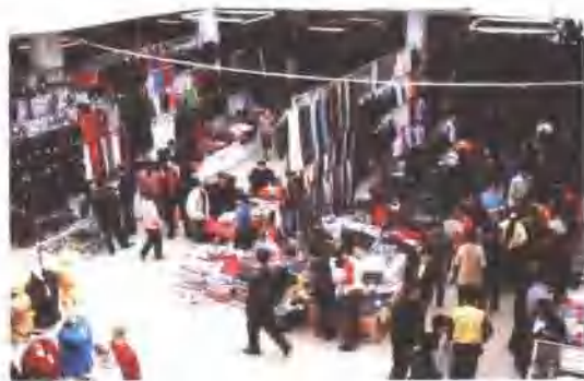
即墨服装批发市场建设规模与经营档次在全国同类市场名列前茅。图为即墨服装批发市场一角