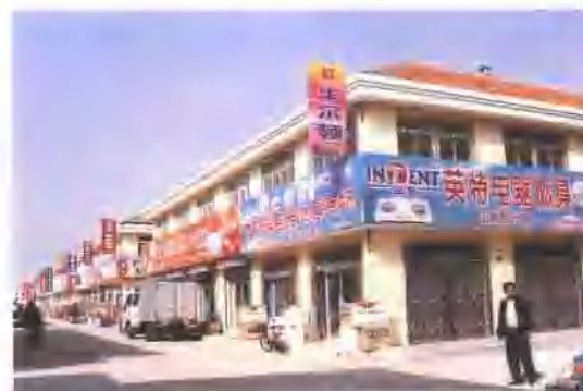
2001年竣工并开业的即墨自由厨具商城