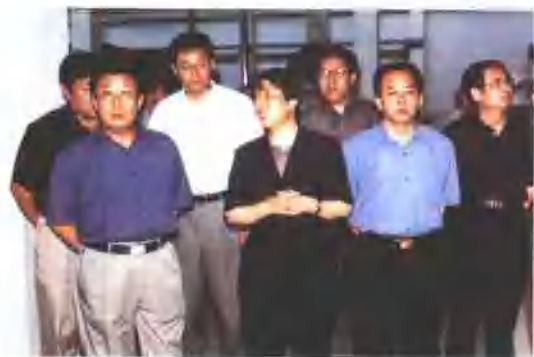
2001年6月6日，山东省人民政府副省长赵克志（左一）考察即发工业园。