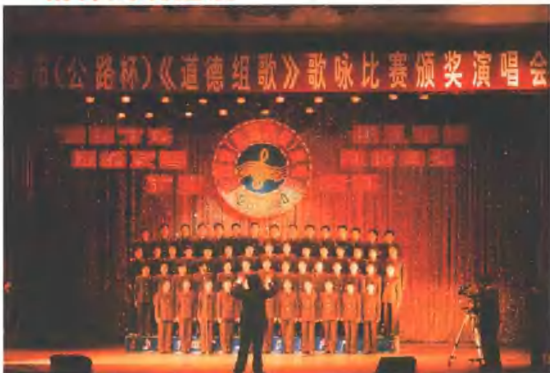
全市层层开展了《道德组歌》演唱比赛