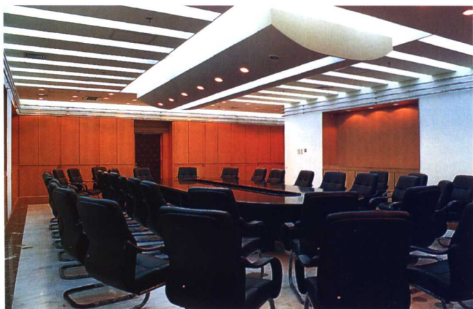
20-22 Designed by Professor Zheng Shuyang