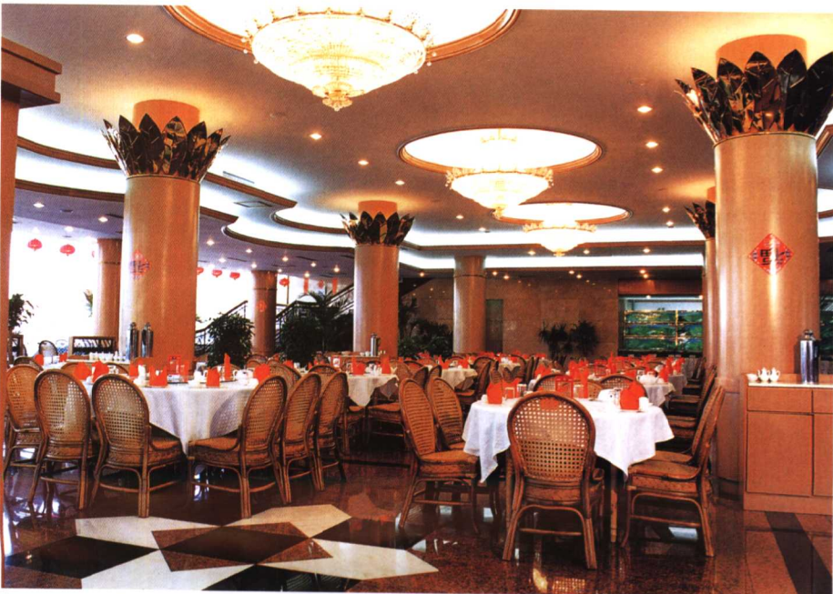
19. 大自然东北酒楼一楼大餐厅

18.The operation hall of Construction Bank of China in the Tangshan New Area