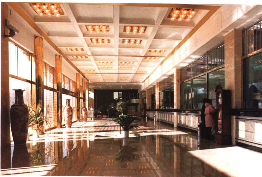
18. 唐山新区建设银行营业厅

17.The reception hall of Zhongnanhai Reception Building