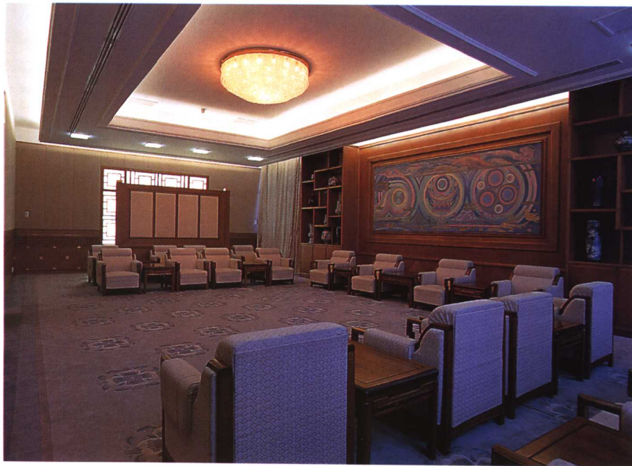
17. 国务院中南海外宾接待楼会客室

17.The reception hall of Zhongnanhai Reception Building