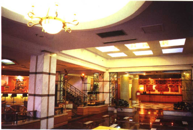
35.Beijing Texas Bar