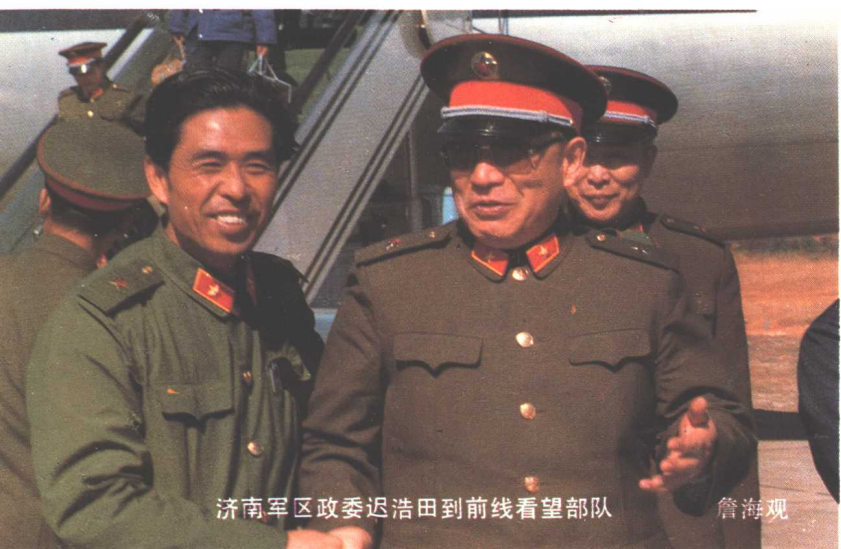
济南军区政委迟浩田到前线看望部队 詹海观