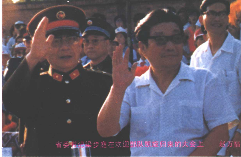
省委书记梁步庭在欢迎部队凯旋归来的大会上 赵万福