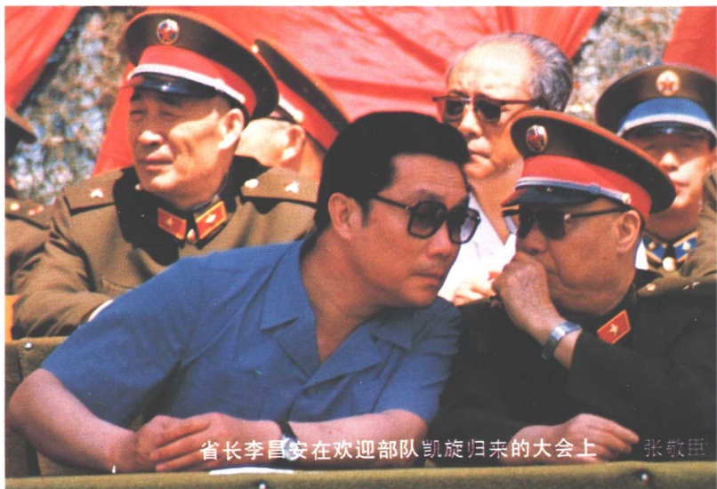
省长李昌安在欢迎部队凯旋归来的大会上 张敬臣