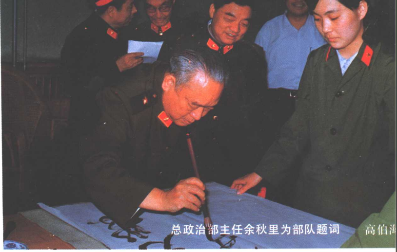
总政治部主任余秋里为部队题词 高伯海