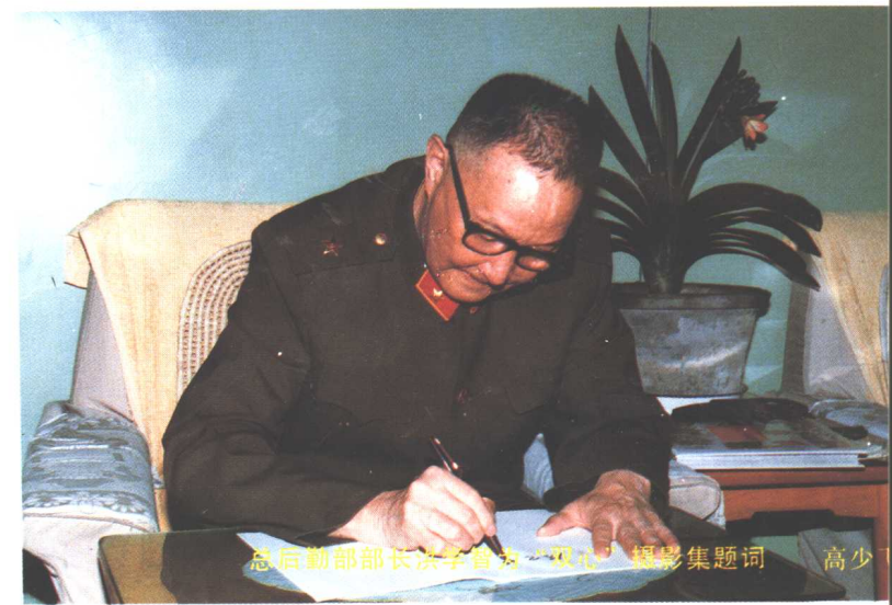
总后勤部部长洪学智为《双心》摄影集题词 高少飞