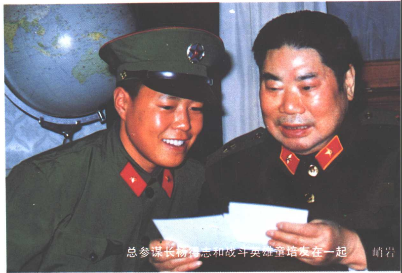
总参谋长杨得志和战斗英雄童培友在一起 峭岩