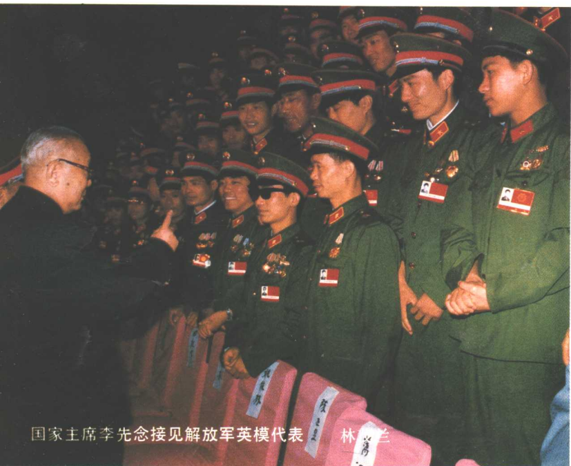
国家主席李先念接见解放军英模代表 林 兰