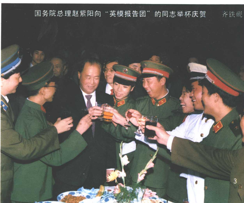
国务院总理赵紫阳向“英模报告团”的同志举杯庆贺 齐铁砚