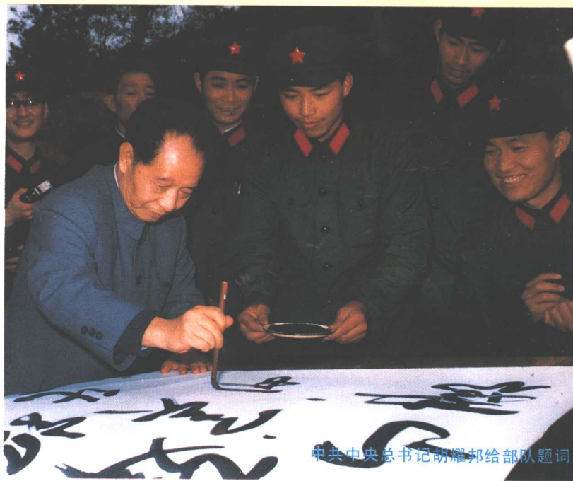
中共中央总书记胡耀邦给部队题词