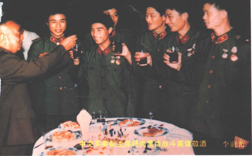
中央军委副主席杨尚昆给战斗英雄敬酒 李前光