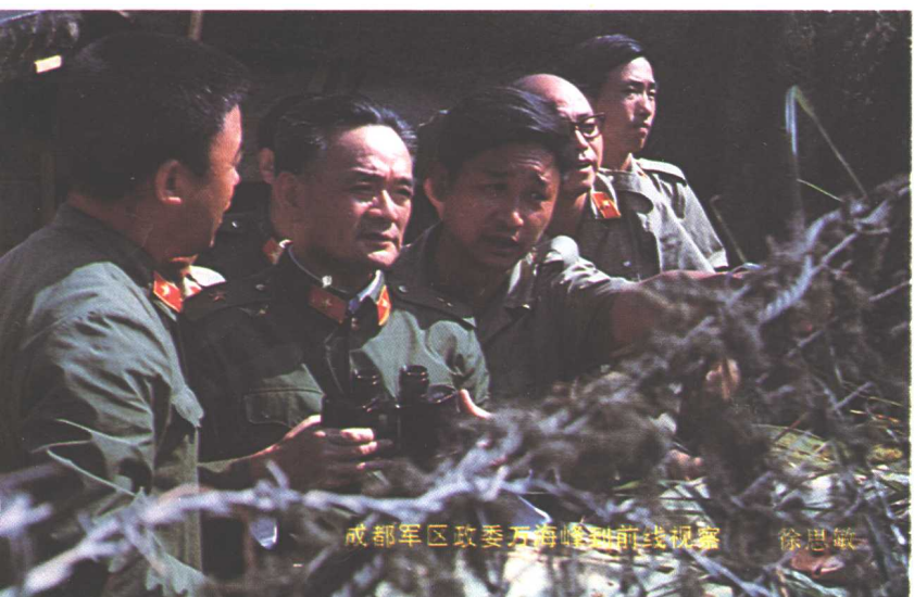
成都军区政委王海峰到前线视察 徐思敏