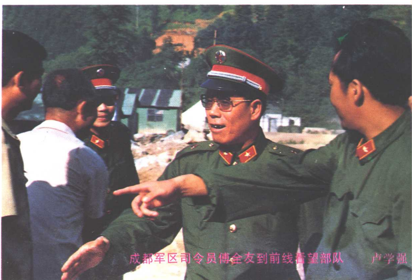
成都军区司令员傅会友到前线看望部队 卢学强