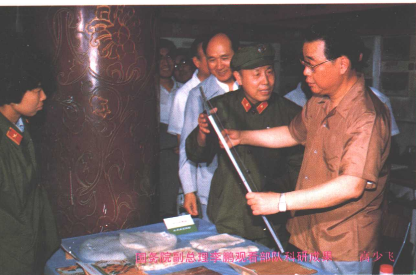
国务院副总理李鹏观看部队科研成果 高少飞