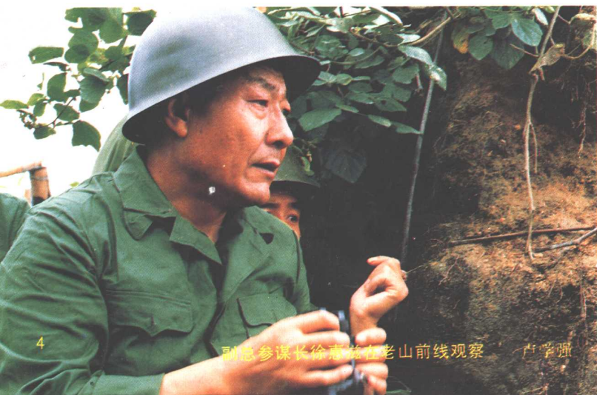
副总参谋长徐惠滋在老山前线观察 卢学强